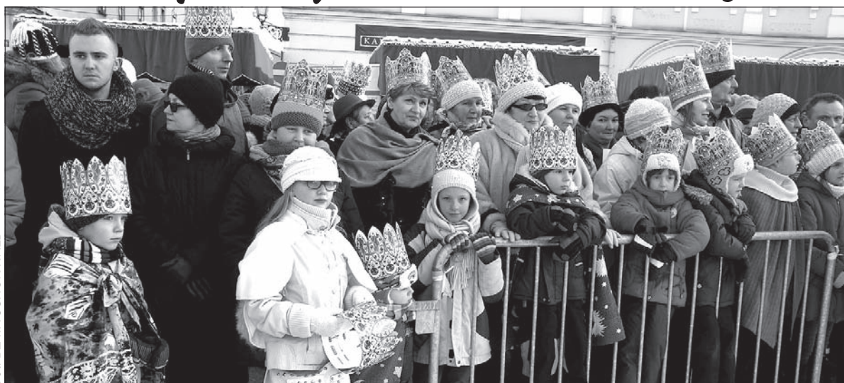
W Polsce jutro wolny dzień, Święto Trzech Króli.

Nowy rok to również nowe plany. Także te związane z wypoczynkiem i wakacyjnymi wyjazdami. Na kiedy je zaplanować, żeby skorzystać z wolnych dni przypadających na święta państwowe oraz ferie szkolne, a równocześnie, jeśli to możliwe, ustrzec się w czasie wycieczek tłumów?