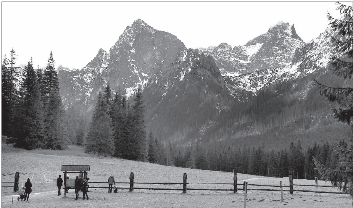
W takich warunkach bezpiecznie można chodzić jedynie po dolinach i oglądać Tatry Wysokie z perspektywy 1000 metrów nad poziomem morza. Na zdjęciu Dolina Białej Wody.

Ratownicy TOPR i słowacka HZS kilka razy interweniowali też w sylwestrową noc. Najbardziej drama-