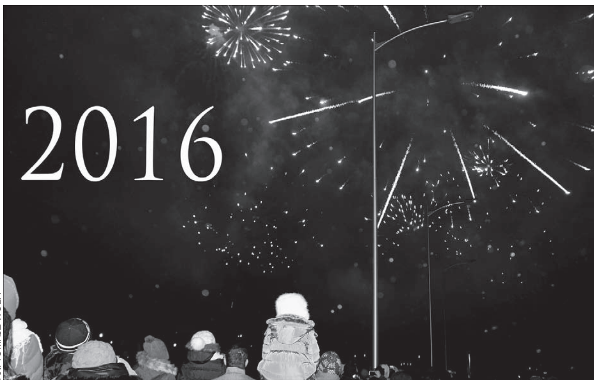
Rok 2016, który przywitaliśmy fajerwerkami, przyniesie m.in. zmiany podatkowe.

W gruncie rzeczy jednak wynagrodzenie minimalne, które jest wziętym tematem politycznym, dla większości pracowników nie ma zasadniczego znaczenia. Powód jest prosty: minimalne wynagrodzenie otrzymuje niewielki odsetek osób. – Najnowsze kompleksowe dane na ten temat mamy z 2014 roku. W naszych tabelkach statystycznych