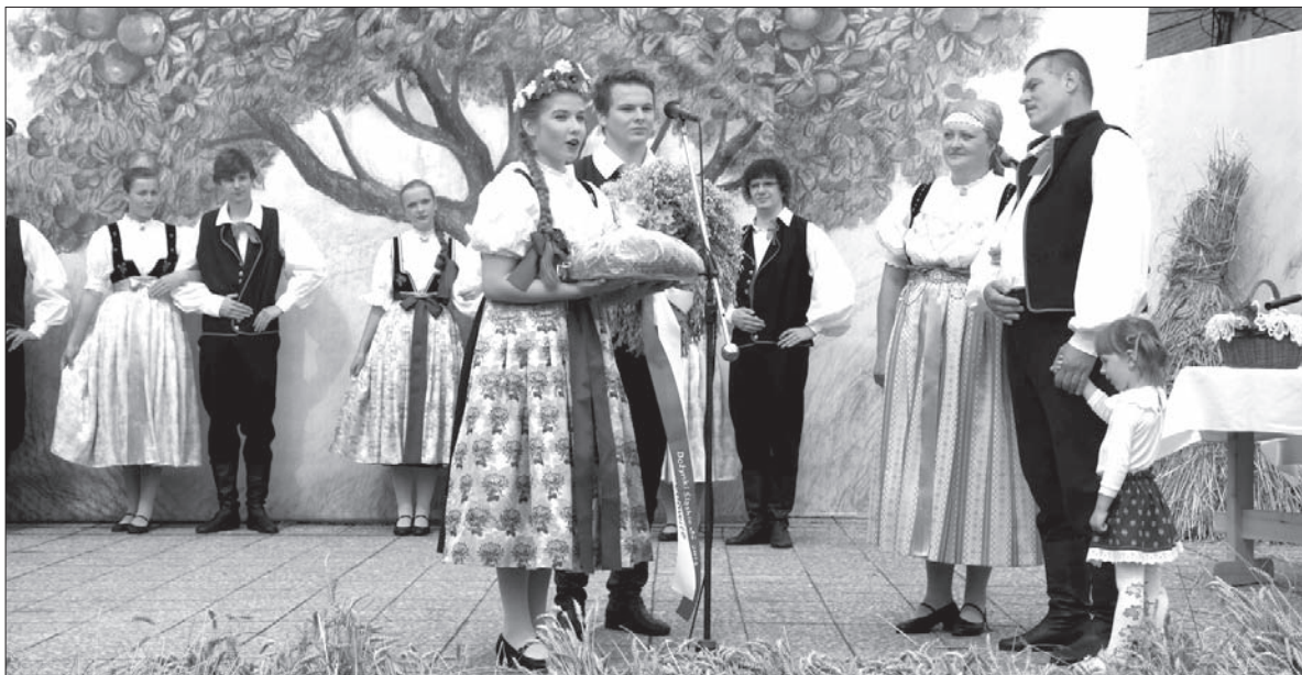
Koła PZKO oraz SAJ będą mogły nominować do konkursu imprezy, działaczy, zespoły i inicjatywy. Na zdjęciu działający przy MK PZKO w Błędowicach zespół „Błędowice” podczas obrądku dożynkowego.