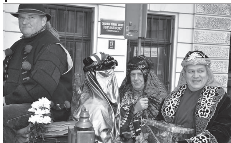
Wczoraj przez ulice ponad 400 polskich miast przeszły Orszaki Trzech Króli. 6 stycznia był świętowany także na ulicach Cieszyna. Główna impreza na Rynku rozpoczęła się po godz. 13.00 i cieszyła się ogromną popularnością. (wot)