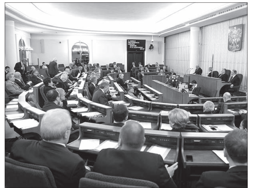
Senat będzie ponownie zajmować się rozdysponowywaniem pieniędzy dla Polonii.