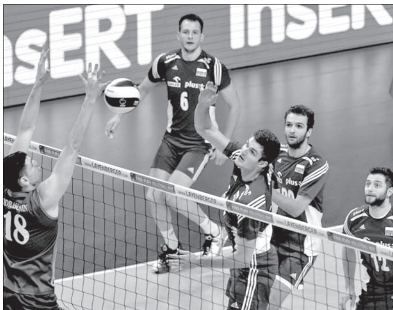
Udany początek turnieju w wykonaniu Polaków.

Sety: 22:25, 25:18, 25:23, 25:21. Polska: Bartosz Kurek, Karol Kłos, Michał Kubiak, Mateusz Bieniek, Grzegorz Łomacz, Mateusz Mika, Paweł Zatorski (libero), Damian Wojtaszek (libero), oraz Fabian Drzyzga, Dawid Konarski, Rafał Buszek, Marcin Możdżonek. (jb)