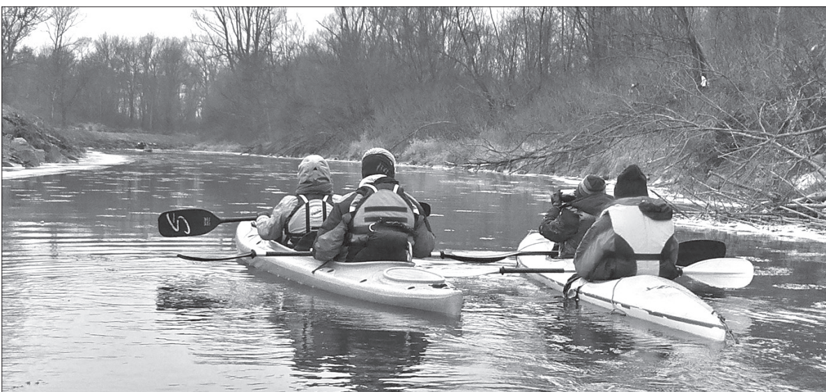
Trasa spływu liczyła niespełna 8 km.