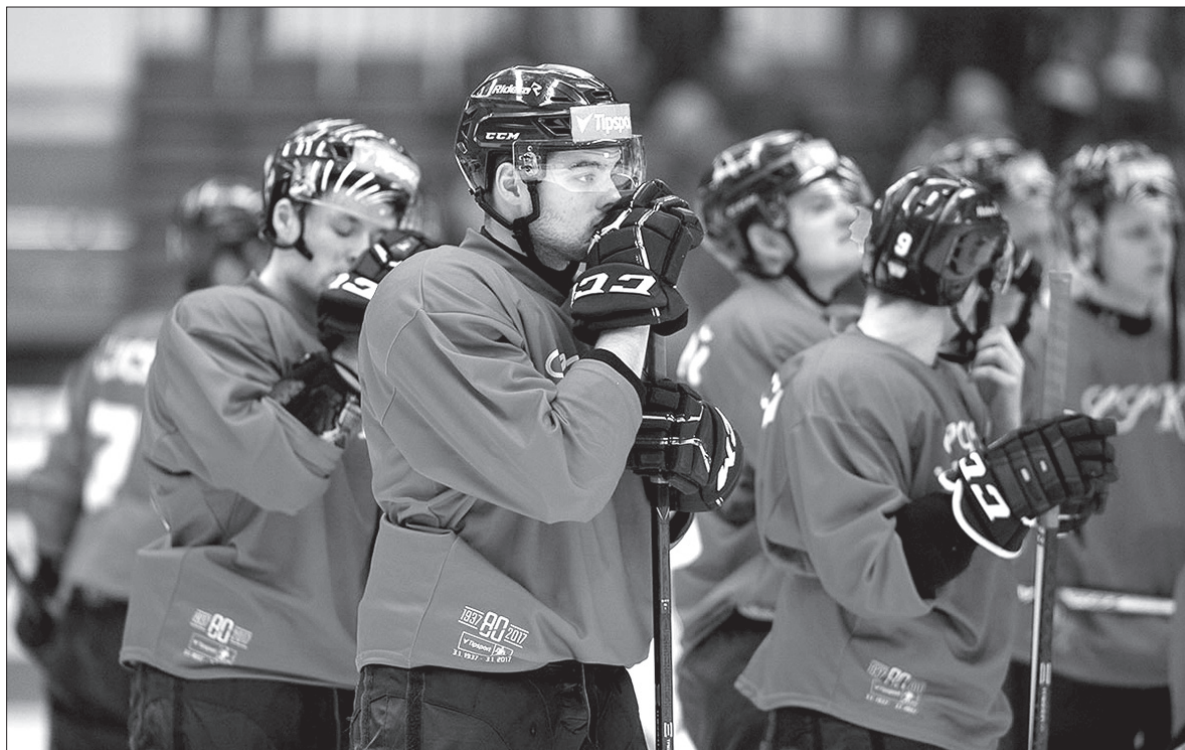
Nie tak wyobrażali sobie hokeiści Witkovic uroczysty mecz z okazji 80-lecia ekstraligi.

Podopieczni Vladimíra Kýhosa i Reného Muchy pojechali do Zlina w roli faworyta, Barany szybko jednak sprowadziły trzynieckich hokeistów z obłoków na ziemię. – Zlin potwierdził zwyczaj formy. To nie