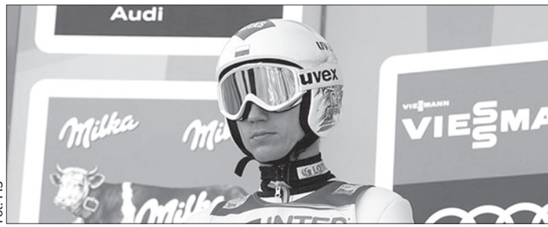
Kamil Stoch

Z Polaków, oprócz Kamila Stocha, dzielnie walczyli Maciej Kot i Piotr Żyła (obaj po 121 m), dramatem powiało natomiast w kadrze Austriaków – Stefan Kraft, wicelider klasyfikacji TCS skoczył, a raczej spadł na 116 m. Dla Krafta w zasadzie skończyła się wczoraj walka o zwycięstwo w 35. Turnieju Czterech Skoczni.