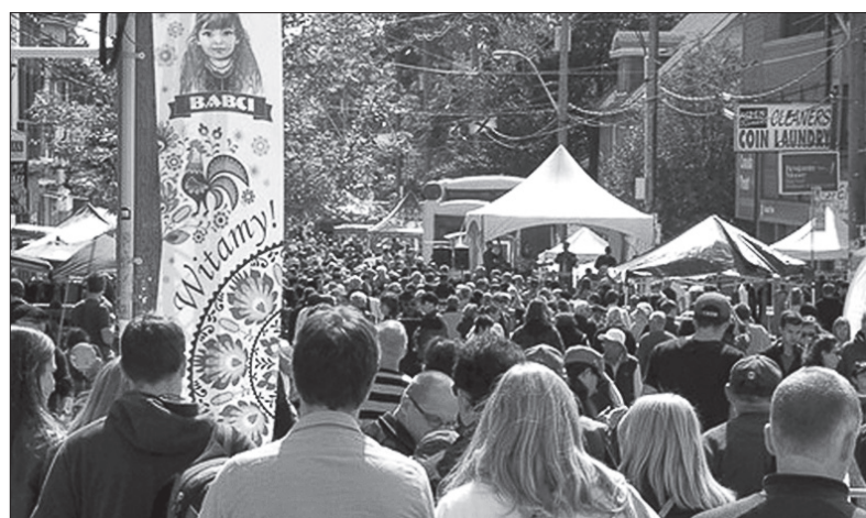
Polski festiwal w Toronto.

– Wielu Polaków i Kanadyjczyków polskiego pochodzenia zostawiło Toronto i przeprowadziło się do największego skupiska naszych rodaków, czyli położonego w sąsiedztwie miasta Mississauga. Wielu wróciło jednak do historycznie polskiego miejsca w Toronto. Mój syn otworzył w Roncesvalles swoją firmę, inni członkowie rodziny też tu powrócili – zaznaczył