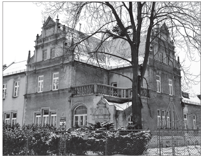
Willa w Alejach Masaryka pochodzi z 1899 roku.

Morawsko-Sląska Biblioteka Naukowa już od 1951 roku działa w prowizorycznych warunkach w budynku Nowego Ratusza. Na pytanie „GL”, czy obecne władze województwa zdecydowały się na budowę również w przypadku, gdy nie dostaną na ten cel dotacji, przedstawicielka Urzędu Wojewódzkiego odpowiedziała, że decyzja jeszcze nie zapadła. (dc)