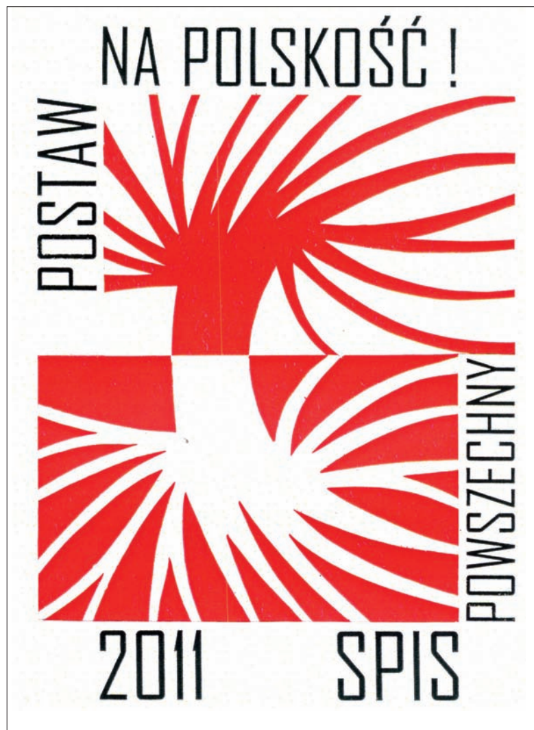
Projekt nr 2