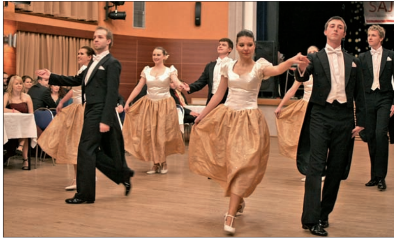
Zespół „Olza” przedstawił swój nowy program balowy po raz pierwszy na Balu Akademickim w Trzynieckim.

Szefowa „Błędownic” opowiada, że program balowy „Błędownic” składa się z trzech części w różnych stylach i kostiumach. – Rozpoczynamy uroczyste, „Marszem Radeckiego” w białych sukniach i czarnych frakach. Są też tańce klasyczne, współczesne, a także sceniczne, na przykład scenka „Bal wampirów”. Muszę też podkreślić, że przy tworzeniu programu pomagają mi bardzo starsi tancerze naszego zespołu – mówi szefowa „Błędownic”. W najbliższym