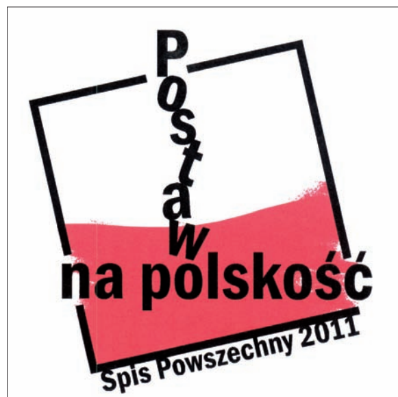
Projekt nr 4