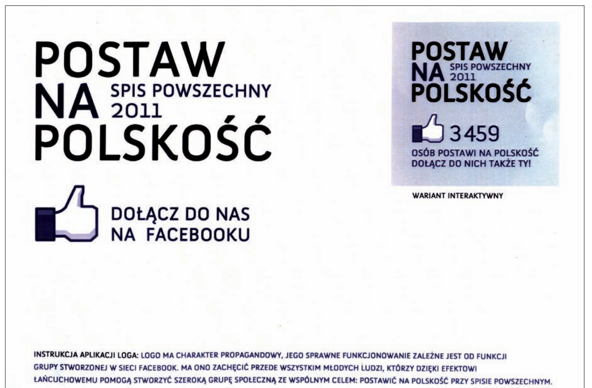
Projekt nr 9