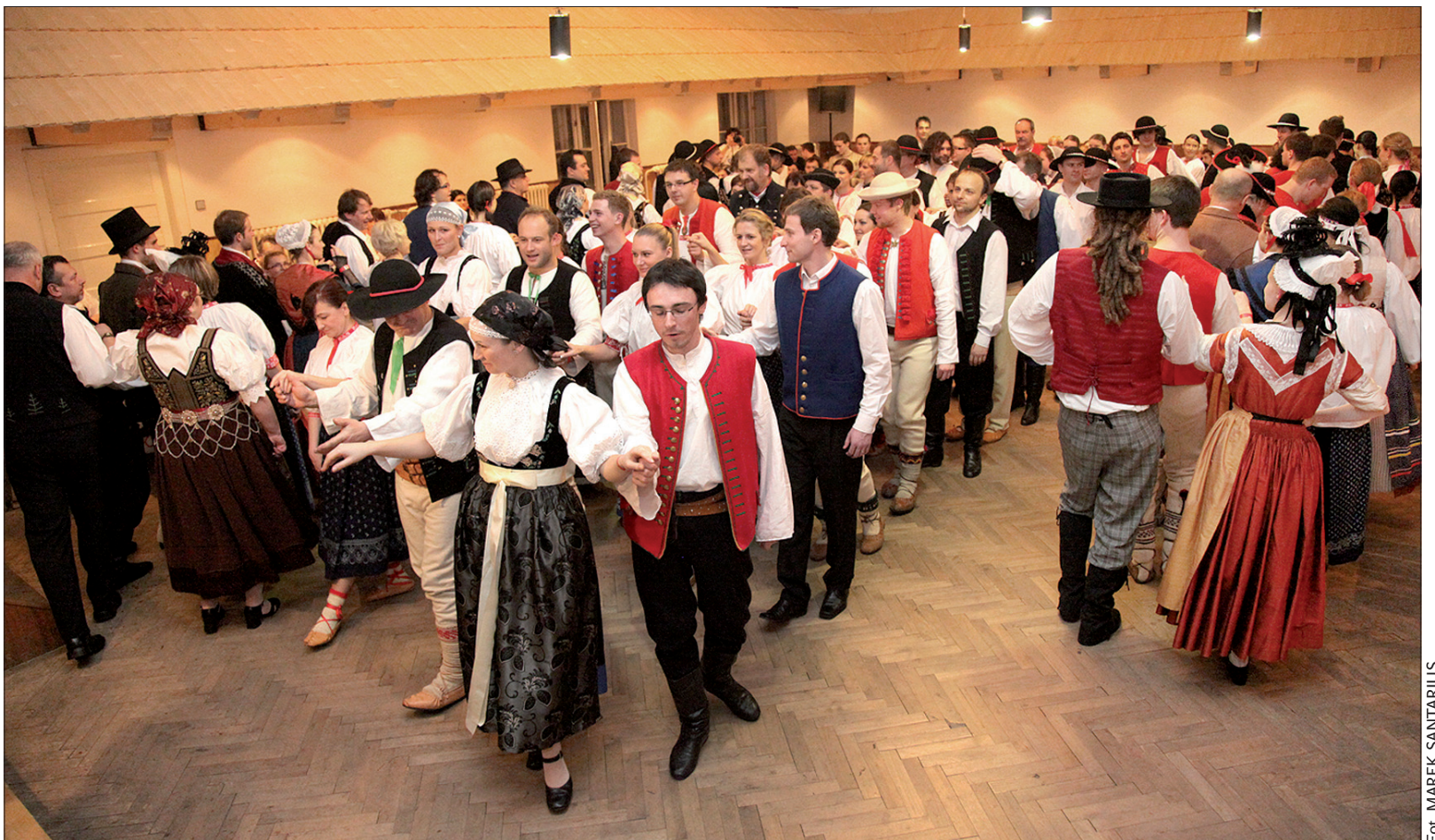
Na Balu Gorolskim obowiązuje strój ludowy.