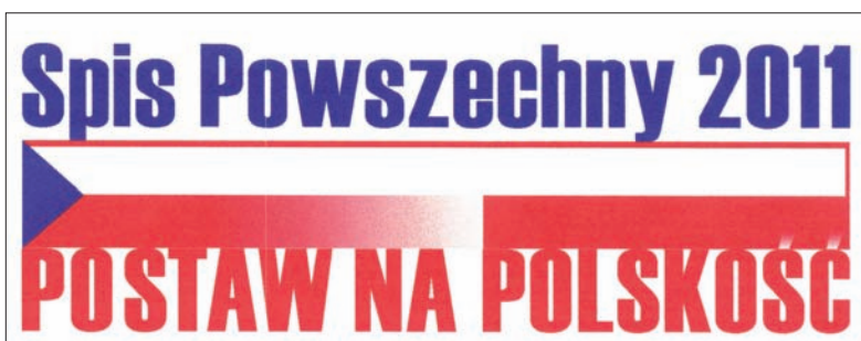
Projekt nr 8