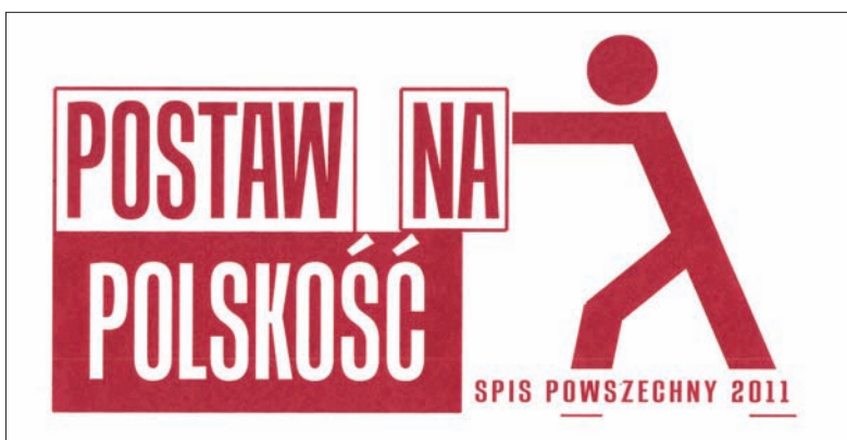
Projekt nr 6