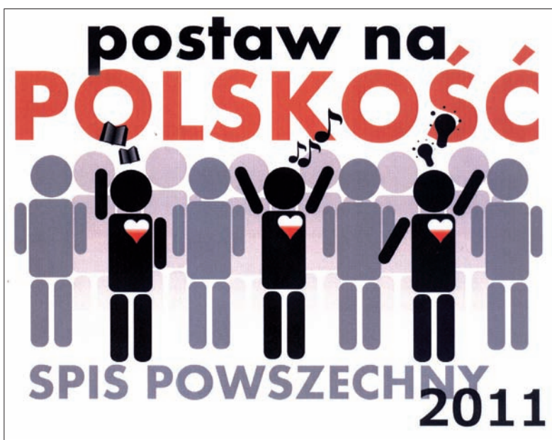
Projekt nr 3