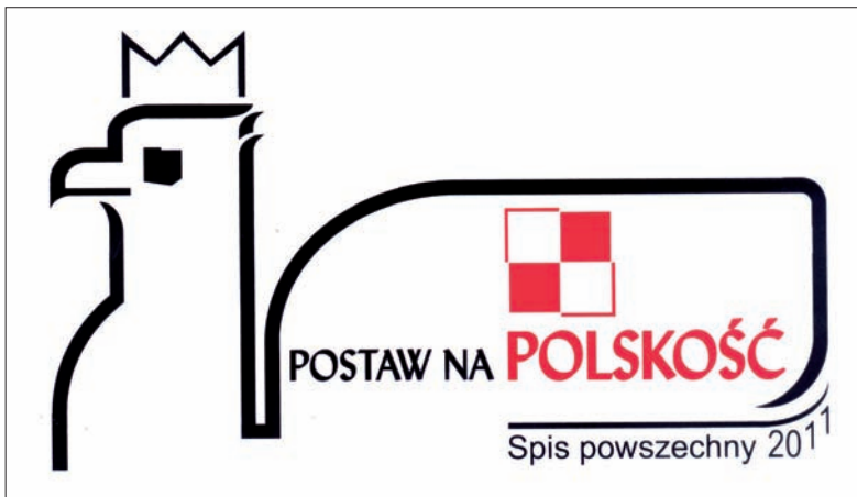
Projekt nr 1