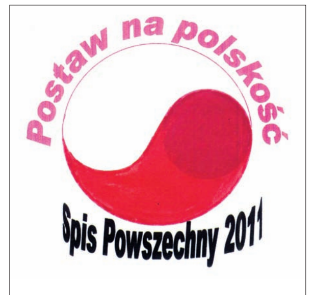
Projekt nr 5