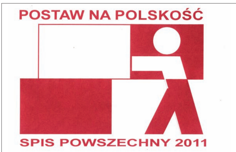
Projekt nr 7