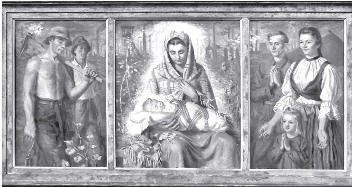
Tryptyk „Ostrawska Madonna” wystawiony jest w katedrze Boskiego Zbawiciela.