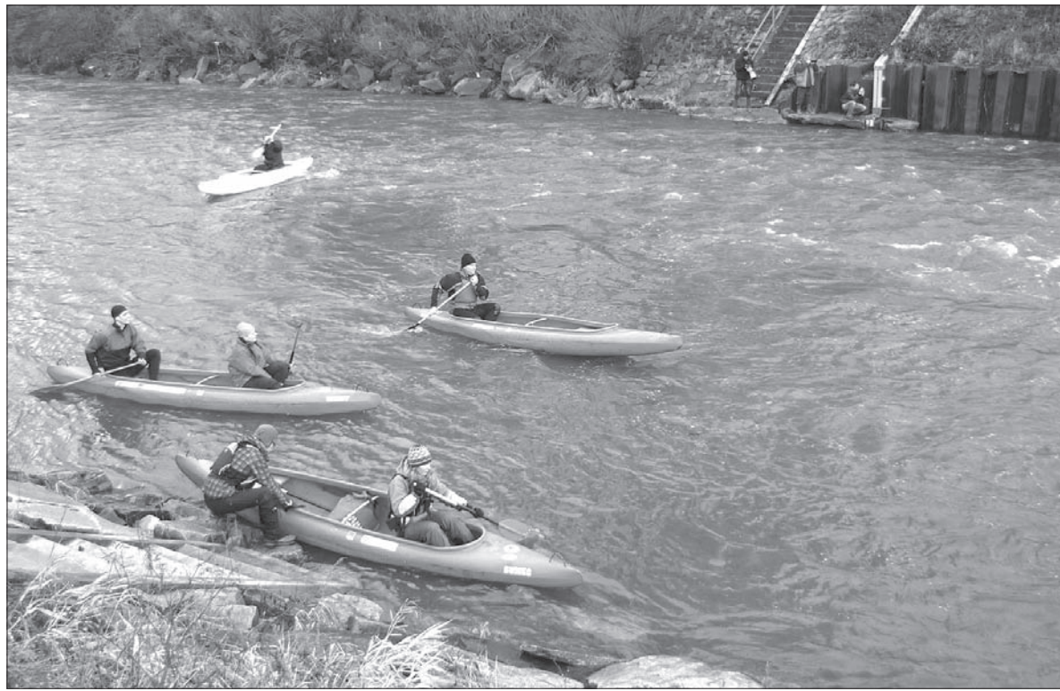
Miłośnicy kajakarstwa podczas Noworocznego Spływu Kajakowego Olzy.