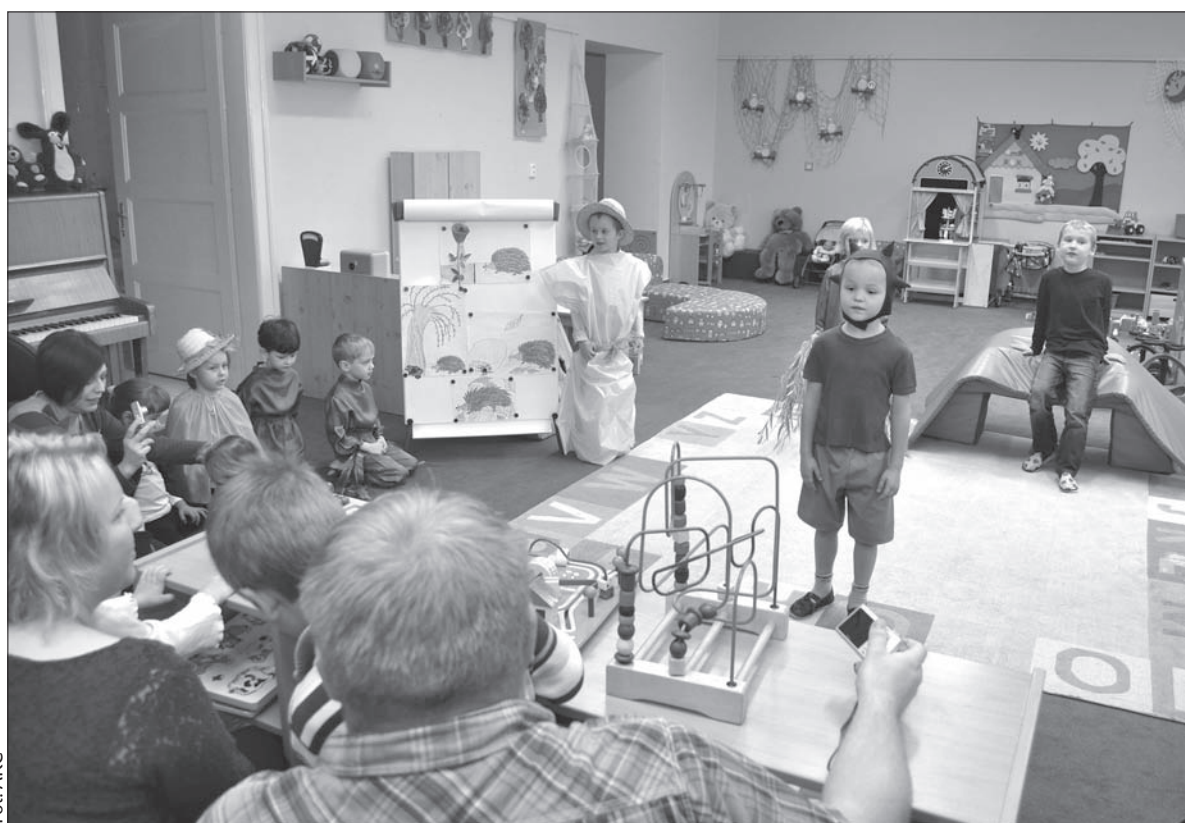
Promocja polskich szkół rozpoczyna się w przedszkolu. Dzień Otwartych Drzwi w górnosuskiej podstawówce.

Jak konkretnie wygląda owa promocja polskich szkół? I czy polskim placówkom udaje się trafić również do niezdecydowanych polsko-czeskich małżeństw mieszanych? – Na nasze imprezy szkolne zapraszamy nie tylko rodziców czy dziadków, ale wszystkich mieszkańców gminy. Nasi uczniowie widoczni są zarówno na imprezach Miejscowego Koła PZKO, jak i na imprezach gminy. Uczniowie biorą udział w wielu wyjazdach i wycieczkach, co dwa lata dzieci z niższych klas wyjeżdżają na Zieloną Szkołę. O tym wszystkim informujemy na łamach „Gazety Wędrzyńskiej” – wymienia dyrektor polskiej