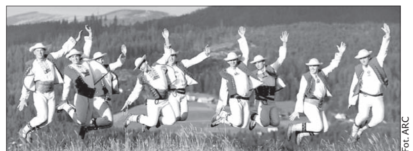
Zespół „Istebna” to na pewno jedna z atrakcji Beskidu Śląskiego.