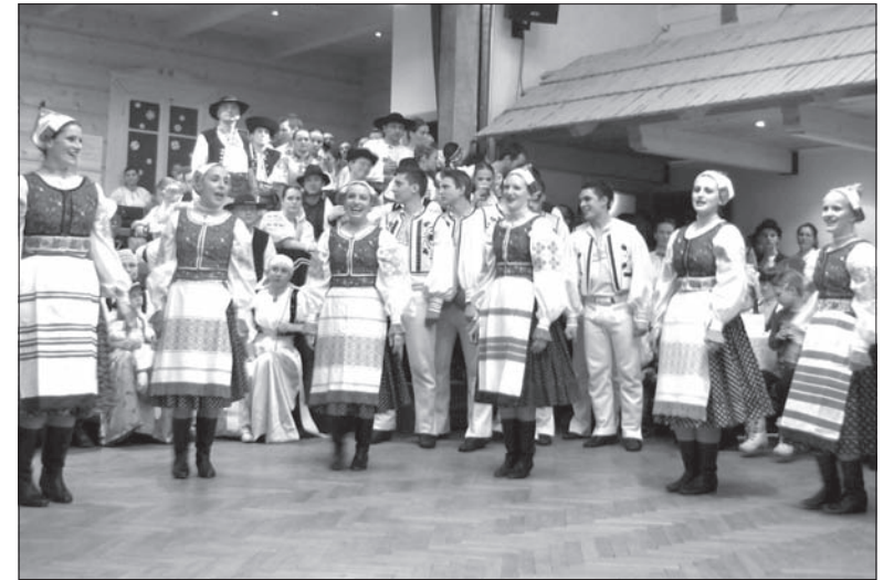
„Jánošíček” z Brna.

Sobotni 35. Przegląd Kapel Ludowych, Zespołów Folklorystycznych oraz wieczorny Bal Gorolski przyciągnęły do mosteckiego Domu PZKO tłumy miłośników folkloru, którzy swoje stroje galowe zamienili na ludowe. Tegoroczny Przegląd można uznać za wyjątkowo różnorodny.