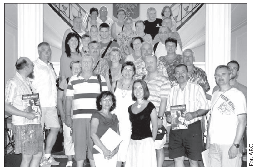
Klub Polski „Polonus” w pełnej krasie.