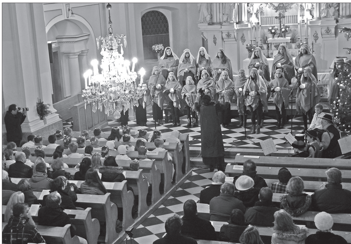
Chór szkolny „Crescendo” z PSP w Bystrzycy w czasie piątkowego koncertu w miejscowym kościele ewangelickim.

– Koleda, koleda, na skrzypczkach granie, niech leci do nieba to nasze śpiewanie... – intonowały szkolne „Wiolinki”. Młodszy chór, do