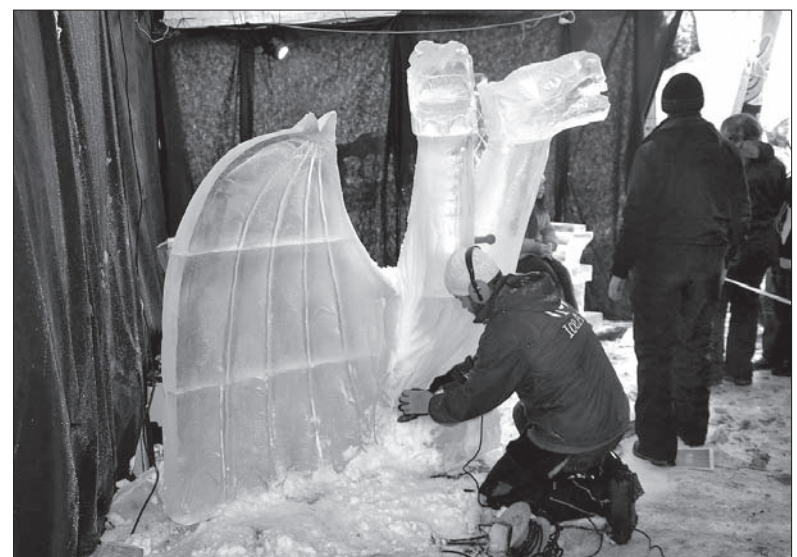
Takie lodowe cuda można przez cały styczeń podziwiać na Pustewnach.