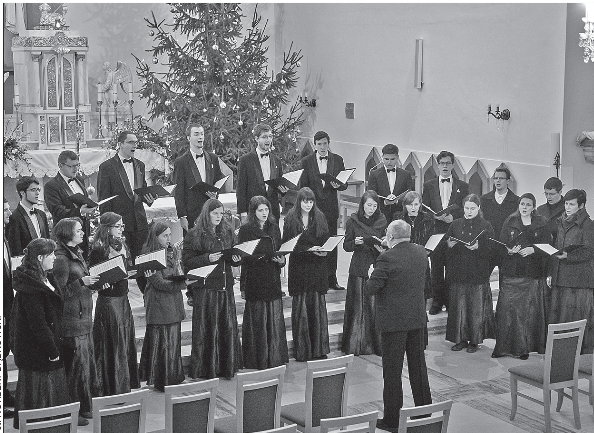
Występ „Canticum Novum” zrobił na wszystkich duże wrażenie.

Z kolei 21 stycznia odbędzie się kolejny wykład w ramach popularnego wśród starszych trzynieczan Seniorgimnazjum. Wykład poświęcony będzie tym razem Izraelowi, a spotkanie połączone zostanie z ceremonią wręczenia certyfikatów części absolwentów ubiegłego rocznika tej szkoły dla seniorów. Natomiast w ostatni czwartek stycznia miłośnicy plastyki będą mogli wziąć udział w warsztatach poświęconych sztuce witrażu. (kor)