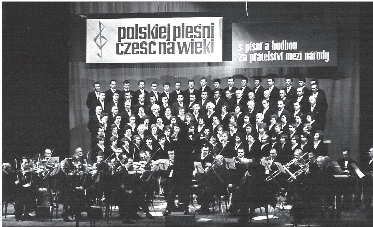
W latach 1966-1993 karwińska „Przyjaźń” rozwijała swoją bogatą działalność w budynku „Dům družby – Dom Przyjaźni”. Na zdjęciu Koncert Jubileuszowy „Przyjaźni” w r. 1968 z okazji 10-lecia istnienia zespołu.

W roku 1966 zostałem dyrektorem Klubu Zakładowego Kopalni Armia Czechosłowacka w Karwinie. Prowadziłem wtedy karwiński Zespół Śpiewaczo-Muzyczny „Przyjaźń” ósmy rok. Zespół pracował od chwili założenia w r. 1958 przy Miejskich Kołach PZKO w Karwinie-Frysztacie i Karwinie-Nowym Mieście. Próby zespołu odbywały się w drewnianym budynku frysztackiego MK PZKO (obok przedszkola), a czasami w teatrzyku Polskiej Szkoły Podstawowej w