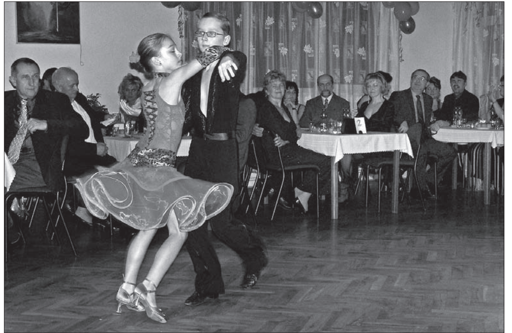
Tańce latynoamerykańskie zaprezentowała na Kościelecu młodzieńcza para z trzynieckiego „Elánu”.