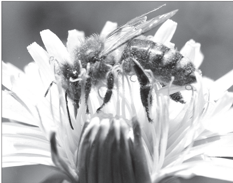
Zima pszczołom nie jest straszna. Poradzą sobie w każdych warunkach.

powiadają jednak zbyt obfitych opadów śniegu. Możliwe, że do połowy lutego, a może i dłużej śnieg nie przykryje ozimych upraw. Co wtedy będzie? – Śnieg teoretycznie jest dobry, ale wszystko musi być z umiarem. Kiedy utrzymuje się jednak zbyt długo, może powodować zżelenie się zboża oraz jego pleśnienie – przestrzega Hyrnik.