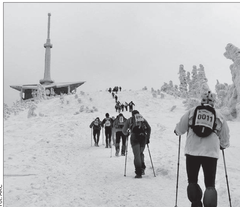
Ubiegłoroczny zimowy wymarsz ekstremalny na Łysą Górę.