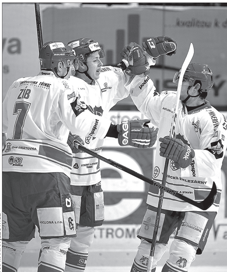
Stalownicy rozbili u siebie obrońców tytułu.