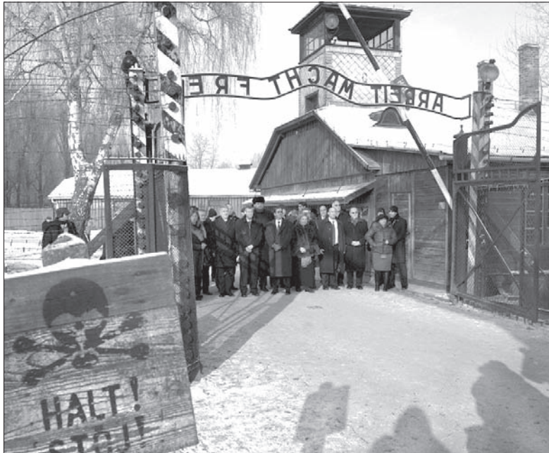
Delegacja parlamentu Izraela podczas zwiedzania byłego niemieckiego obozu Auschwitz.

– Nie ma precedensu dla koszar, jaki przydarzył się tutaj naszemu narodowi w całej historii