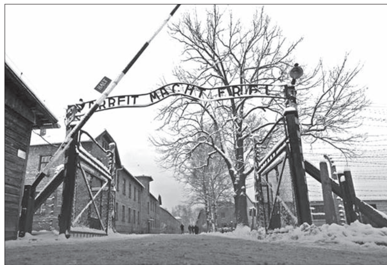
Symbolem obozu Auschwitz stała się brama z napisem „Praca czyni wolnym”.

Organizatorzy uroczystości podkreślali, że to właśnie byli więźniowie są głównymi bohaterami obchodów rocznicy. Okazało się również, że ludzie ci nadal chcą dawać świadectwo tego, co działo się w Auschwitz tak,