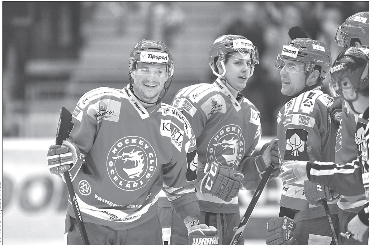
Stalownicy w meczu na szczycie nie pozostawili złudzeń rywalowi.

Obrona własnej strefy, z wykorzystaniem pressingu w środkowej części lodowiska, to atuty, które zdołał obecny zespół Trzyńca. Trener Jiří Kalous w znaczący sposób poprawił defensywę drużyny, która popelnia minimum błędów nawet pod dużym presją. – Dla bramkarza to tylko