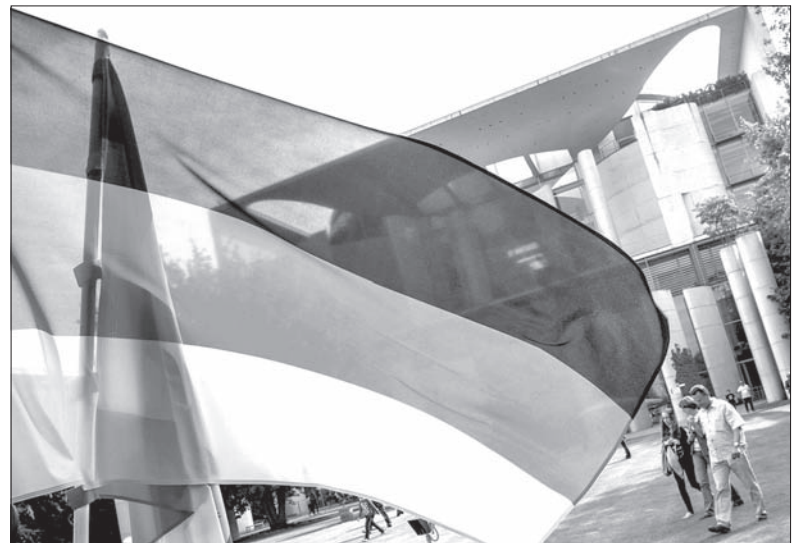
Według różnych szacunków, w Niemczech mieszka od 1,6 do 2 milionów osób o polskich korzeniach.

Niewielu Polakom udało się przełamać te sztuczne bariery. Jednym z wyjątków był hrabia Bogdan Hutten-Czapski, który stał się zastraszonym cesarza Wilhelma II. W pruskiej armii służyło