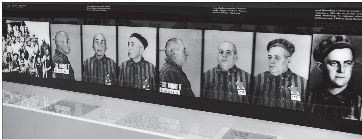
W Auschwitz Niemcy zamordowali ponad 1,1 miliona więźniów, głównie Żydów.