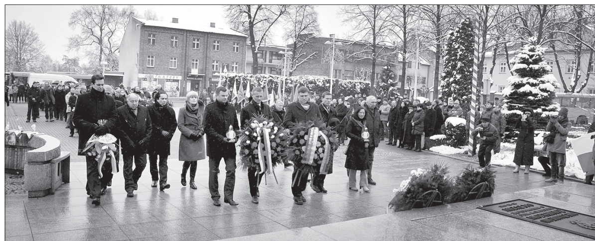
Rocznicowe uroczystości odbyły się również w mieście Oświęcimiu. Na zdjęciu składanie wiązanek kwiatów na Grobie Nieznanego Żołnierza.