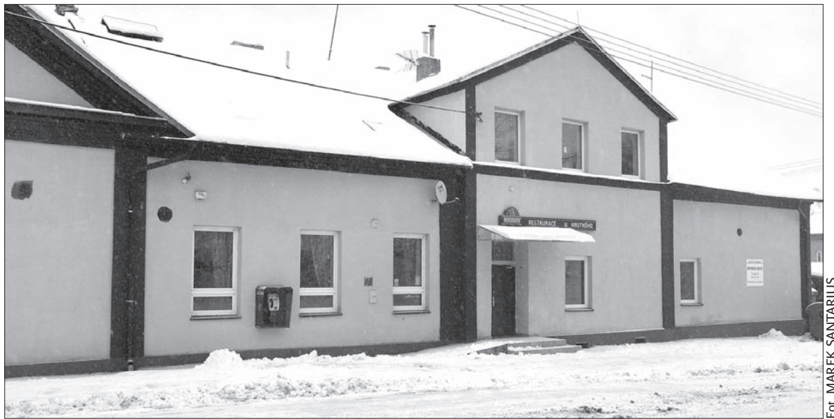
Gospoda „U Krutkiego” w Piotrowicach.

Kiedyś były tam restauracja i hotel, a w dużej sali odbywały się przedstawienia teatralne. Od 1929 roku aż do lat 90. ub. wieku działało w tym budynku również kino „Elektra”. Gospoda „U Krutkiego” w Piotrowicach, założona na przełomie XIX i XX wieku, zapisała się nawet w polskiej historii – to tam w 1919 roku miał siedzibę sztab, który zdecydował o rozpoczęciu I powstania śląskiego. W ostatnich latach budynek nie przynosił wiosce zaszczytu, ponieważ służył jako noclegownia. Teraz gmina postanowiła go odkupić. Ostateczna decyzja zapadła w ub. tygodniu, na czwartej sesji Rady Gminy. Z kasy samorządowej powędruje na konto prywatnych właścicieli 6,5 mln koron. Kolejne miliony gmina będzie musiała wyłożyć na remont. W planach jest przekształcenie budynku na dom kultury z zapleczem, w którym będą się odbywały imprezy kulturalne i towarzyskie. Znajdzie się tam też miejsce dla nowej biblioteki.