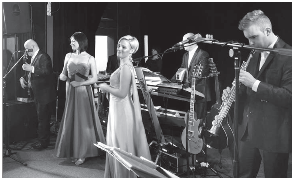
Do tańca przygrywała orkiestra Rivieras.