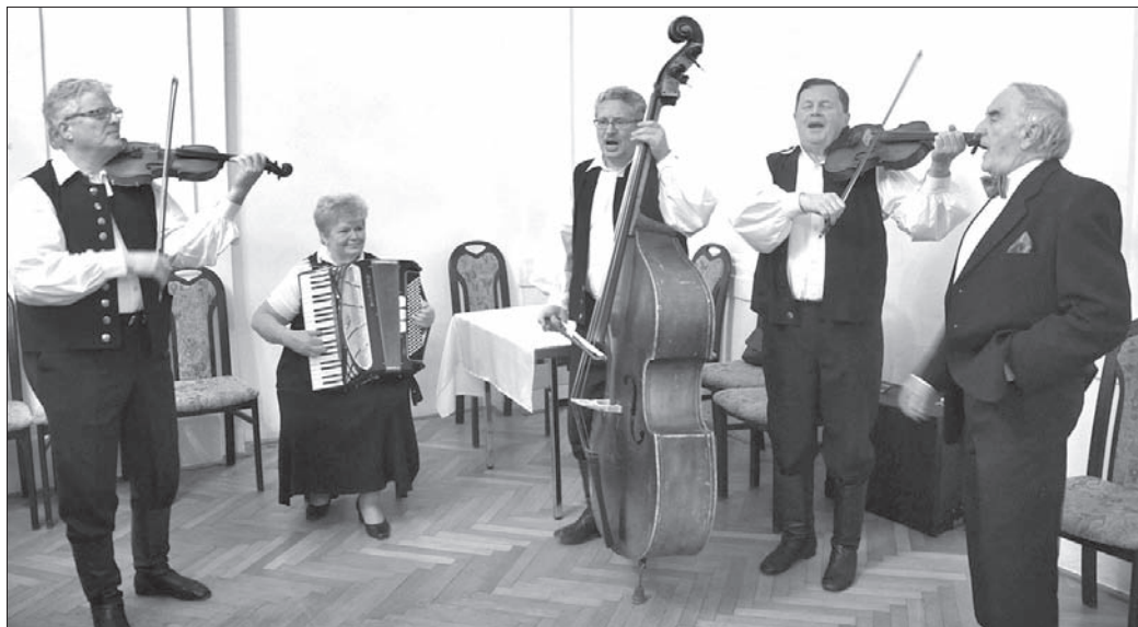
Jak na Bal Świąteczny przystało, nie mogło zabraknąć naszych, cieszyńskich pieśni.