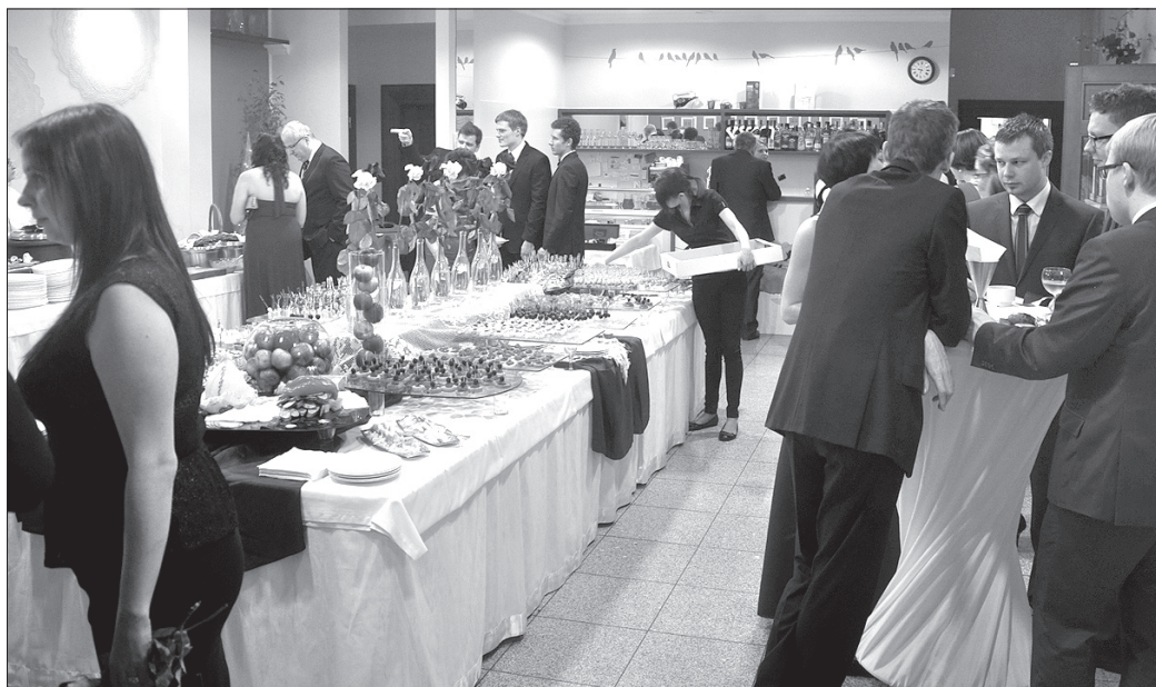
Na uczestników balu czekał m.in. bogato zastawiony szwedzki stół.