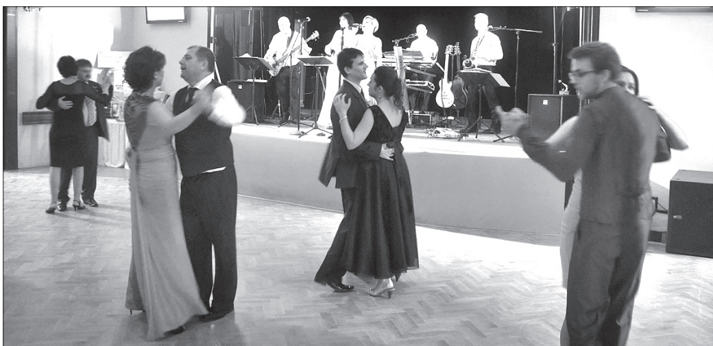
W piątkową noc pary szalały na parkiecie do białego rana.