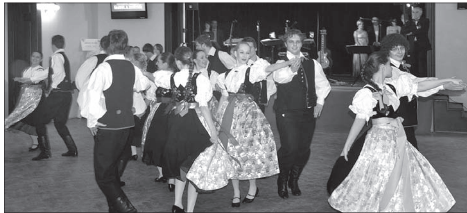
W akcji zespół „Błędowianie”.