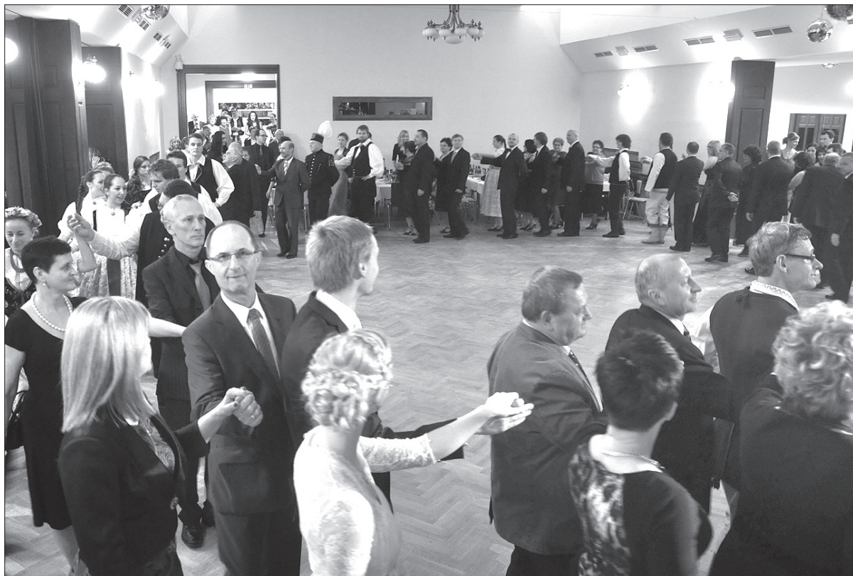
Na Reprezentacyjnym Balu Świątecznym nie zabrakło tradycyjnego poloneza.