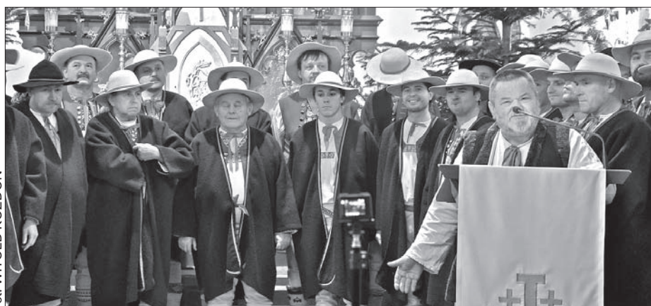
W niedzielę w kościele na Sałajce zaśpiewał m.in. chór męski „Gorol” z Jabłonkowa.

Dzisiaj jednak górnołomniańska świątynia wymaga remontu. Odnowić trzeba zwłaszcza dach, ale także elewację i wnętrza. Inwestycja pochłonie ok. 5 mln koron. Parafia uzyskała wprawdzie dotację z Programu Odnowy Wsi czeskiego resortu rolnictwa, niemniej musi jeszcze znaleźć 1,650 mln koron. Parafia nie dysponuje tak wielką kwotą, dlatego prosi o pomoc mieszkańców nie tylko obu Łomnych, ale całego regionu. Wszyscy, którzy chcieliby wesprzeć remont kościoła na Sałajce, mogą wpłacać pieniądze na specjalne konto kwesty (107-4311850297/0100). (wik)