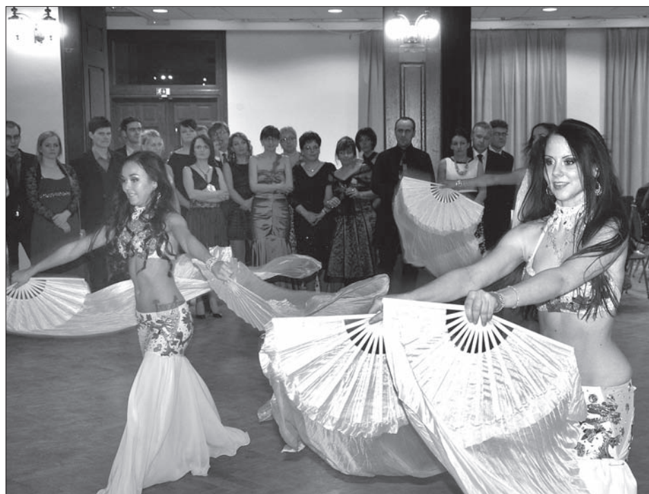
Grupa taneczna „Shaheen” z Brna zaprezentowała wiązkę egzotycznych tańców.