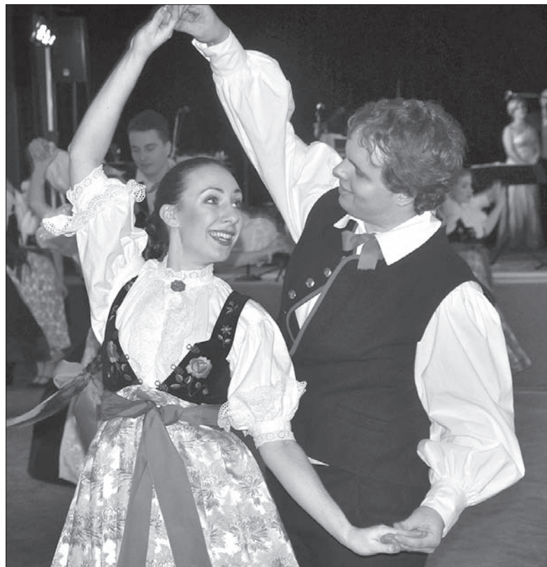
Karnawałową zabawę zainaugurował Zespół Regionalny „Błędowice”.