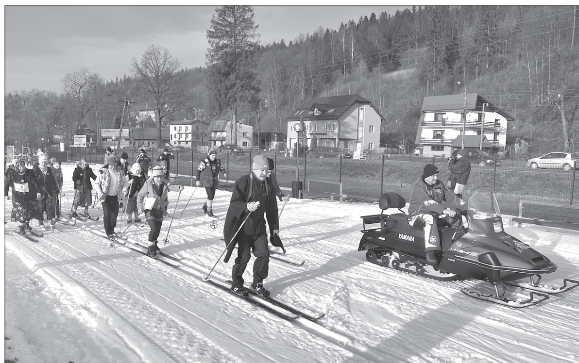
Na prawdziwych narciarskich trasach biegano dopiero na terenie ośrodka sportowego Jonidło.