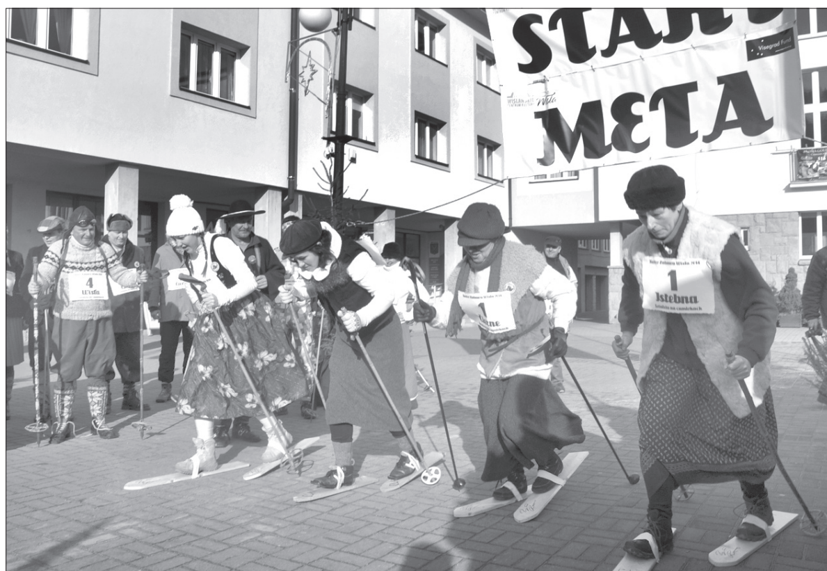
Uczestnikom retro zabawy nie przeszkodził nawet brak śniegu.

Po emocjach na wiślańskim rynku uczestnicy Biegu Retro założyli narty na... plecy i ruszyli w kierunku