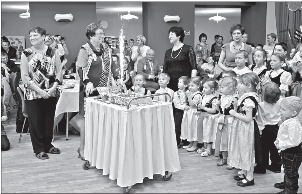
Członkinie Klubu Kobiet MK PZKO upiekły dla przedszkola urodzinowy tort.