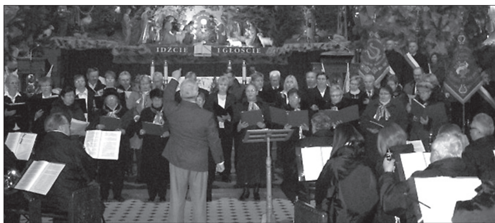
Chór „Sucha” na przestrzeni ostatnich dwóch tygodni miał możliwość pięciokrotnie zaprezentować odnowiony repertuar kołędowy.