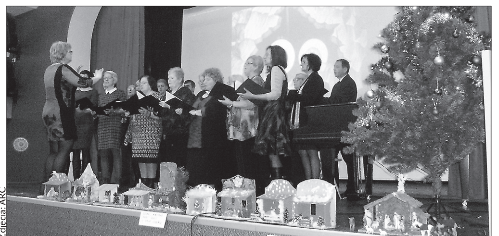
Występ chóru „Stonawa” podczas wigilijki stonawskiego Koła PZKO.