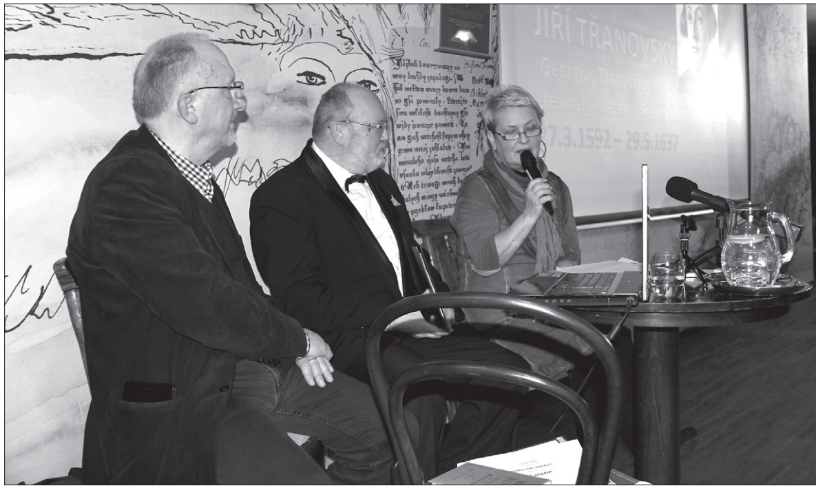
Spotkanie poświęcone życiu i twórczości pastora, pisarza i kompozytora, Jerzego Trzanowskiego, odbyło się w czesko-cieszyńskim Avionie.

– Zainteresowałem się twórczością Jerzego Trzanowskiego, ale od