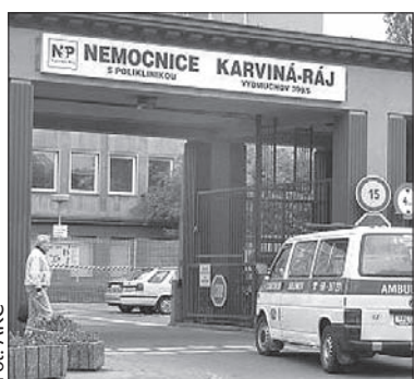
Szpital z Polikliniką w Karwinie-Raju.