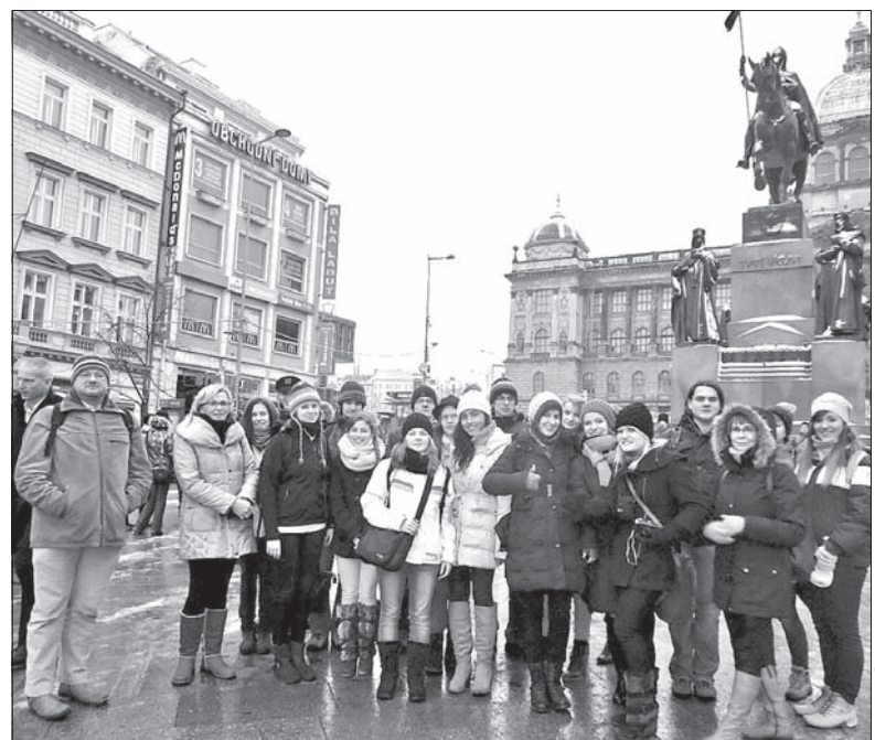
Młodzież uczestnicząca w projekcie podczas wizyty w Pradze.

– Realizacja projektu w partnerstwie zagranicznym z Kongresem Polaków w Republice Czeskiej umożliwiła dwujęzyczność wszystkich naszych działań. Zarówno Kongres Polaków, jak i my, wniosiliśmy do projektu nasz wkład merytoryczny, finansowy i organizacyjny. Dla młodzieży dodatkową gratyfikacją za udział w projekcie była możliwość rozwoju warsztatu dziennikarskiego, poszerzania horyzontów i prezentacji swoich tekstów w publikacji książkowej oraz współpraca w gronie ambitnych rówieśników, którzy chcą kreować swoją aktywność obywatelską po obu stronach Olzy. W ten sposób pojawiła się bezpłatna publikacja „Cieszyńska szkoła obywatelstwa: po obu stronach Olzy” – dodaje prezes KKK. – Dodatkowo, dzięki własnym funduszom, nasze Stowarzyszenie wspólnie z Kongresem Polaków w Republice Czeskiej umożliwiło młodzieży edukację obywatelską na różnych szczeblach samorządności. Młodzież miała okazję uczestniczyć na przykład w specjal-