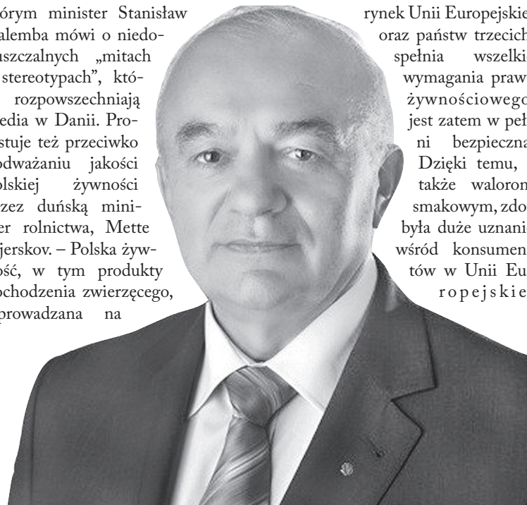
Minister Stanisław Kalemba.

którym minister Stanisław Kalemba mówi o niedopuszczalnych „mitach i stereotypach”, które rozpowszechniają media w Danii. Protestuje też przeciwko podważaniu jakości polskiej żywności przez duńską minister rolnictwa, Mette Gjerskov. – Polska żywność, w tym produkty pochodzenia zwierzęcego, wprowadzana na