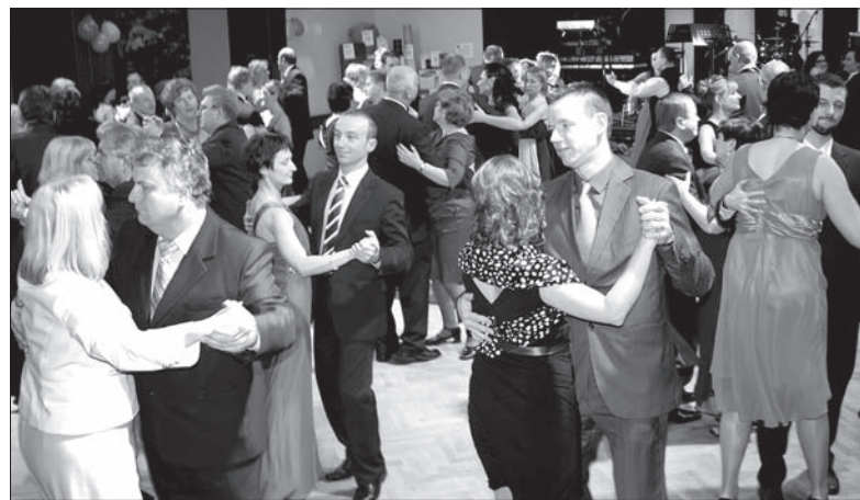
Bal w „Strzelnicy” odwiedziły tłumy gości.