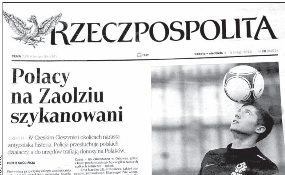
Pierwsza strona weekendowego wydania „Rzeczpospolitej”.

– Jak dla mnie, ta odpowiedź nic nie wnosi do tej sprawy, niestety nie posiada jej do pro-