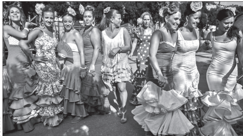
Polacy nadal kochają Hiszpanię, między innymi tamtejszy kolorowy, gorący folklor. Największym ośrodkiem Polaków w tym kraju jest Madryt.

Gdzie znajdowali pracę i mieszkanie? Największym ośrodkiem Polonii w Hiszpanii jest Madryt. Są tu stowarzyszenia polonijne, trzy kościoły z polską mszą, sklepy, szkoły polskie. Kontakty i wzajemne wsparcie ułatwiają przetrwanie kryzysu.