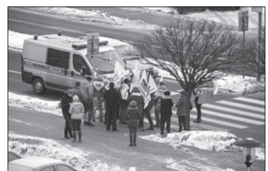
W ostatnich dniach polscy górnicy wyszli na ulice.

Wczoraj przed siedzibą JSW ponownie gromadzili się demonstranci. Policja przygotowana była na najgorsze. (dc)