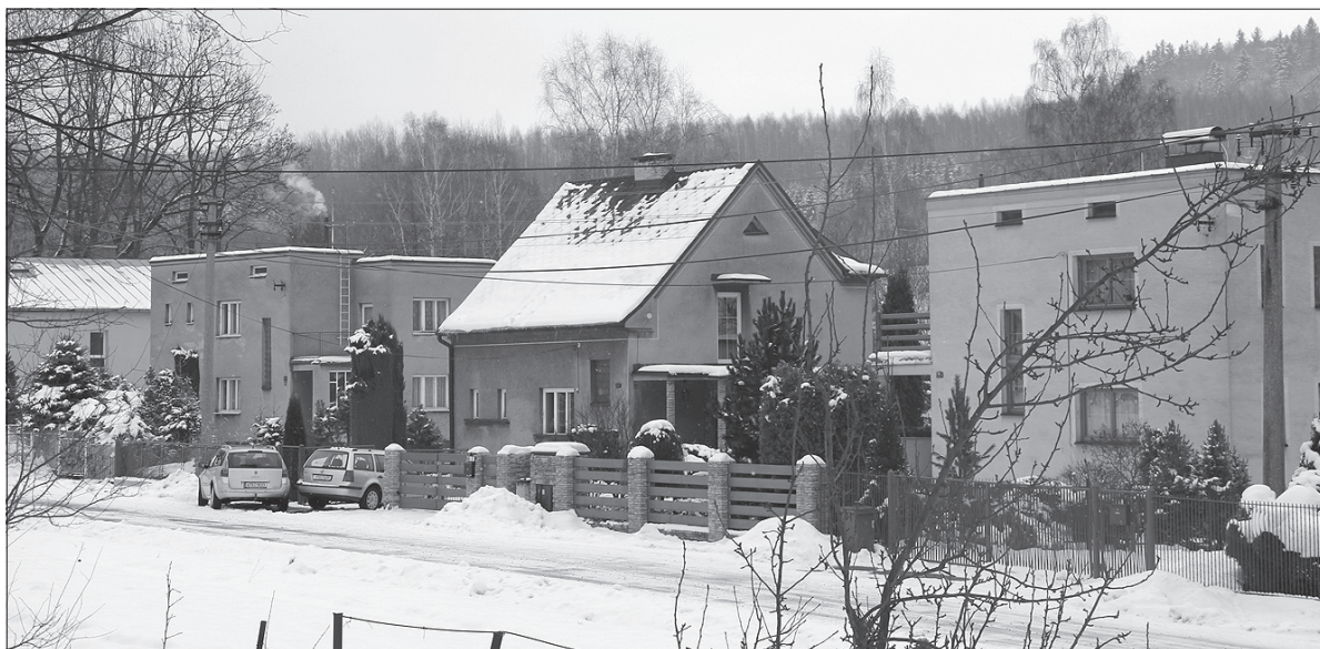
Właściciele domów jednorodzinnych w Trzyńcu mogą korzystać z miejskich kredytów na remonty i modernizację nieruchomości.

Na podobnych zasadach (również z odsetkiem rocznym 3 proc.) pożyczka