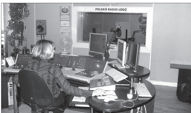
Jeden z regionalnych oddziałów Polskiego Radia znajduje się w Łodzi.

W 1927 r. pojawiała się pierwsza lokalna rozgłośnia Polskiego Radia. Była to antena krakowska, której charakterystycznym sygnałem został hejnał z Wieży Mariackiej. W tym samym roku powstały stacje nadawcze w Poznaniu i Katowicach.