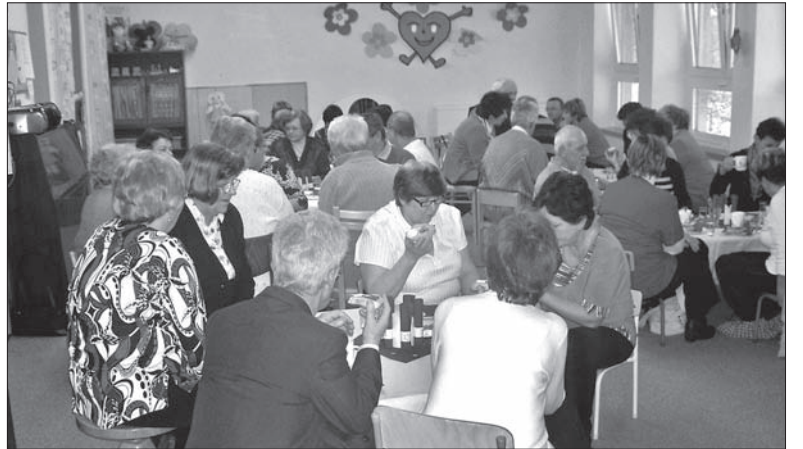
Babcie i dziadkowie w wędryńskim przedszkolu.

ne obchodzić Dnia Babci i Dziadka. W piątek 28 stycznia goście ledwo mieścili się na widowni. Imprezę rozpoczęto oczywiście „Hymnem przedszkola”, napisanym z okazji 80. rocznicy przedszkola w Wędryni. W programie była bajka o tym, jak Jaś i Małgosia, pokonując zimowe przeszkody, szli odwiedzić swą kochaną babcie. Potem dzieci wierszem i piosenką składały świąteczne życzenia swym babciom i dziadkom. Chciałyby się mieć choć jeden z darów, jakie chciały im dzieci ofiarować – chociażby złotą rybkę spełniającą zy-