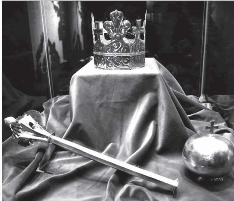
Do cennych eksponatów należą również insygnia pogrzebowe króla czeskiego Przemysła Otokara II.

Oprócz klejnotów przywiezionych z Polski, na wystawie znajdziemy też eksponaty ze skarbcza w niemieckim Akwizgranie – m.in. XIV-wieczną koronę królewską.