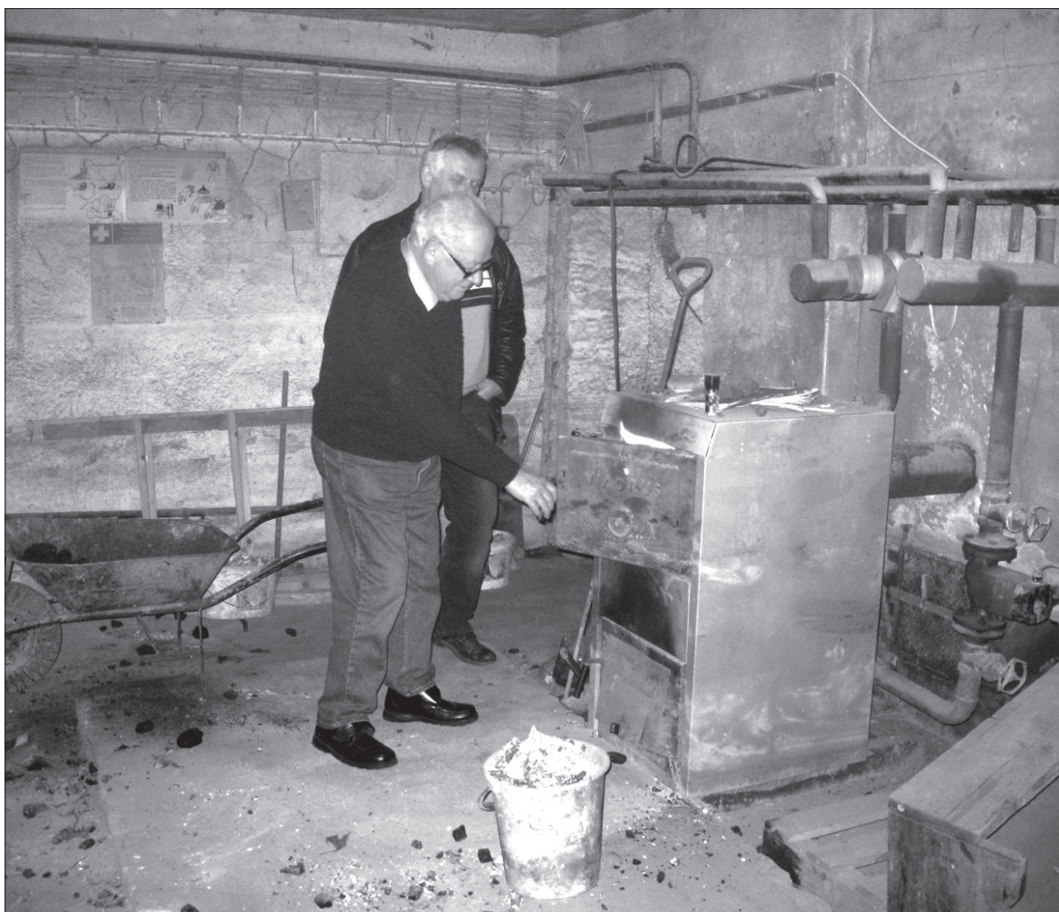
Zakupiony niedawno kocioł na szczęście udało się uratować.