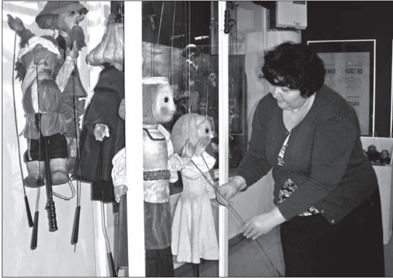
Pani kustosz ciekawie opowiada o lalkach.