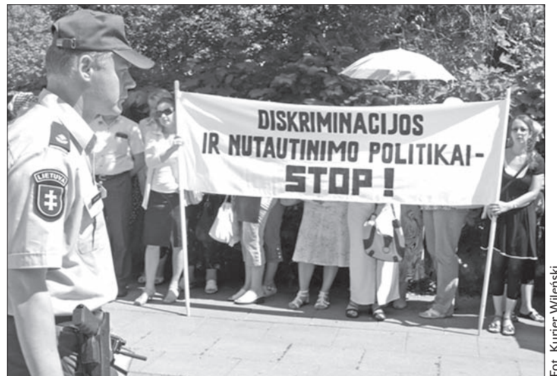
Wiec w obronie polskiego szkolnictwa na Litwie.

– Jeżeli nie zostanie przygotowany egzamin z języka państwowego dla szkół mniejszości narodowych, uwzględniający program dotychczasowego nauczania, nadużycia w stosunku do polskiej młodzieży zostaną zaskarżone w instytucjach europejskich. Nie chcielibyśmy tego czynić w przeddzień przewodnictwa Litwy w Unii Europejskiej. Jednakże dobro naszych dzieci jest darem nadrzędnym i będziemy bronić praw swoich dzieci do skutku – grożą autorzy oświadczenia. Wszystko wskazuje na to, że rozwiązanie problemu pozostanie w rękach polskich i litewskich polityków,