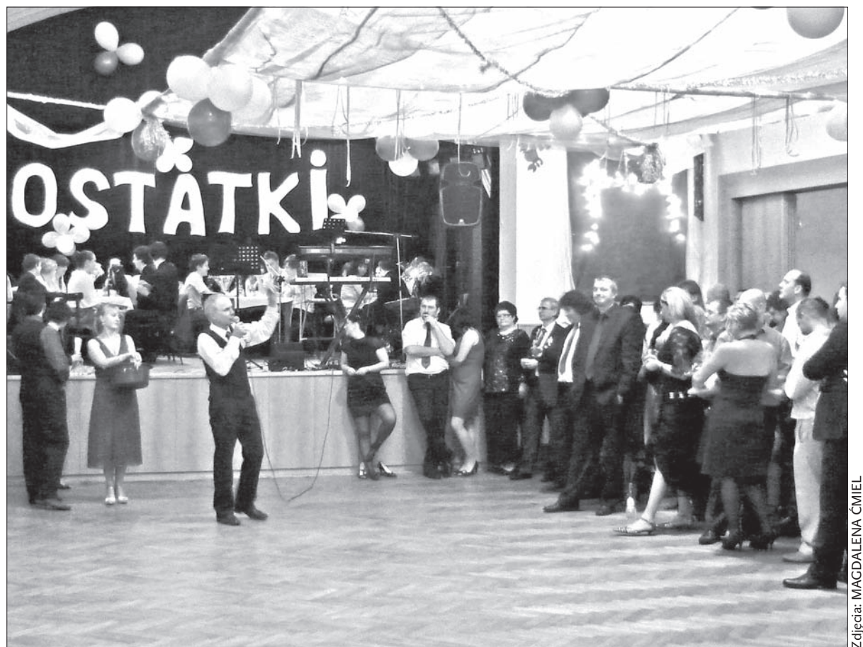
Wędryńskie „Ostatki” nie mogły się obejść bez loterii.

czy, np. „Bal Papuciowy” czy „Śląskie Ostatki”. W tegorocznej edycji imprezy balowiczom do tańca przy-