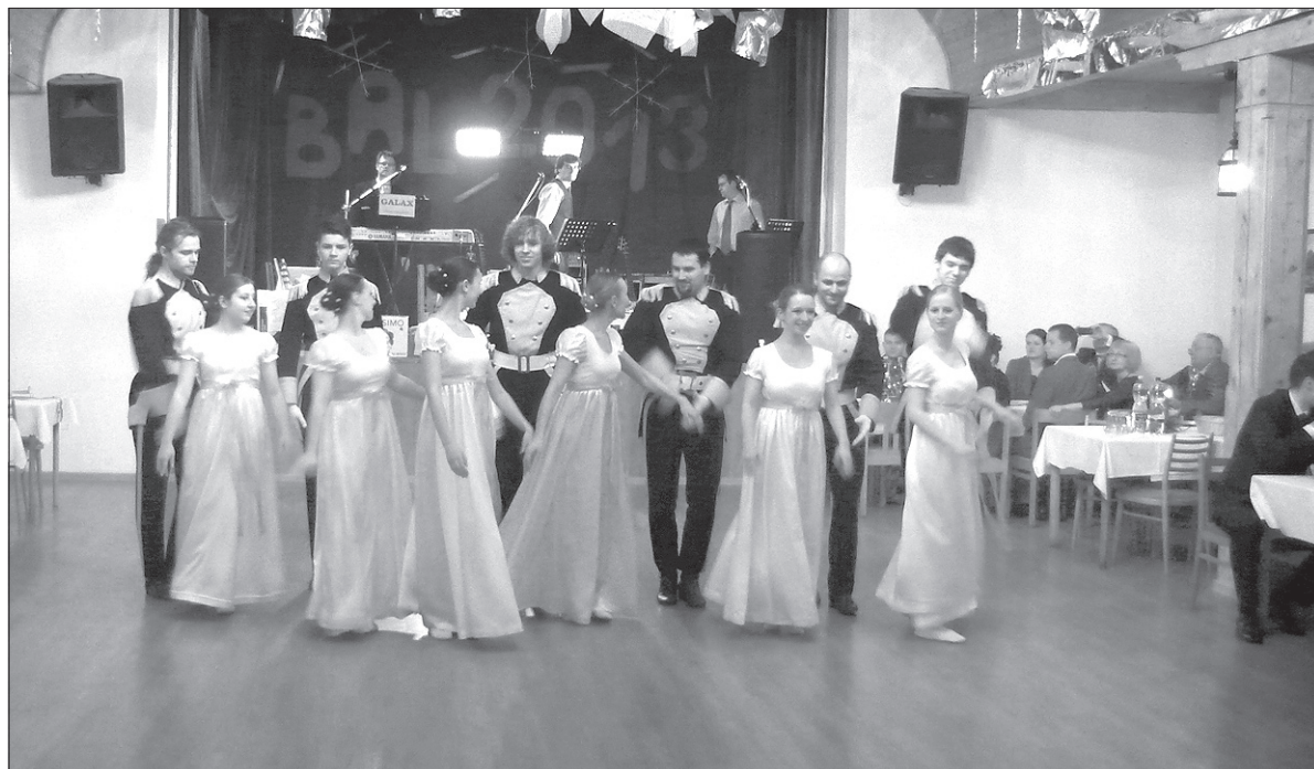
W programie „Ostatekowego Balu Papuciowego” wystąpił zespół folklorystyczny „Bystrzyca”.

Zakończenie karnawału połączone z ostatekami kończy się według starej, ludowej tradycji pochowaniem basa. Tradycja ta podtrzymywana jest m.in. w Stonawie czy Olbrachcicach. MAGDALENA ĆMIEL