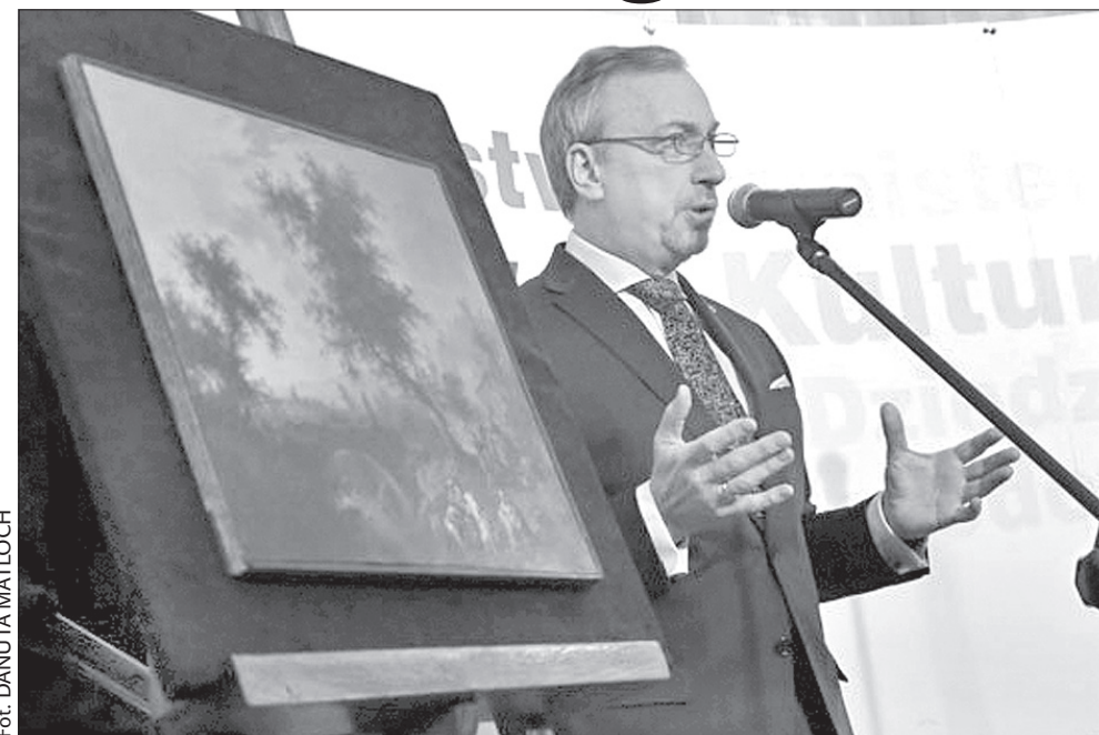
Minister Kultury i Dziedzictwa Narodowego Bogdan Zdrojewski.

Minister Zdrojewski dziękował obecnym na uroczystości ekspertom agencji dochodzeniowej Homeland Security Investigations. – Zawdzięczamy wam sprawną i niezwykle profesjonalną działalność w zakresie odzyskiwania dzieł sztuki. Bardzo ważne dla nas jest, że współpraca z administracją amerykańską przebiega tak, jakbyśmy sobie tego życzyli – powiedział szef resortu kultury. Poinformował przy tym, że odzyskany obraz jest wart ok. ćwierć miliona złotych!