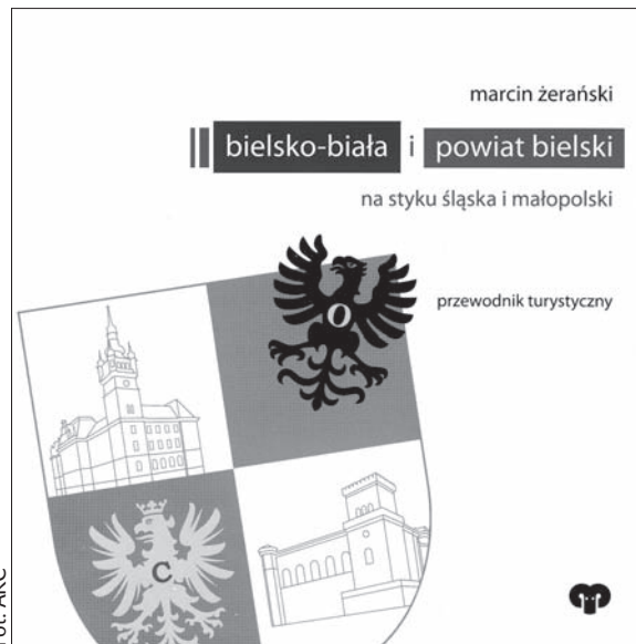
Okladka nowego przewodnika.

Przyznaje natomiast, że całkowitą nowością była dla autorów przewodnika małopolska część powiatu bielskiego. – Poznawanie nowych miejsc to była wielka frajda,