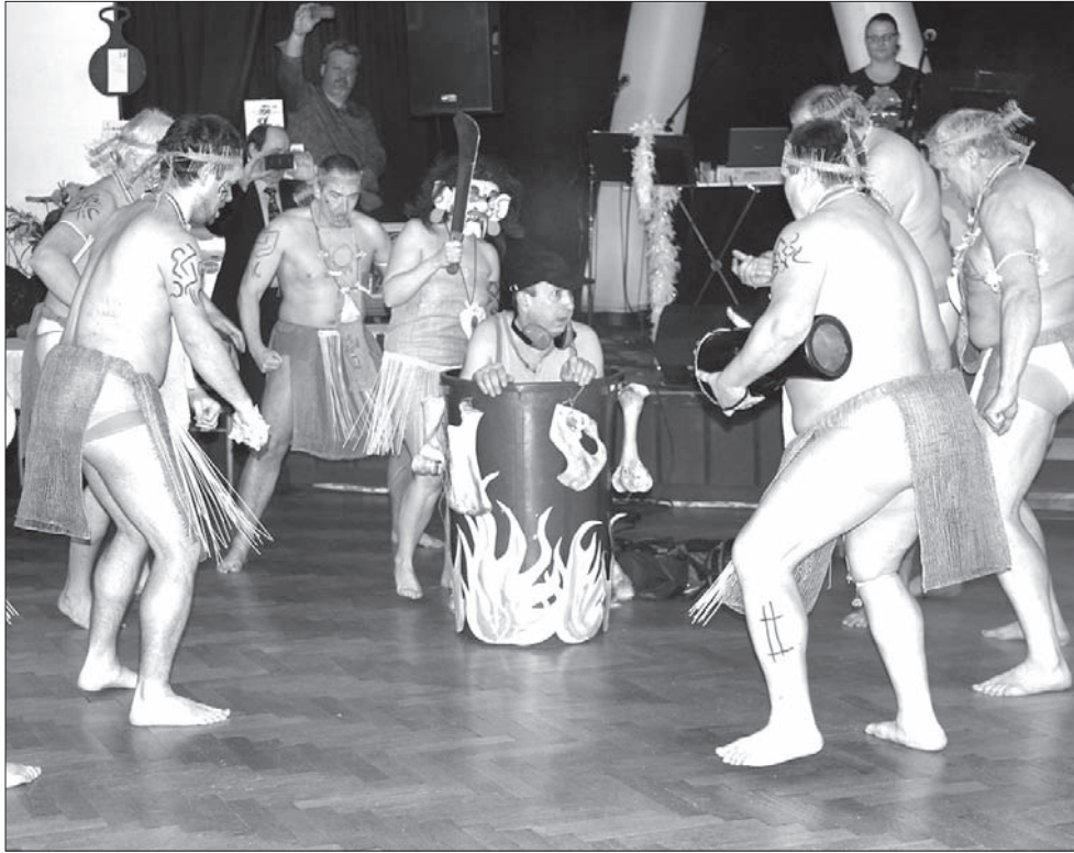
Ludożercy w Błędowicach.