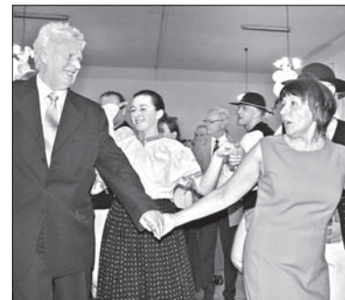
Bawiono się „Na Brandysie” w Czeskim Cieszynie

W sobotni wieczór na swoim pierwszym balu bawili się członkowie Polskiego Towarzystwa Turystyczno Sportowego „Beskid Śląski” w RC. Do tej pory „Beskidziocy” spotykali się zawsze w turystycznych strojach, nierzadko ubłoconych na szlaku. Spotkanie w eleganckiej balowej atmosferze było więc dla nich czymś zupełnie nowym. Ponadto sporo członków „Beskidu”, którzy na wycieczki chodzą sami, na bal przyszło ze swoimi drugimi połówkami. Impreza stała się więc okazją do poznania rodzin kolegów i kole-