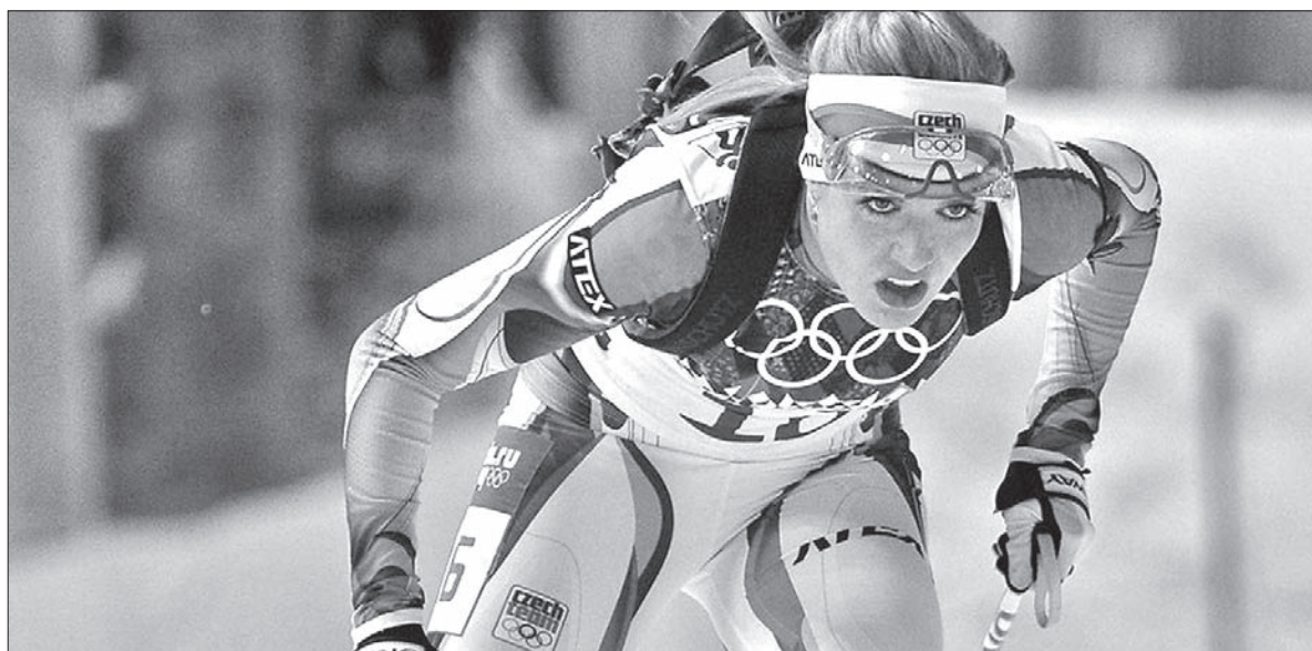
Gabriela Soukalová sięgnęła wczoraj po srebrny medal w biathlonie – w biegu ze startu wspólnego na 12,5 km.