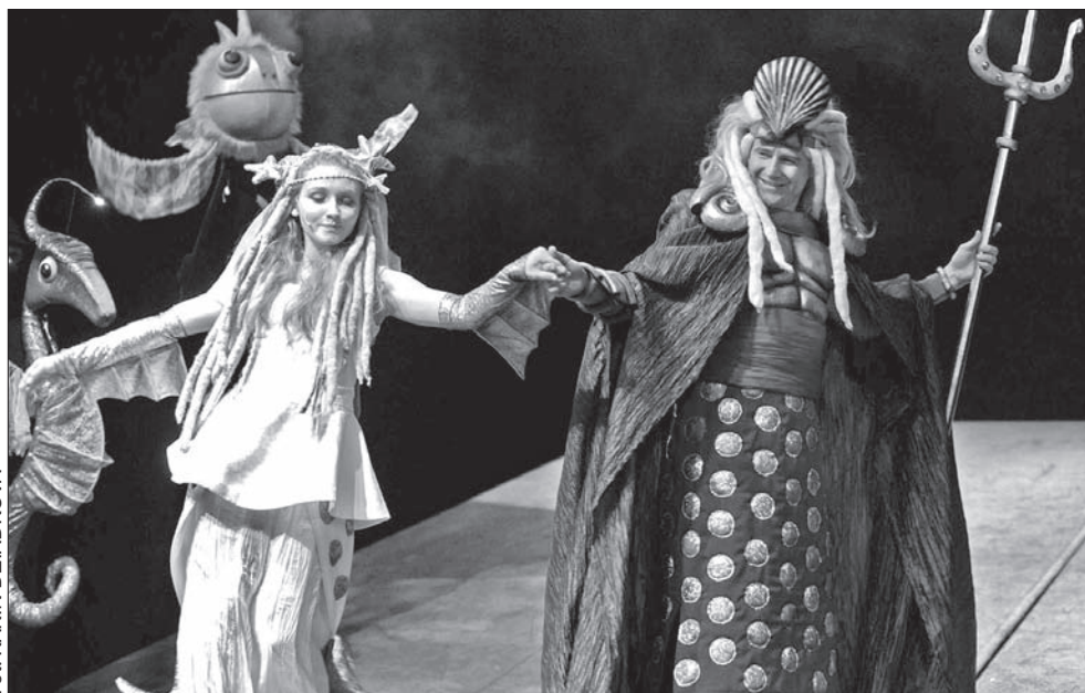
Król Tryton z Małą Syrenką.

sze dziewczynki przeżywały mocno perypetie syrenki, z kolei ja podziwiałam przede wszystkim wspomnianą wyżej scenografię oraz ogólny