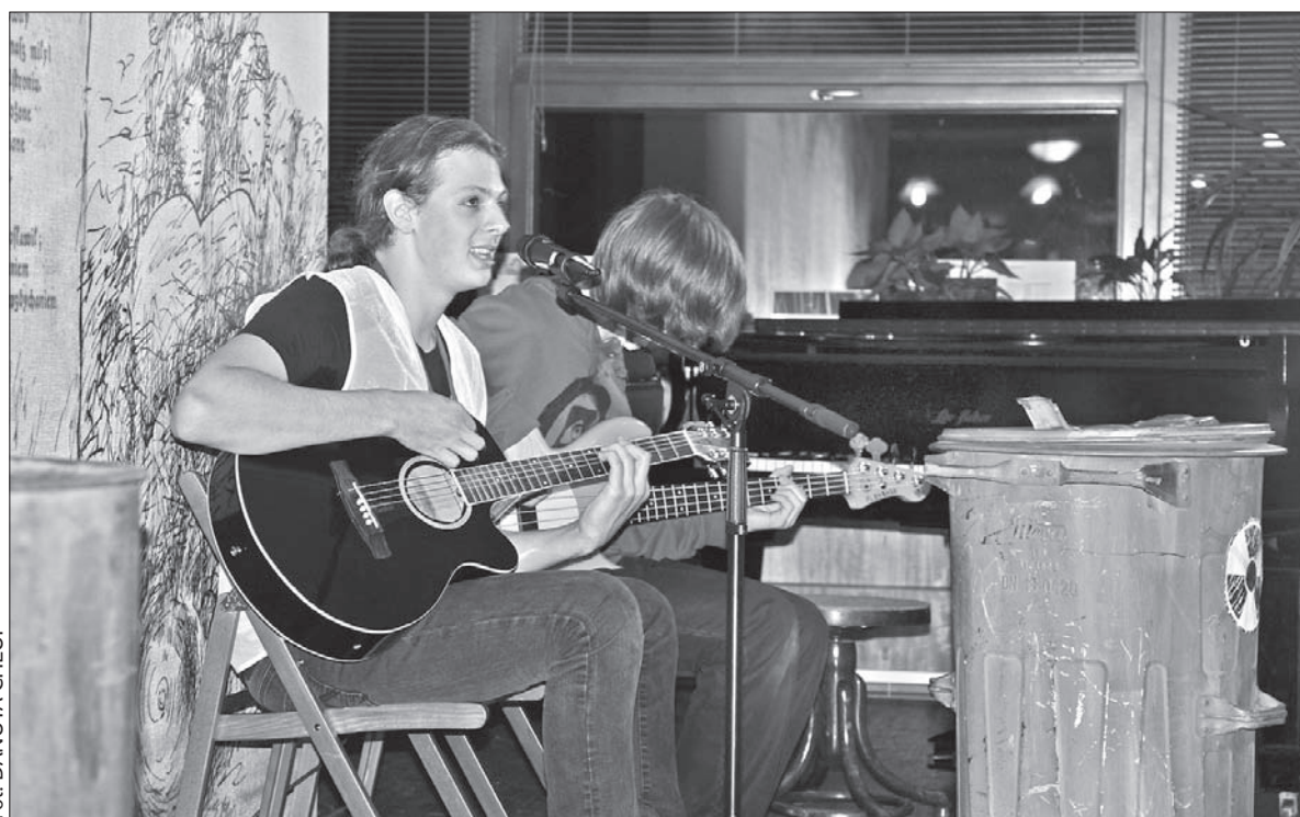
Muzyka między śmietnikami.