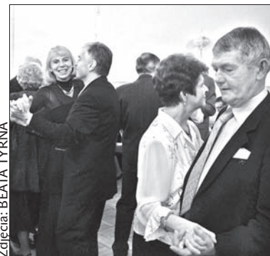
Bal odbył się po raz pierwszy.

żanek z górskich szlaków i integracji. Do tańca przygrywały kapele „Gorole” z Mostów koło Jabłonkowa, których członkowie wciągnęli też balowiczów w góralskie tańce i zabawy oraz zespół kabaretowy MK PZKO w Suchej Górzej. (indi)