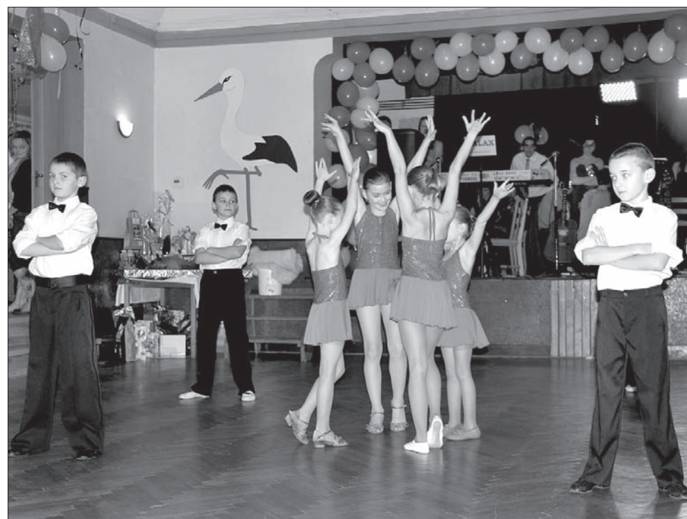
Na balu w Boconowicach pokazali swe umiejętności mali tancerze „Rytmika”.

Bal nie tylko nazywał się „Pod bocionym”. Ptak będący symbolem wioski był też głównym motywem przewijającym się w wystroju wnętrza (na biało-czerwony, a więc zarówno boci-