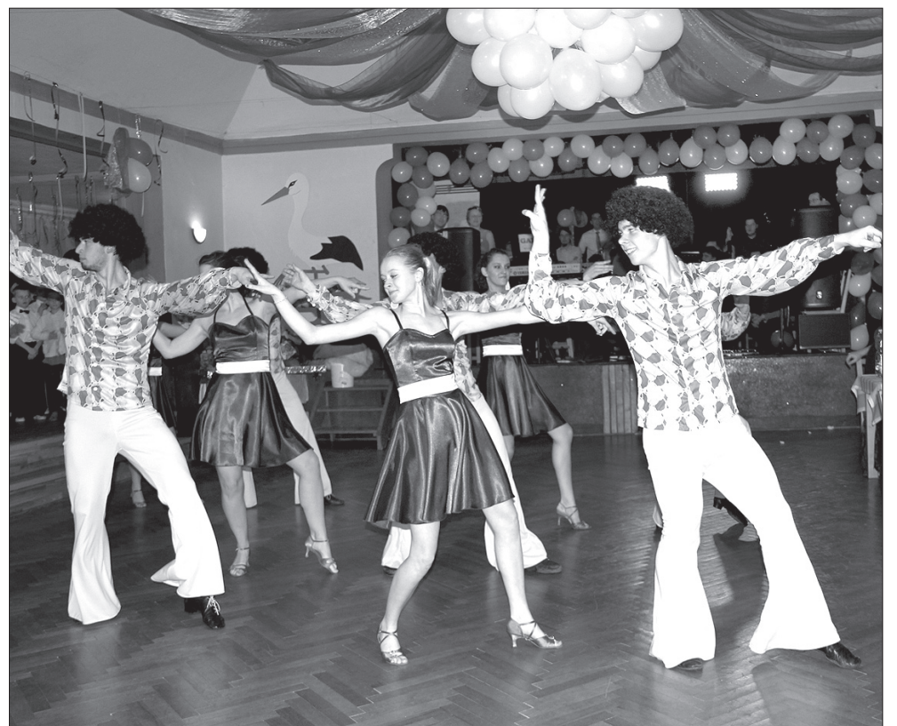
Starsi tancerze „Rytmika” przypomnieli przeboje z lat 80.

nicy spuszczać na tańczące pary. Mężczyzna, który zdobędzie najwięcej talonów za całowanie się z partnerką pod dzwonem oraz otrzyma-