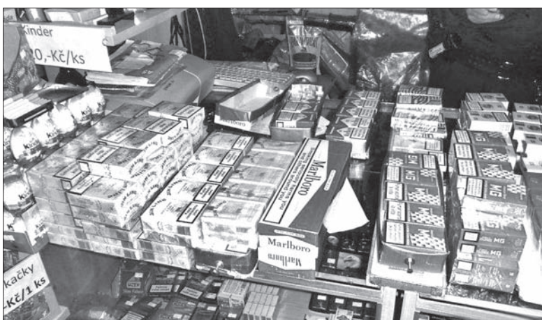
W ub. roku morawo-sląscy celnicy zarekwirowali m.in. 520 tys. sztuk papierosów bez akcyzy.

Interesująco przedstawiają się wyniki kontroli przeprowadzonych przez służby celne w naszym regionie. Na ich podstawie celnicy zarekwirowali ponad 242 tys. litrów