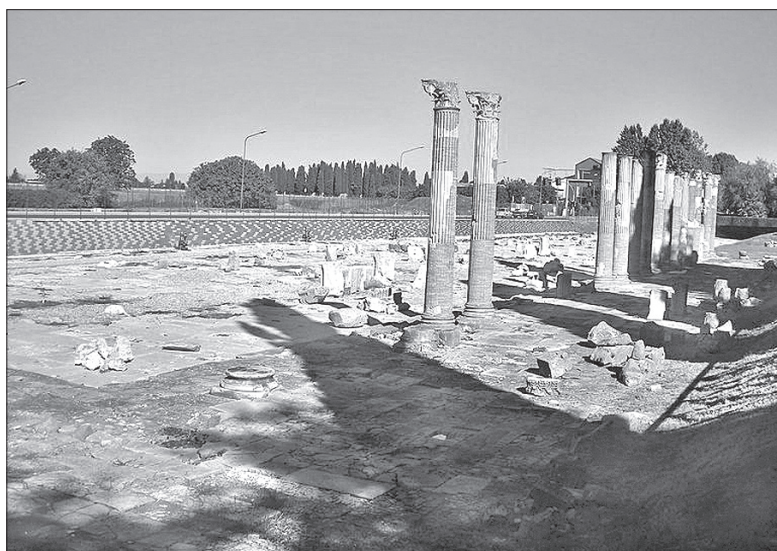
Ruiny Forum Romanum w Akwilei.

była zarazem skrzyżowaniem Szlaku Bursztynowego z legendarnym Szlakiem Jedwabnym. Liczne odkrycia archeologiczne potwierdzają,