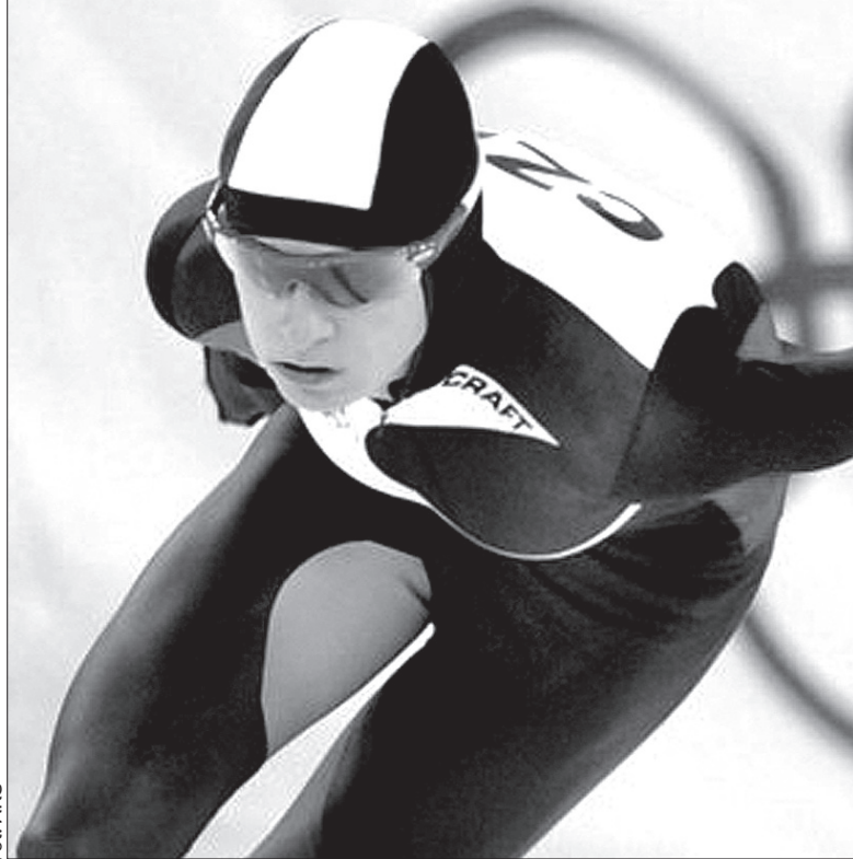
Martina Sáblíková zdobyła wczoraj drugie złoto dla RC.