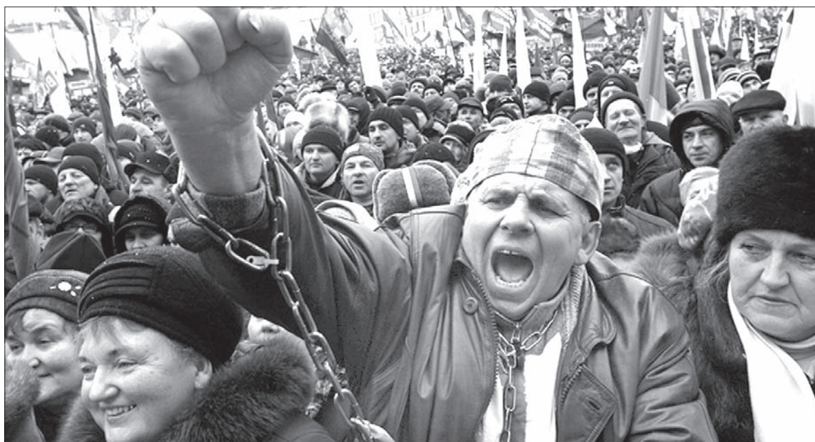
Konflikt wewnętrzny na Ukrainie się zaostża.