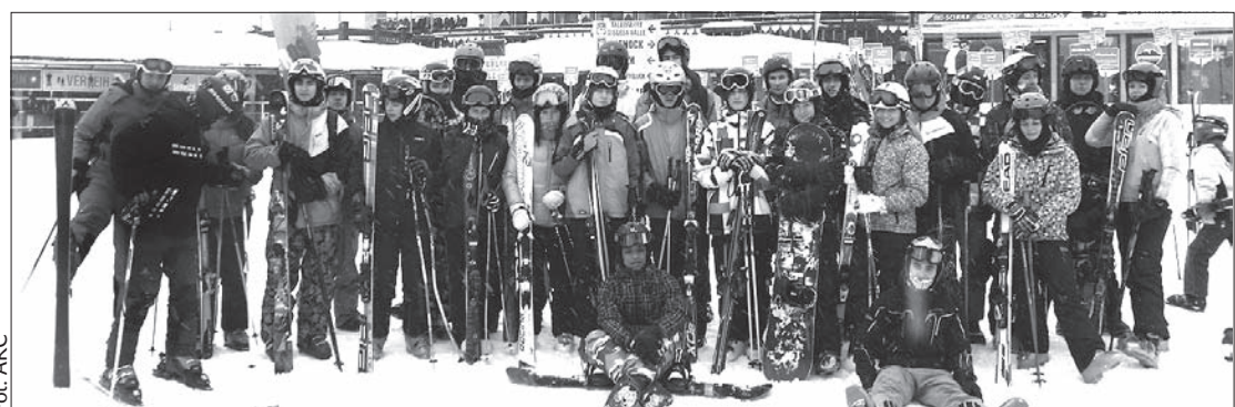
Grupowe zdjęcie uczestników obozu narciarskiego w Alpach.