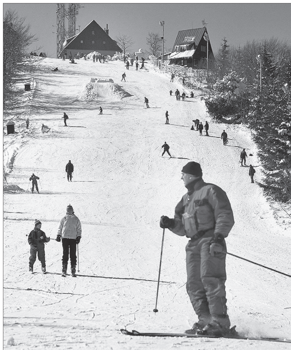
Nartostrada na Jaworowym.