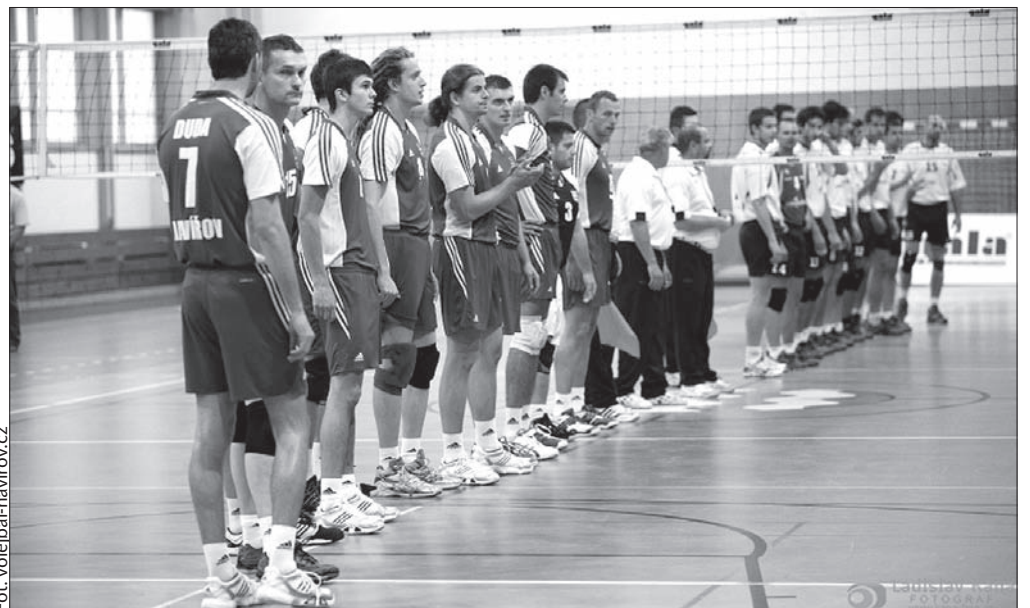
Siatkarze Slavii Hawierzów zajmują w tabeli dziewiątą lokatę.

Najbliższy mecz przed własną publicznością zaliczą siatkarze Hawierzowa 1 marca. Rywalem będzie zespół Czeskich Budziejowic. (jb)