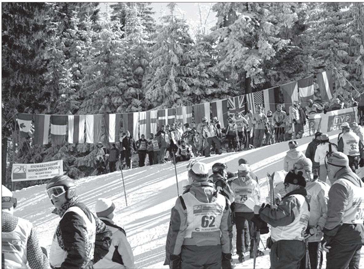
Sportowa rywalizacja jest ważna, ale jeszcze ważniejsze jest spotkanie Polaków z całego świata.

jedzie 600 Polaków z całego świata. Najliczniejsze reprezentacje przyjadą do Szczyrku, który jest bazą Igrzysk, z Litwy (82 osoby), Rosji (75), Ukrainy (70) i Kanady (69). Także Zaolzie wystawi mocną reprezentację.