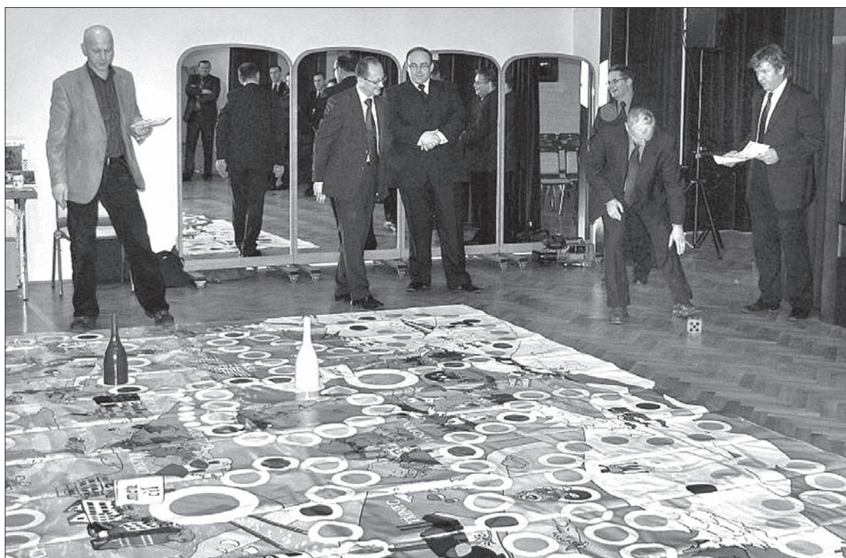
Euroregion „Śląsk Cieszyński-Těšínské Slezsko” mobilizuje do działania władzy gmin z obu brzegów Olzy.

łatwienie formalności w różnych instytucjach i urzędach zajęło nam rok – od sierpnia 2010 roku do lipca 2011. Właściwe prace budowlane trwały już potem tylko trzy miesiące, a uroczyste otwarcie nastąpiło 1 października – przypominia prezes. Koło uzyskało na ten cel 17 100 euro. – Na tę sumę musieliśmy zaciągnąć kredyt bankowy. Obecnie trwa kontrola wszystkich dokumentów w siedzibie euroregionu, po czym zostaną one przekazane do Ołomuńca. Po pomyślnej akceptacji dotacja zostanie przekazana na nasze konto i wtedy będziemy mogli spłacić zaciągnięty kredyt – wyjaśnia I. Kołek. Z tym, że 3127 euro (15 proc. ogólnej sumy) sibickie MK PZKO musiało wyłożyć z własnych środków. – Na pewno było war-