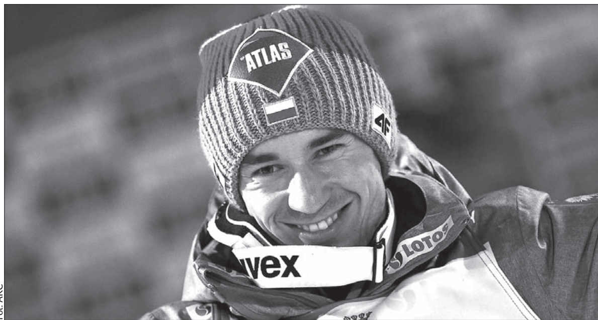
Do medalowych pewniaków w polskiej ekipie należy skoczek Kamil Stoch.

– Wyjazd do Lahti traktujemy tak, jak na każde inne zawody. Nie myślimy o mistrzostwach świata, jak o czymś wyjątkowym. Wszyscy znamy swoją wartość i wiemy na co nas stać – podkreślił Stoch. Pierwsza rywalizacja o medale na skoczni rozpoczyna się w sobotę. Na pierwszy ogień zawodnicy wystartują na średnim obiekcie. W czwartek 2 marca Kamil Stoch i spółka powalczą z kolei na dużym obiekcie, w sobotę 4 marca w drużynówce.