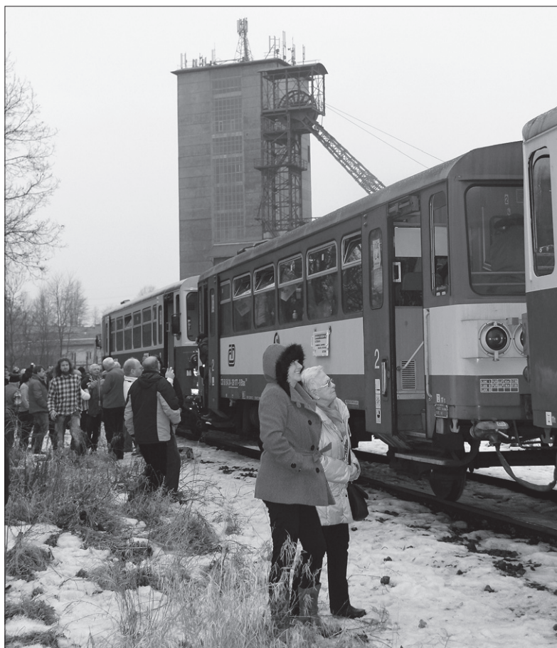
Przystanek przed szybem „Zofia”.