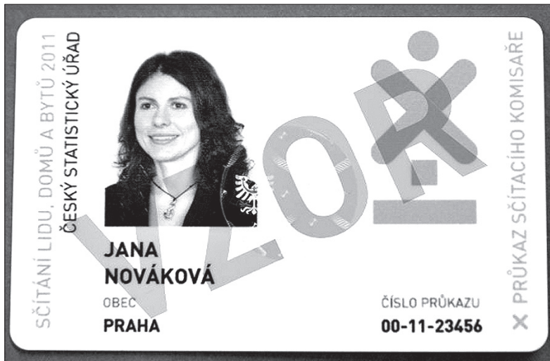
Wzór legitymacji rachmistrza.

Rachmistrzowie – w większości pracownicy Poczty Czeskiej – będą roznosili druki w terminie od 7 do 25 marca. Dla całej rodziny może je podjąć osoba, która skończyła 15 lat. Rachmistrz będzie miał specjalną legitymację, na żądanie musi pokazać dowód osobisty. Jeżeli rachmistrz nie zostanie nikogo w domu, wrzuci do skrzynki informację o terminie kolejnej wizyty. Jeżeli ten termin również nie będzie nam odpowiadał,