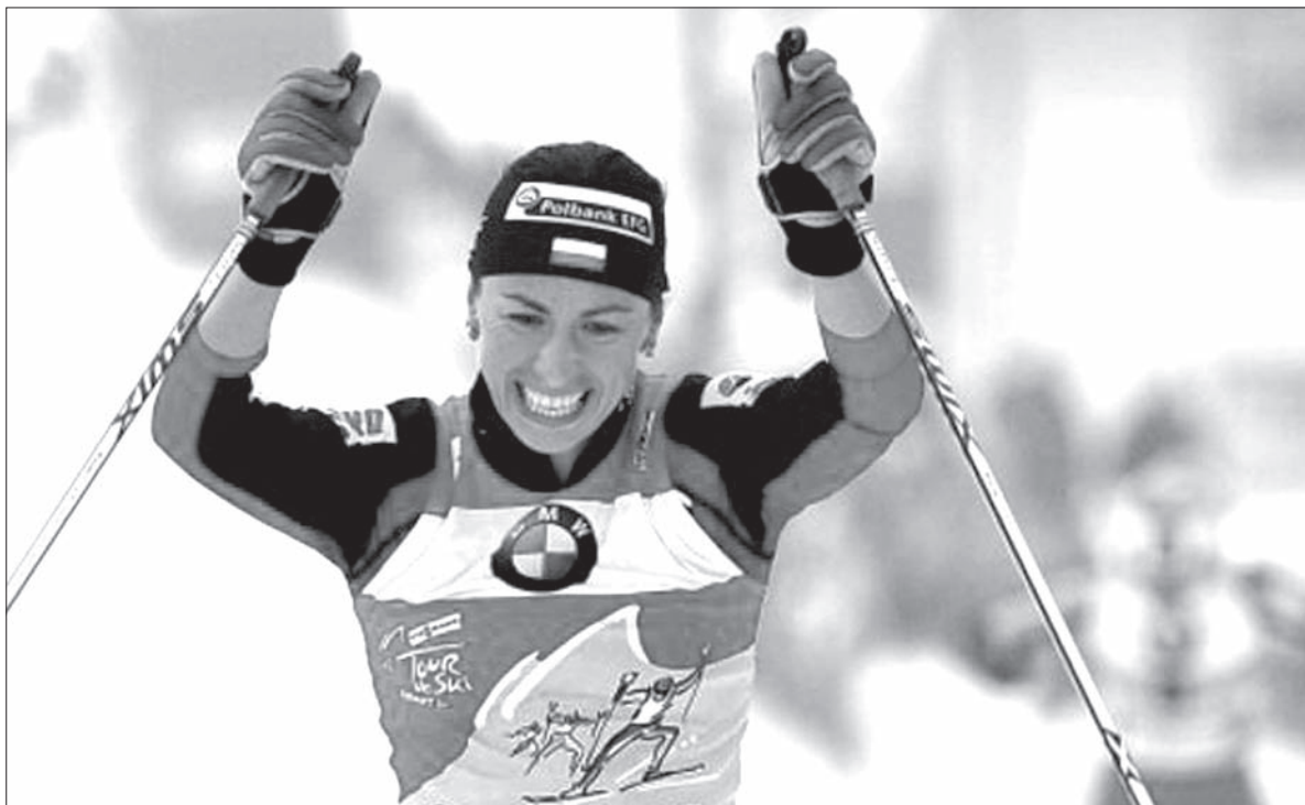
Justyna Kowalczyk zdobyła wczoraj drugi srebrny medal.

Karty w poniedziałkowym biegu rozdało zmęczenie. Justyna Kowalczyk rozpoczęła wyścig w znakomitym stylu, końcówka należała jednak do Marit Bjoergen. Na drugim kilometrze Polka wyprzedzała norweską królową nart o 9,6 s., na siódmym kilometrze przewaga Kowalczyk wynosiła około ośmiu sekund. Im bliżej do mety, tym mocniej biegła jednak Marit Bjoergen, która we wczorajszym wyścigu przypominała maszynę parową nie do zdarcia. Norweżka z każdym kilometrem nadrabiała stratę do Justyny Kowalczyk, na kilometr przed metą strata do Polki wynosiła zaledwie 2 s.