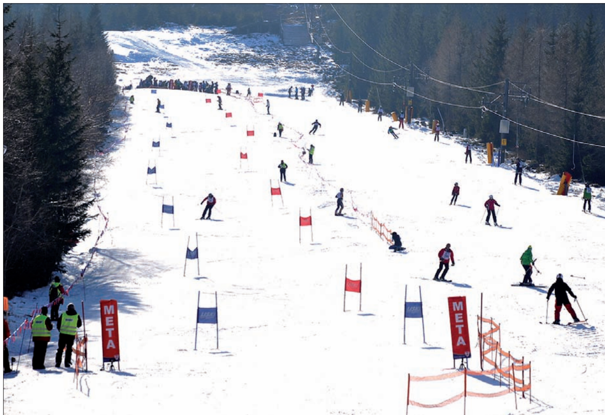
Konkurencje alpejskie rozegrano na stoku ośrodka narciarskiego Kopa w Karpaczu.

Mimo wielu sukcesów ekipie z Zaolzia nie udało się jednak zwyciężyć w klasyfikacji medalowej igrzysk. – Bardzo liczna i bardzo mocna jest bowiem reprezentacja Litwa. – Reprezentantów tego kraju przyjechało ponad 130, podczas gdy nas jest tylko ponad 60. W dodatku zawodnicy z Litwy zdecydowanie dominują