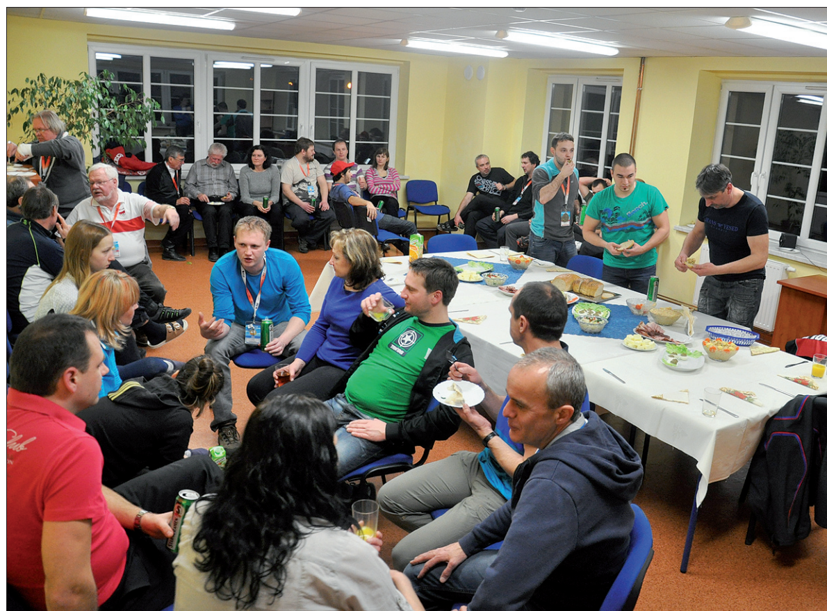
W środę wieczorem w kwaterze naszej ekipy odbył się wieczór zaolziański.

– Podczas dekoracji najlepszych zawodników panuje naprawdę miła atmosfera, ponieważ poszczególne ekipy żywiołowo fetują swoich zwycięzców. Przyznam jednak, że brakuje mi spotkań z olimpijczyka-