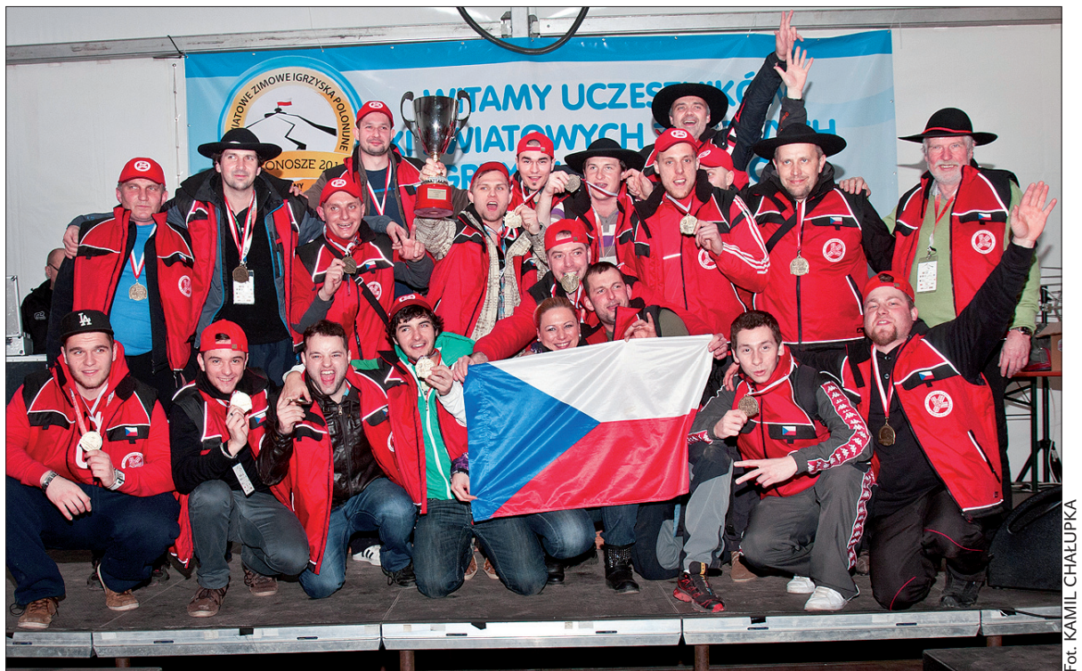
Drużyna hokeistów z medalami i zdobytym pucharem.

Niestety wiosenna aura panująca w Karkonoszach sprawiła, że organizatorzy igrzysk mieli ogromne problemy z odpowiednim przygotowaniem sportowych aren. – Niestety tej zimy w naszych górach nie spadło