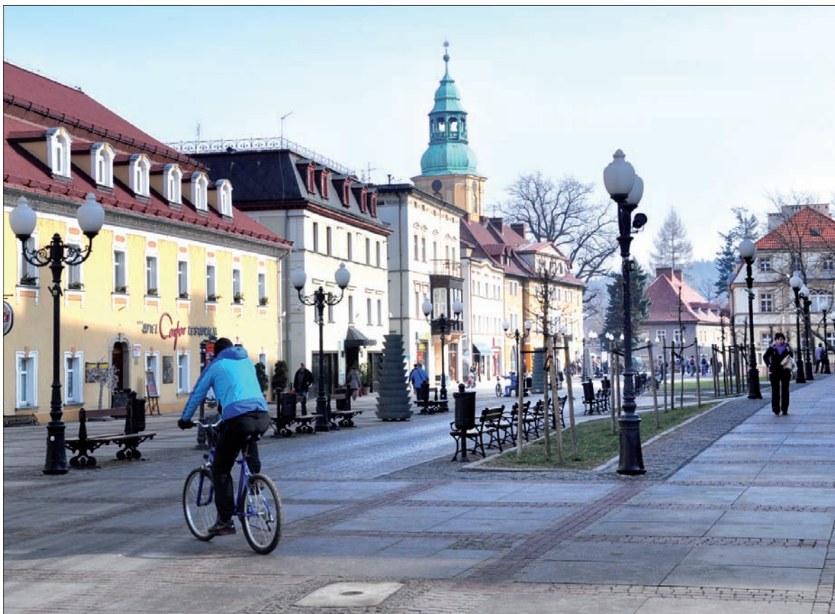
Uzdrowisko Cieplice przez tydzień pełniło rolę olimpijskiego centrum.

Szef zaolziańskiej ekipy nie krył też, że cieszy się, iż zimowe igrzyska polonijne po raz pierwszy zorganizowano w Jeleniej Górze. – Karkonosze są śliczne i dobrze, że mogliśmy poznać ten zakątek Polski. A start w slalomie gigancie na stokach Śnieżki to dla mnie osobiście wielka satysfakcja, choć oczywiście nie miałem ambicji medalowych, bo akurat moja kategoria wiekowa jest obsadzona