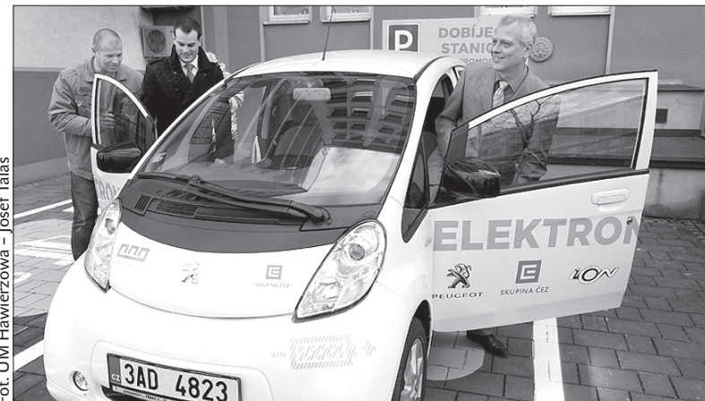
Urzędnicze auto na prąd.

elektrycznych. Przedstawiciele ČEZ oczekują, że przykład Hawierzowa pomoże w promocji aut na prąd jako ekologicznej formy transportu. Z kolei władze miasta cieszą się z oszczędności, jakie przyniesie jazda na prąd elektryczny. Hawierzów jest w tej chwili jedynym miastem w powiecie karwińskim z publiczną stacją ładowania pojazdów elektrycznych, oraz drugim – po Ostrawie – w województwie morawsko-śląskim. (sch)