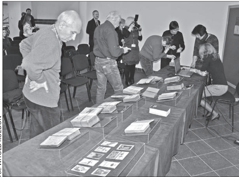
W Książnicy można było nie tylko posłuchać, ale i zobaczyć śląskie „kancynoły”.

Skuteczną próbę stworzenia pierwszego polskiego śpiewnika zainicjował urodzony w 1820 r. w Czechowicach, późniejszy proboszcz ze-