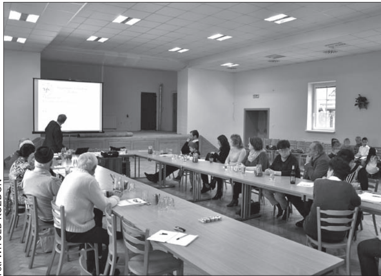
W sali Urzędu Gminy w Trzanowicach spotkało się w sobotę ponad 20 osób.

Wiceprezes KP przedstawił zebranych również „Wizję 2035”, czyli strategię wzmacniania polskości na Zaolziu w kolejnych latach. – Państwo mogą się z tym dokumentem zgadzać lub nie, ważne jednak byśmy na ten temat dyskutowali. To nie jest praca naukowa, to nie jest instrukcja, raczej apel, by zastanowić się nad naszą tożsamością. By pomyśleć, co możemy zrobić, aby nasza mniejszość narodowa przetrwała jak najdłużej. Od końca czasów komunistycznych, kiedy to musieliśmy zacząć adaptować się do wymagań systemu wolnorynkowego, minęło już 25 lat. Nadszedł więc czas, by zacząć myśleć do przodu. Liczba Polaków systematycznie spada, musimy się więc zastanowić, co i jak powinniśmy robić, by