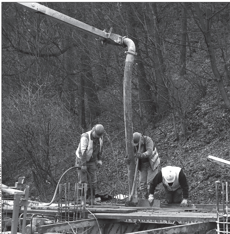
W Archeoparku ruszyła budowa nowego obiektu wejściowego.

Kierownictwo muzeum planuje stworzenie replik najciekawszych spośród znalezionych przez archeologów starych przedmiotów. Ekspozycje te można będzie oglądać na ekspozycji w nowym budynku. (ep)