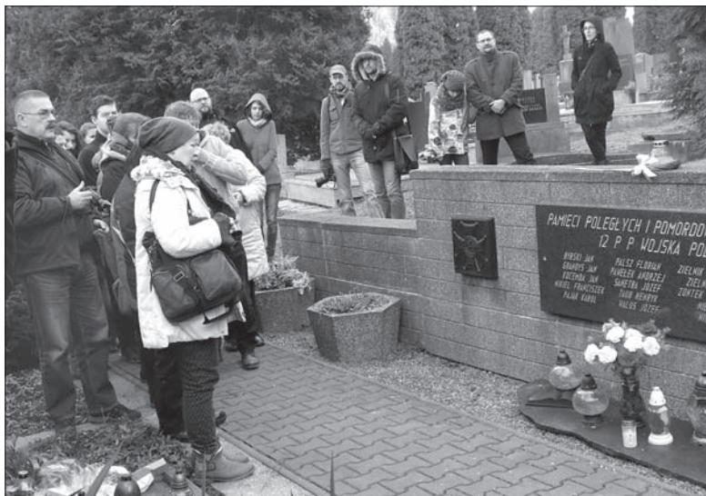
Jednym z przystanków niedzielnej wycieczki po Zaolziu był cmentarz w Stonawie, gdzie zapalono znicze pod pomnikiem polskich ofiar polsko-czechosłowackiego konfliktu z 1919 roku.

Pierwszym przystankiem na trasie był Jabłonków. Już jednak w drodze do podgórskiego miasteczka uczestnicy wyprawy mogli wysłuchać opowieści o każdej z mijanych miejscowości. O tym, że w niektórych z nich wójtami lub wicewójtami są Polacy, o rockowym Bystrzyckim Złocie, o wędryńskich Gimnastach. O Gorolskim Świącie, na które zjeżdżają ludzie nawet spoza regionu. A także o polskich legionistach, którzy właśnie w podgórskiej części dzisiejszego Zaolzia przebywali na przełomie lat 1914-1915, by „lizać rany” po