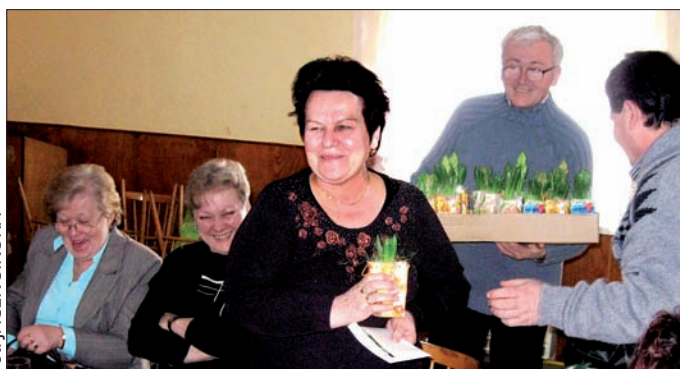
Na spotkaniu z okazji MDK każda z członkiń boconowickiego Koła PZKO otrzymała kwiaty i czekoladę.