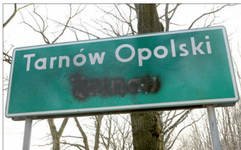
Skąd my to znamy?

wskazy do okolicznych miejscowości. Widzą więc przybysze, jak jechać na Tempelhoff (Niwki) czy Fallmirowitz (Falmirowice).