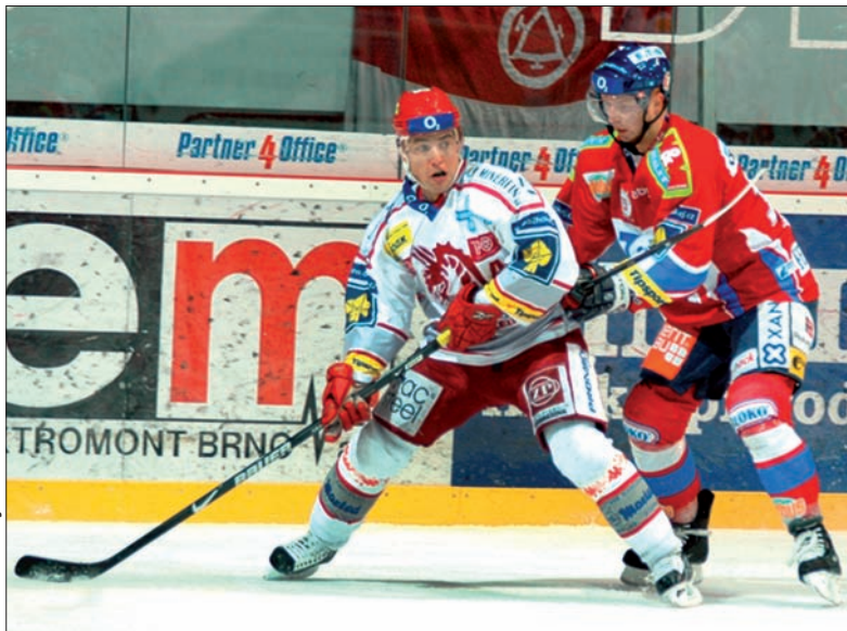
Ostatni mecz pomiędzy Trzyncem a Pardubicami zakończył się zwycięstwem Pardubic 6:1.

Młodej Bolesławi i Kladna. Najlepszą pozycję wyjściową mają ubiegłoroczni złoci medalisci O2 ekstraligi, drużyna Karlowych Warów.