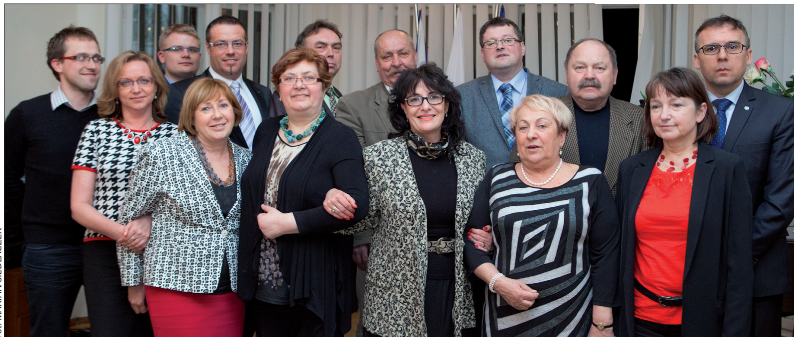
Pamiątkowe zdjęcie w Konsulacie Generalnym RP w Ostrawie.

dzień: 4 do 11 °C noc: -1 do -2 °C wiatr: 2-3 m/s