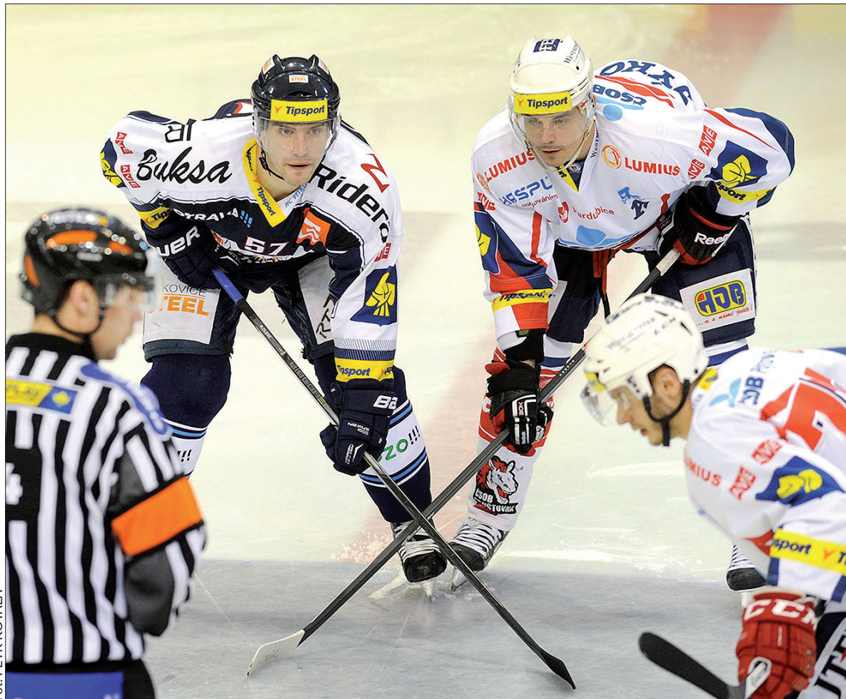
W serii Witkowice - Pardubice panuje po czwartku remis 1:1.