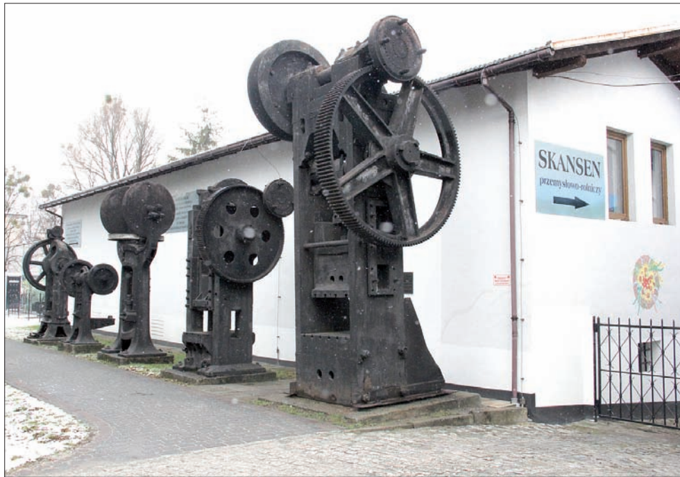
Na terenie miasta znajduje się wiele zabytków technicznych. Obok Muzeum Ustrońskiego zobaczymy na przykład maszyny kuźnicze.

To właśnie jest paradoks, że uzdrowisko istnieje tutaj w zasadzie od tego samego czasu, co przemysł. W połowie XVIII wieku zaczęli przyjeżdżać tu pierwsi kuracjusze. Przybywali tu ze względu na łagodny, podgórski klimat oraz piękne widoki, a często także z powodu nowatorskich sposobów leczenia. Do oryginalnych metod leczniczych należało picie żętycy, czyli serwatki powstałej przy wyrobieniu sera owczego – wówczas na pobliskich halach mieliśmy setki owiec. Na wzmocnienie organizmu pito wodę ze źródeł żelazistych, odkryto też borowiny, które do dziś stosowane są w zabiegach. W obecnych czasach takim bogactwem naturalnym Ustronia są solanki, które również wykorzystuje się do zabiegów.