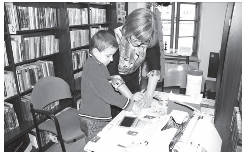
Na dzieci, które zawiąły w tym tygodniu do Oddziału Literatury Polskiej biblioteki w Karwinie, czekały prawdziwie detektywistyczne zadania. Na początek: od-ciski palców.