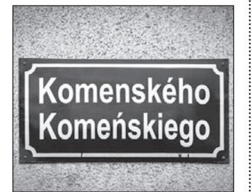
Podwójne napisy są jednym z najbardziej widocznych rezultatów wdrożenia Karty.

Strony, które zdecydowały się przyjąć na siebie zobowiązania wynikające z Karty, w dokumencie ratyfikacji musiały wyszczególnić, które języki i w jakim zakresie będą chronione na terytorium danego państwa. Część II Karty określa ogólne zasady i cele ochrony języków mniejszościowych i regionalnych. Należą do nich szeroko rozumiana promocja, zapewnienie odpowiednich metod i środków do nauczania i studiów w tych językach, przyjęcie za jeden z celów edukacji poszanowanie, zrozumienie i tolerancję wobec języków regionalnych i mniejszościowych.