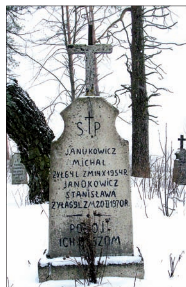
Mogiły w Janukach.

Niestety, ironia losu sprawiła, że mieszkańcy Januków nie rozmawiali z Wiktorem Janukowyczem. Wdzieli go w swej osadzie tylko z daleka, w otoczeniu urzędników. O tym, że miał trudną młodość nie wiedzą. Święcie wierzą w nieskalaną czystość serca i duszy tego człowieka.