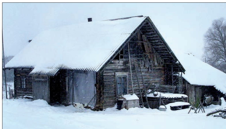
W osadzie Januki mieszka dziś tylko pięć osób.