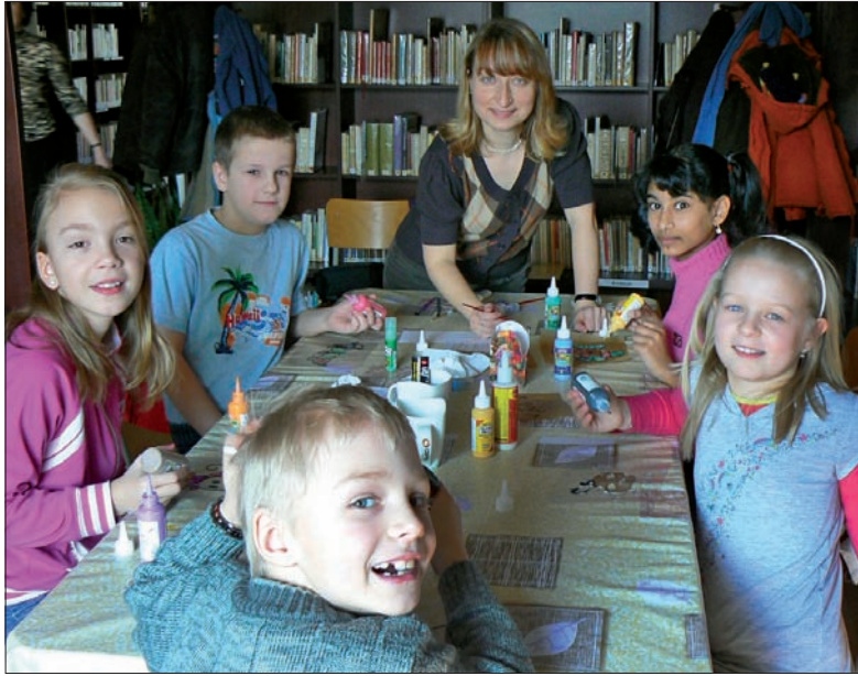
Najlepsza jest wspólna zabawa!

Biblioteka Regionalna w Karwinie również przygotowała na marzec liczne imprezy. Już od lutego we wszystkich oddziałach dziecięcych trwa konkurs czytelnicy „Bibliomaniak 2010”. Uczestnicy konkursu według własnego wyboru i swych możliwości wykonują zadania, za które otrzymają wynagrodzenie w biblieuro. Za zgromadzone fundusze na swych kartach bankowych mogą w kwietniu zrobić zakupy w bibliomarkecie. Jakie zadania mają do wykonania Bibliomaniacy? O tym możecie przeczytać na stronach internetowych www.rkka.cz . Tam też znajdziecie informację o konkursie plastycznym „Ilustrujemy wiersze Jana Brzechwy”. W związku z tym mam dla Was miłą niespodziankę – kto prześle nam do 31 marca starannie wykonaną dowolną techniką ilustrację – będzie mógł wziąć udział w losowaniu nagród książkowych!