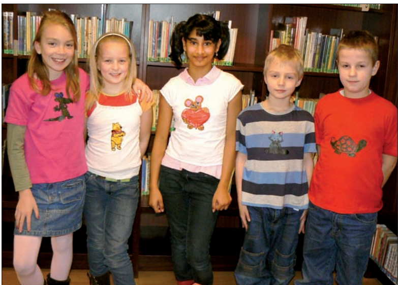
Bajkowo pomalowane bawełniane koszulki, czyli „Bibliowakacje” w Karwinie.