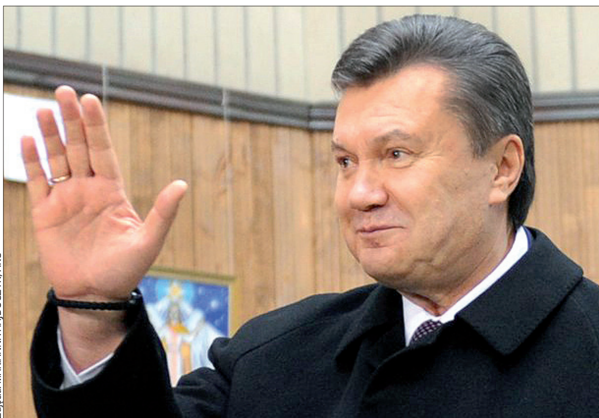
Nowy prezydent Ukrainy – Wiktor Janukowycz.

Zachowały się wiadomości o tym, że dziadek Wiktora Janukowycza