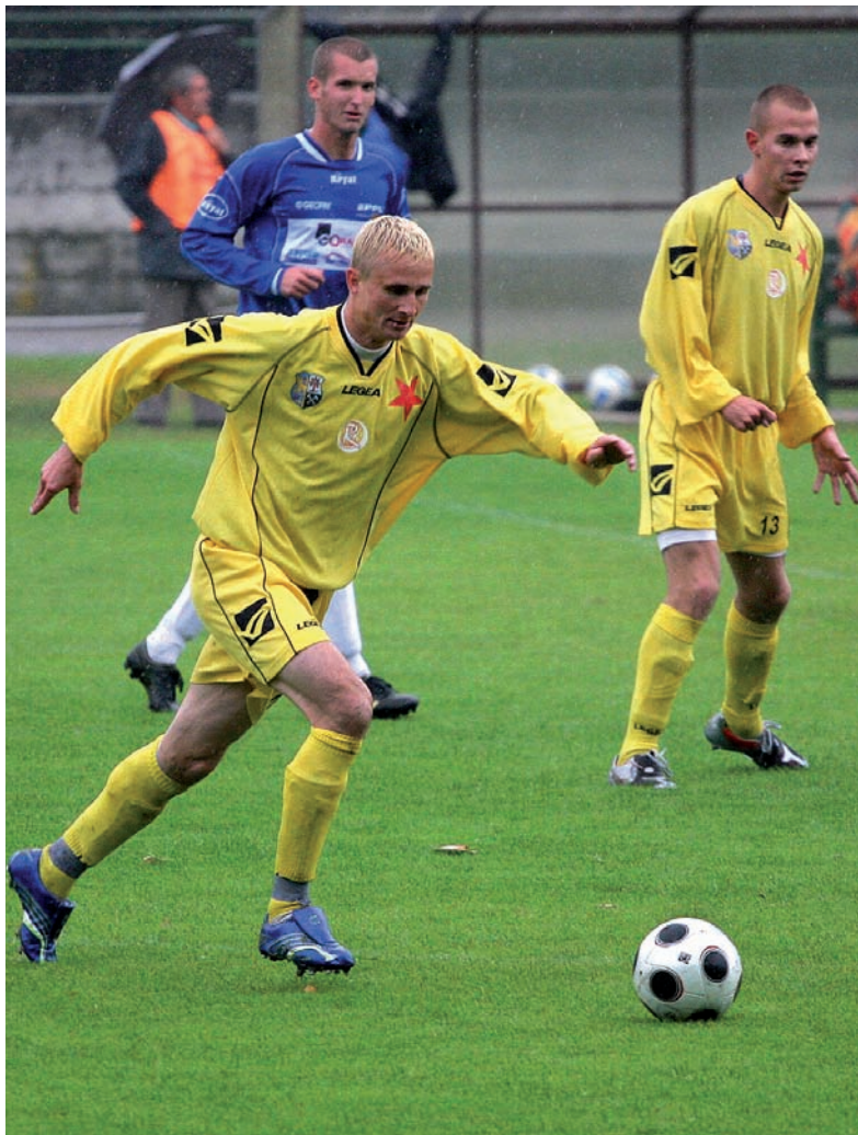
Piłkarze Slavii Orłowa (w żółtych dresach) w najbliższą sobotę zainaugurują wiosenną rundę w dywizji. U siebie zagrają z liderem tabeli, Zlinem B.