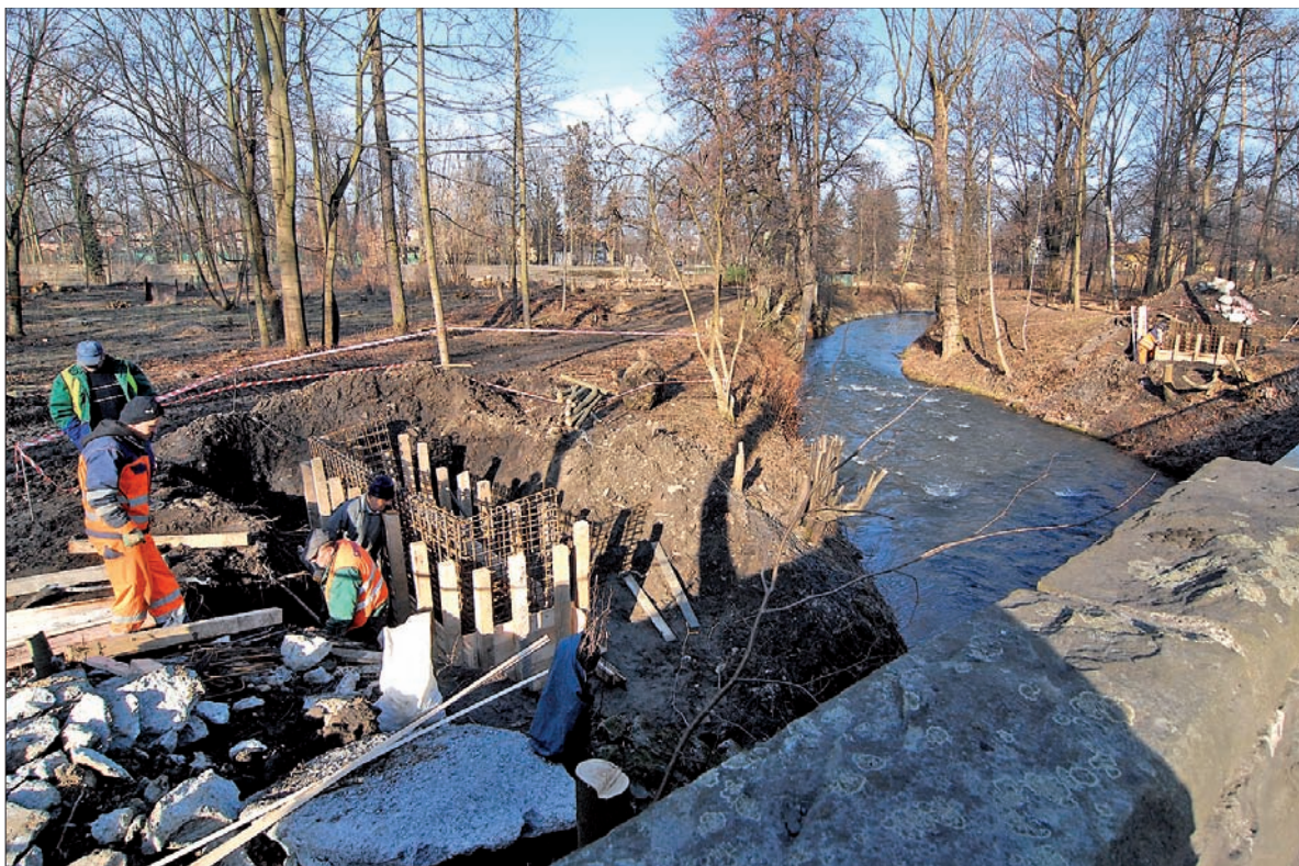
Po polskiej stronie prace już ruszyły. Potrwają do połowy 2011 roku.