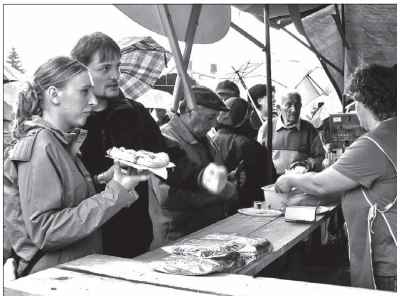
Stoisko PZKO na zeszłorocznym Dniu Milikowa było oblegane przez gości festynu.