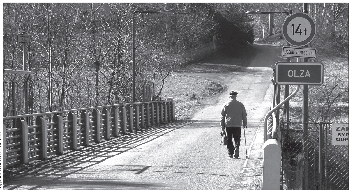
Jedyny w Republice Czeskiej most, na którym Olza nazwana jest tylko i wyłącznie Olzą.

Gródek to miejscowość podzielona na trzy części. Najbardziej widoczną „granica” jest nowo wybudowany korytarz kolejowy i przylegająca do