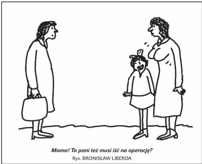
Mamo! Ta pani też musi iść na operację?

Nie wiadomo, jak długo potrwa proces. W przypadku uznania winy w grę wchodzi kilka możliwych kar, zupełnie innych niż te nakładane przy procesach osób fizycznych. Może to być na przykład likwidacja osoby prawnej, kara finansowa lub najłagodniejsza z kar – obowiązek podania na własny koszt do wiadomości publicznej wyroku sądowego. (ep)