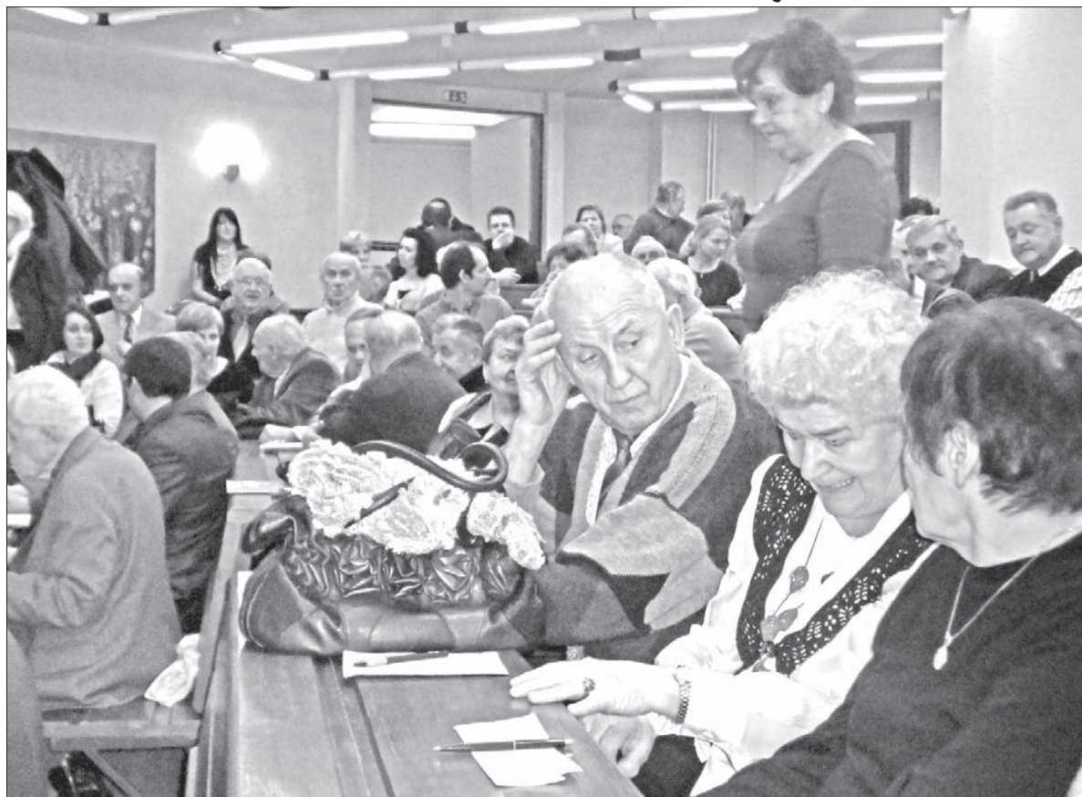
W Auli Polskiego Gimnazjum na spotkaniu MUR-u zasiadła tym razem ponad setka słuchaczy.