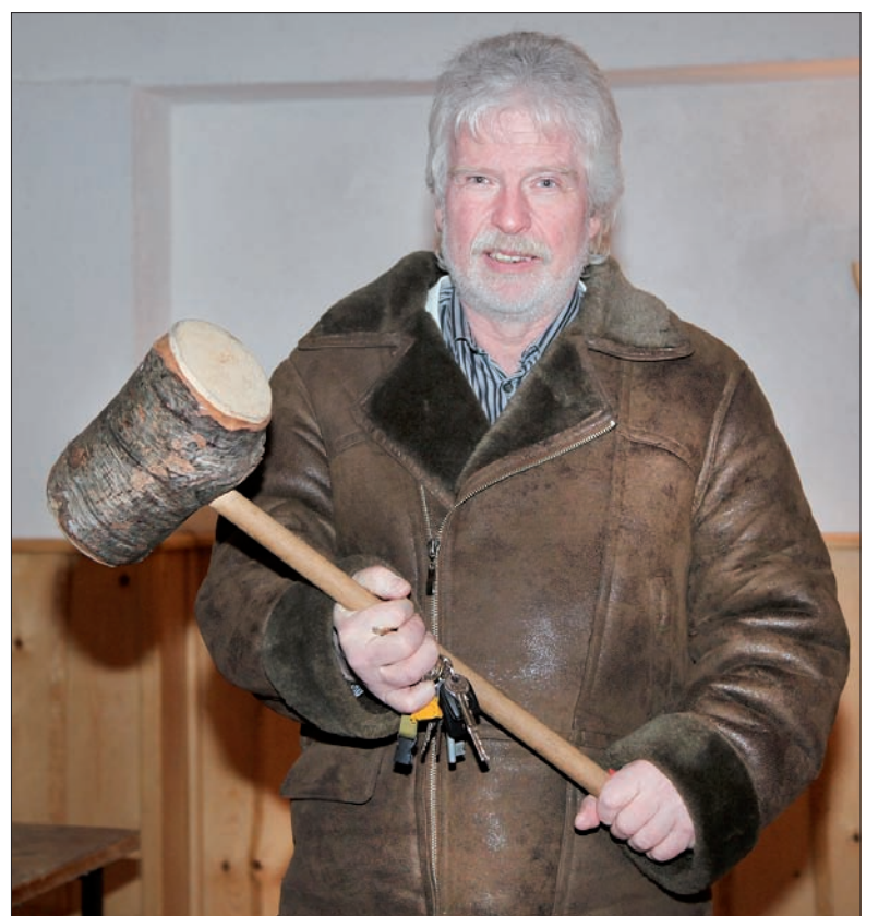
– A to jest młot na wszystkich dłużników – podkreśla.