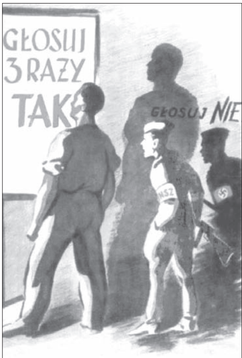
Komunistyczny plakat propagandowy z 1946 roku: żołnierz Narodowych Sił Zbrojnych rzuca cież, który przybiera postać Niemca ze swastyką.

Na ekranie pojawiło się powszechnie znane zdjęcie przywódców Wielkiej Brytanii, USA i Związku Radzieckiego na Konferencji Jałtańskiej.