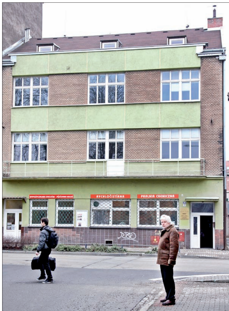
Biuro ZG PZKO było w swoim czasie jego drugim domem.

W ZG zajął się działalnością głównie sportową i młodzieżową. – Była to ciekawa praca, ale w trudnych czasach. W czasach „husakowskich” bowiem trzeba było walczyć o każdą nową myśl, o każdą nową koncepcję – wspomina. – A ja, jako absolwent polskiej uczelni wyższej, miałem tyśiąc pomysłów na minutę. Wszystkie zaś dotyczyły przeformowania pracy w kołach PZKO, które kierowały się zasadami poniekąd już skostniałymi. Wielu działaczy uważało, że