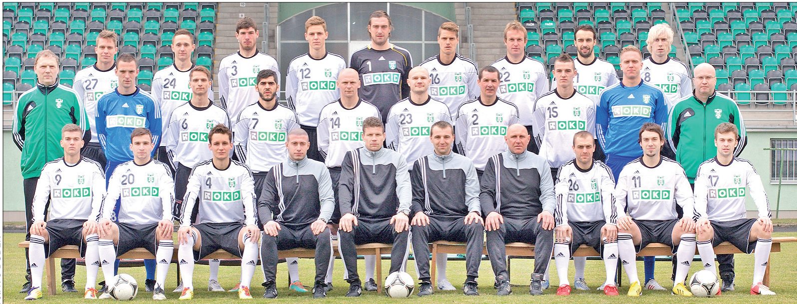
Zespół MFK OKD Karwina w wiosennym sezonie 2012-2013.