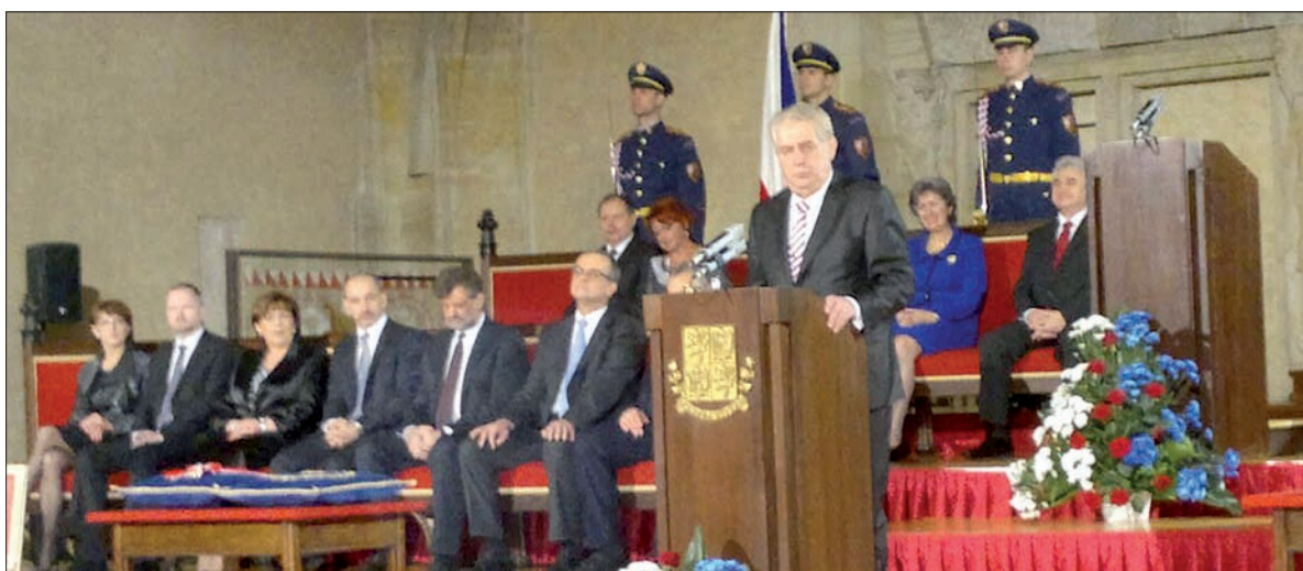
Miloš Zeman wygłasza swe pierwsze prezydenckie przemówienie.

O godz. 10.17 Miloš Zeman złożył przysięgę prezydencką z ręką położoną na Konstytucji Republiki Czeskiej. W sali zabrzmiał hymn państwowy, spod Petrzyna wystrzelono 21 salw armatnich. Następnie nowy prezydent wygłosił inauguracyjne przemówienie. – Staję przed wami jako pierwszy prezydent Republiki Czeskiej wybrany przez obywateli w bezpośrednich wyborach. Uświadamiam sobie wynikającą z tego odpowiedzialność i jestem gotów jej sprostać – powiedział na wstępie. Dalej wymienił najważniejsze cele, które