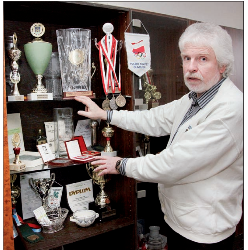
Te puchary to świadectwo, że nasi sportowcy są najlepsi...

wystarczy zorganizować prelekcję, wziąć udział w pochodzie podczas Festiwalu PZKO. Właśnie w ostatnim przypadku byłem autorem nowej koncepcji: zorganizowania na