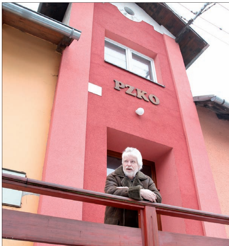
W sali tego Domu PZKO grał z kapelą Azymut.

– W latach 90. ubiegłego wieku, kiedy prowadziłem własne biuro podróży, wycofałem się z pracy społecznej. Ale nadal śledziłem to, co dzieje się w życiu społecznym polskiej mniejszości w naszym regionie. Bardzo martwiło mnie, na przykład, to, co działo się wokół „Piasta”. To z powodu długów PZKO związanych z tym hotelem były ośrodek „Pasieczki”, który tak wielu nas kochało, poszedł w 2004 roku „pod młotek”. Ośrodek zamierzały kupić różne