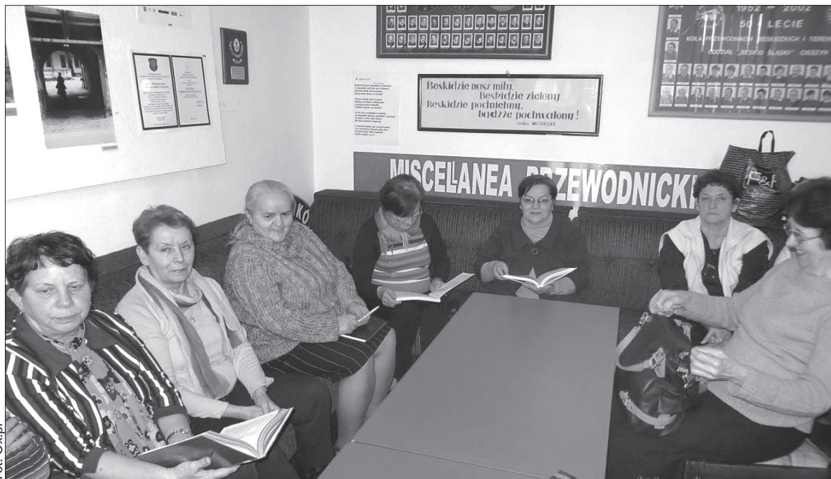
Pierwsze spotkanie odbyło się w cieszyńskim Domu Narodowym.

– Dziwnie piękna jest gwara śląska. (...) Zapytać o coś napotkanego gazdę, odpowie ci językiem, w którym ongiś Mikołaj Rey swój „Żywoć człowieka pościwego” spisywał. Ma się wtedy wrażenie, że ktoś przed tobą stary folia o pergaminowych kartach roztworzył i czyta ci z nich językiem, którym ludzie w Polsce przed wiekami mówili, językiem dostojnym a namaszczone, bo po Piastach w spadku otrzymanym. Jest to jedyna gwara polska niemazurcząca i dlatego też może – jak pisze prof. Nitsch – Śląsk jest bodaj jedyną w Polsce dzielnicą, w której narzecze ludowe nie zostało zepchnięte do roli pogardzanego kopciuszka, z rzadka