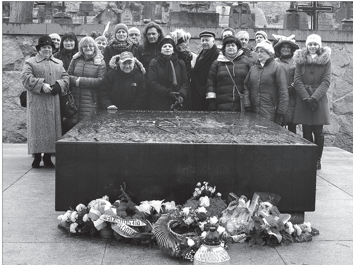
Uczestnicy spotkania w Wilnie.

Miejscem ostatniej „mobilności” będzie Amsterdam, ale na spotkaniu w Holandii najprawdopodobniej zabraknie przedstawicieli jabłonkowskiego Koła PZKO. Wyjadą oni jednak na pewno pod koniec lipca do Suwałk, gdzie odbędzie się spotkanie podsumowujące kończący się w tym miesiącu realizowany przez dwa lata projekt EDI. (kor)