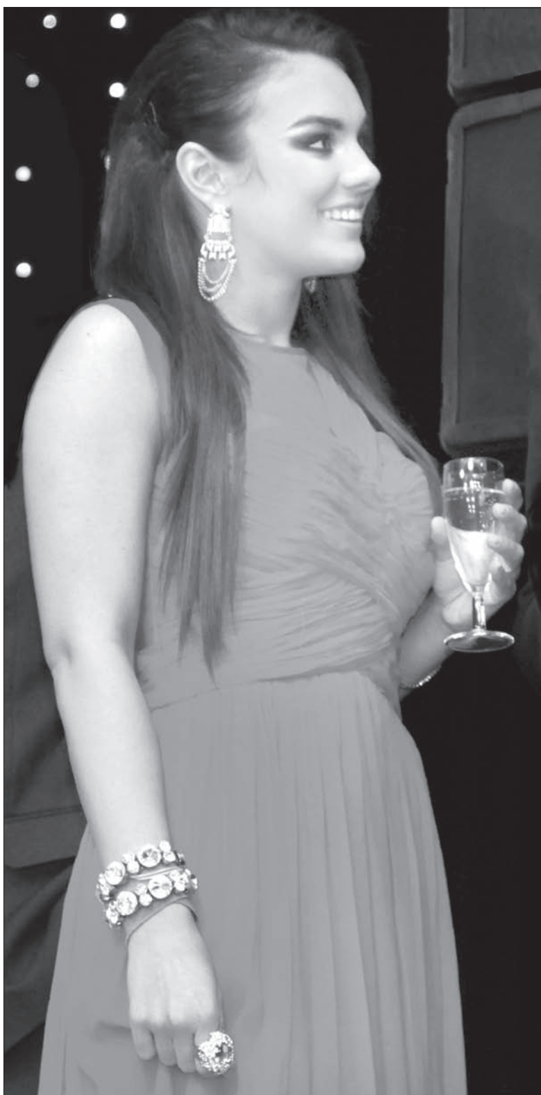
Ewa Farna na Balu Akademickim w Trzyńcu.

Niezupełnie tak się czuję, bo kiedy zaglądam na Facebook'a czy kupuję gazetę, odnoszę wrażenie, że to ja jestem nadal tą ocenianą, a nie oceniającą. Jako juror, naturalnie, oceniam zdolności wokalne, obycie sceniczne, aparycję. Patrzę na tych ludzi poprzez swoje własne doświadczenia. Tu nie chodzi tylko o samo śpiewanie, choć to naturalnie warunek numer jeden. Ważne jest, żeby mieć w sobie to coś, co można nazwać tabasco, coś, co nas odróżnia od innych. Często aż za bardzo wchodzę w skórę uczestników i tak pewnie pozostanie do końca. Jestem pewna, że nie powstrzymam łez, śmiechu... Taka już jestem.