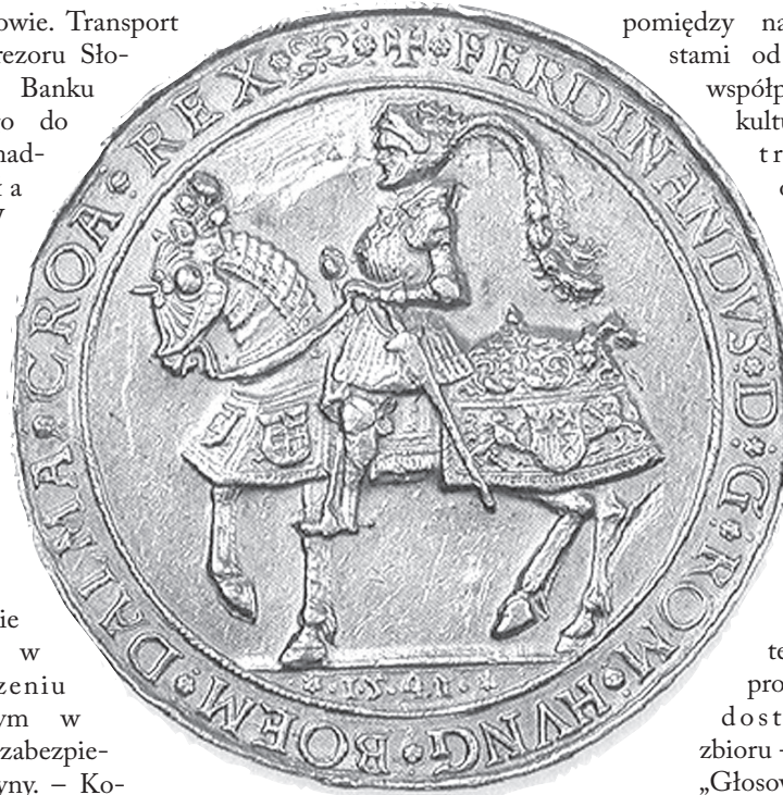
Medal z wizerunkiem Ferdynanda I należy do najcenniejszych eksponatów.

złoto będzie wystawione w pomieszczeniu wyposażonym w specjalnie zabezpieczone witryny. – Koszyce są partnerskim miastem Ostrawy,