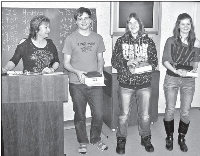
Laureaci tegorocznego konkursu „Enjoy Your English”.