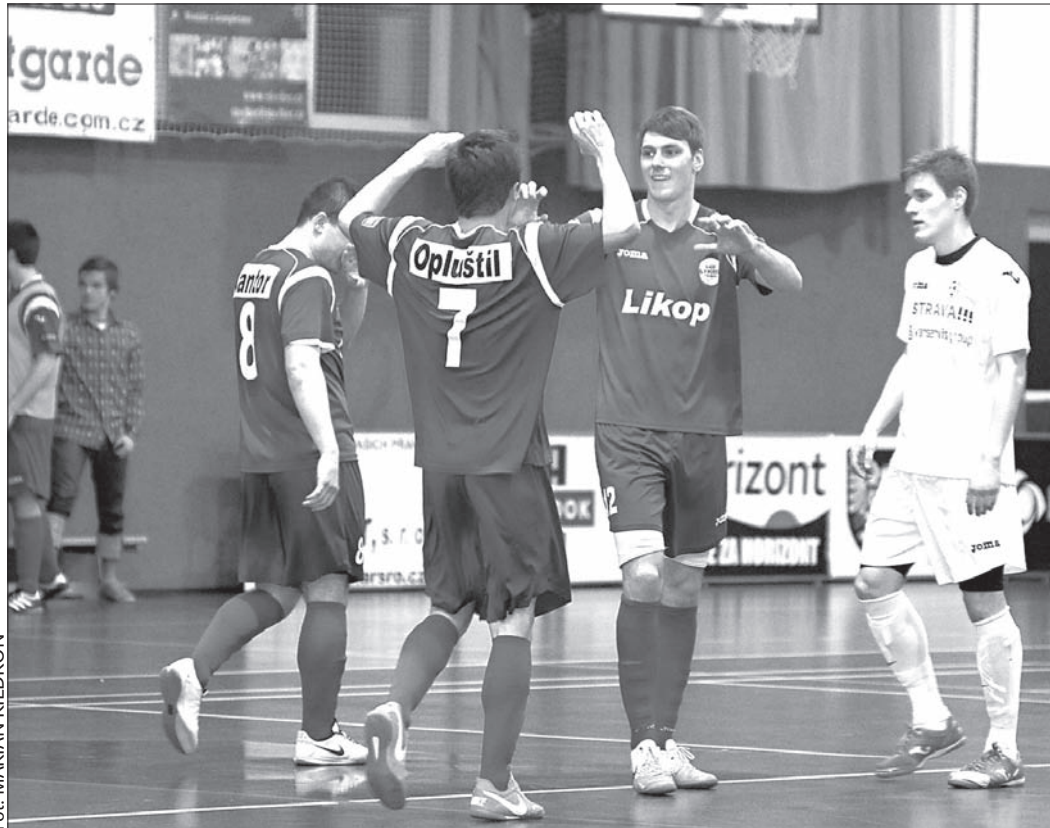
Likop Trzyniec wywalczył prawo gry w pierwszej lidze.