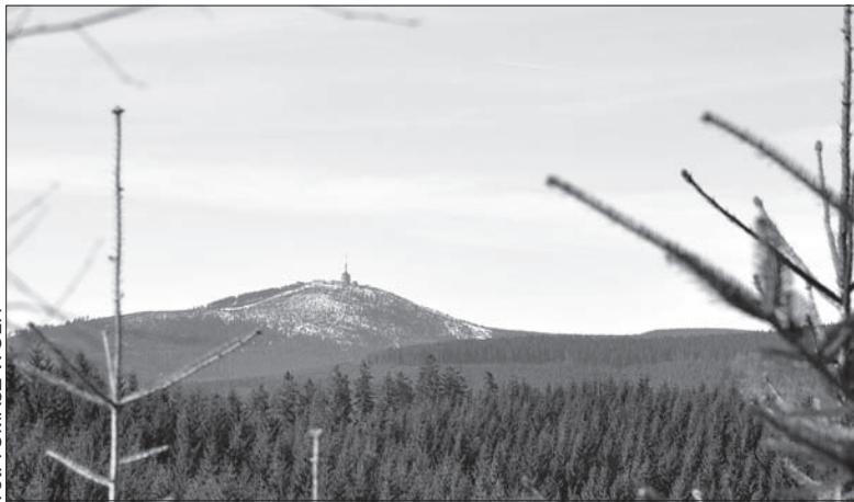
Łysa Góra, najwyższy szczyt Beskidu Morawsko-Sląskiego.

badań klimatu. Co godzinę dane uzyskane podczas pomiarów przesyłane są bezpośrednio do Czeskiego Instytutu Hydrometeorologii w Pradze-Komorzanach. (kor)