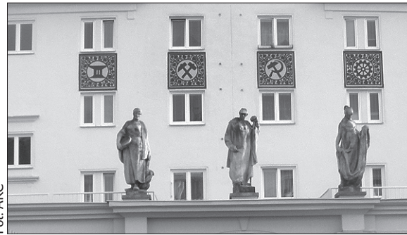
Na elewacjach domów odnowiono również charakterystyczne elementy zdobnicze. (dc)

Trwa remont Placu Budowniczych w Karwinie-Nowym Mieście. Centrum dzielnicy, nie cieszącej się dziś dobrą sławą, powoli ożywa. W tej chwili cały podłużny plac jest rozkopany, a przechodnie poruszają się po wąskich chodnikach, ograniczonych siatką. Projekt rewitalizacji dofinansowany jest z funduszy europejskich. Projekt złożyło miasto przy współudziale spółki RPG, która jest właścicielem otaczających plac domów. Te wybudowane są w stylu realizmu socjalistycznego (w architekturze nosi nazwę „sorela”), dlatego na elewacjach domów odnowiono również charakterystyczne dla tego stylu elementy zdobnicze – młot i sierp, szyb kopalniany czy dźwig.