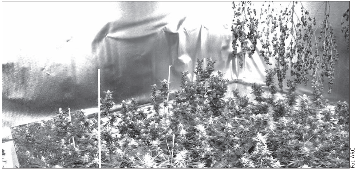
Plantacja marihuany w domu jednorodzinnym w Czeskim Cieszynie.

Kolejne osoby zatrzymano w domu publicznym w centrum miasta. Chodzi o czterech mężczyzn w wieku od 33 do 40 lat, którym również postawiono już zarzuty. Piątego