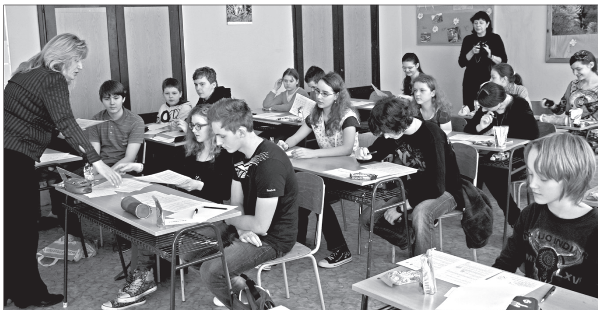
Zadania matematyczne rozwiązywano m.in. w PSP Czeski Cieszyn.