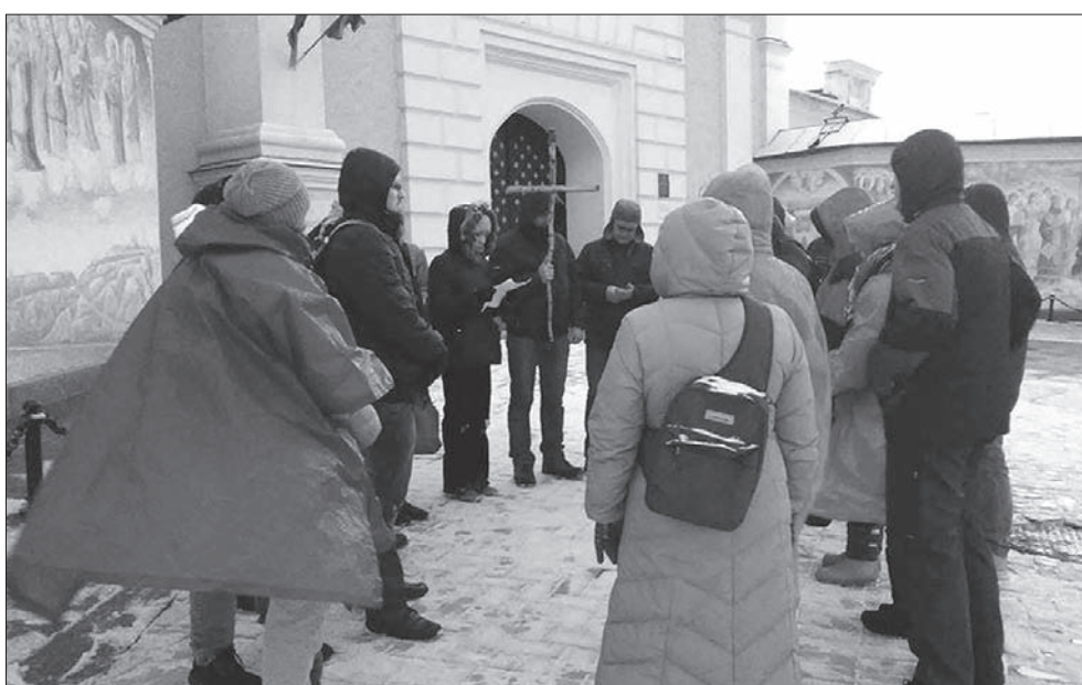
Ekstremalna Droga Krzyżowa cieszy się coraz większą popularnością.

Jedną z nich jest trasa Matki Boskiej Częstochowskiej. Od trasy „Śląsk Cieszyński” różni się ona początkowym odcinkiem, który prowadzi obok bardzo ładnej kaplicy Matki Boskiej Częstochowskiej w Piosecznej. Ta tra-