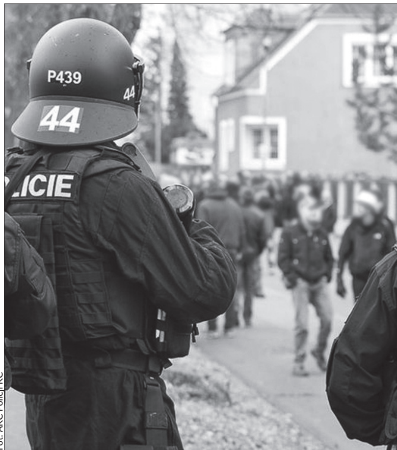
Policjanci mieli pełne ręce roboty.

Policja i pogotowie ratunkowe miały pełne ręce roboty podczas sobotniego drugoligowego meczu piłki nożnej w Opawie. Pojedynekowi Banika Ostrawa i SFC Oparwa towarzyszyły rozróbny kibiców Banika, którzy nie dostali się na stadion.