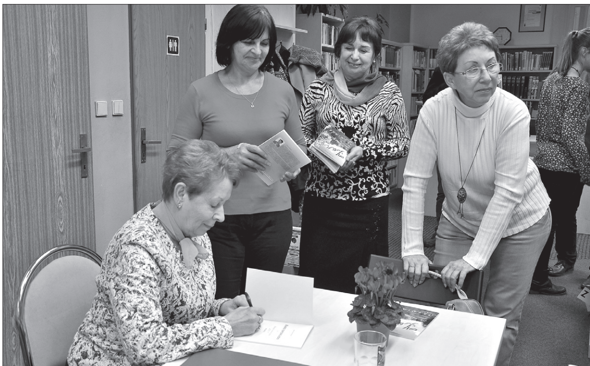
Po spotkaniu można było kupić opowiadania z autografem autorki.