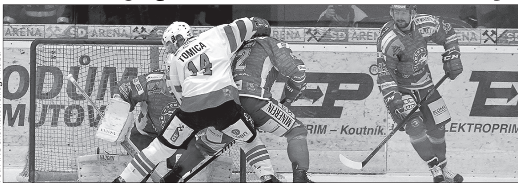
Hokeiści Trzynieca nie rezygnują z walki o awans do półfinału. Dziś piąta odsłona ćwierćfinału w Werk Arenie.