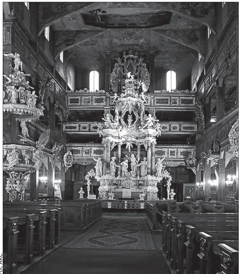
Kościół Pokoju w Świdnicy zachwyca swoim wnętrzem.

WYDARZENIE: Prezydent RP Andrzej Duda wpisał w marcu dziesięć nowych obiektów na listę Pomników Historii. Znalazły się wśród nich m.in. Radiostacja Gliwice, ewangelickie kościoły w Świdnicy i Jaworze, żelazny łańcuchowy most wiszący na rzece Mała Panew w Ozimku czy opactwo benedyktynów w Tyńcu.