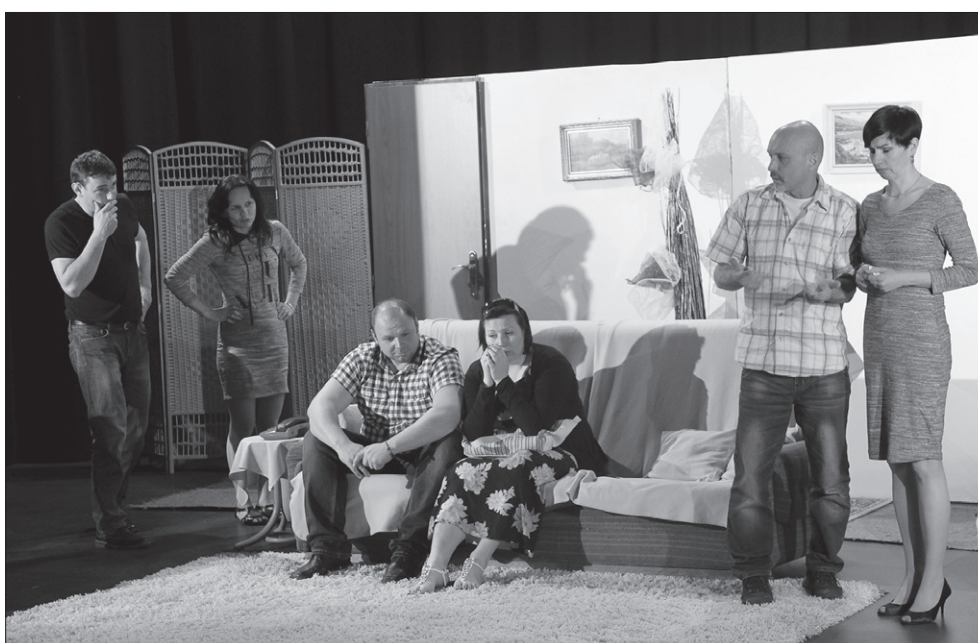
Spektakl komediowy „1+1=3”.