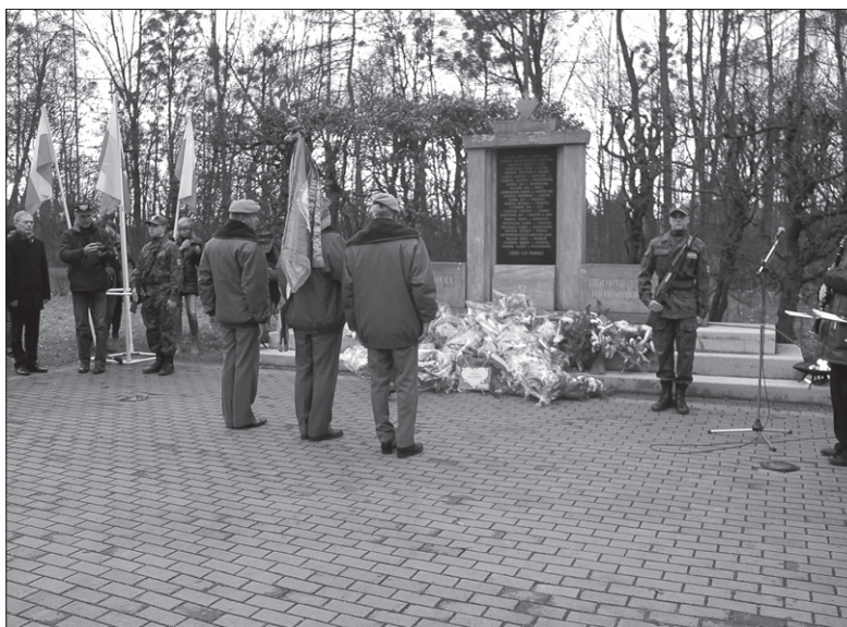
Uroczystości odbyły się w 75. rocznicę tragicznych wydarzeń.