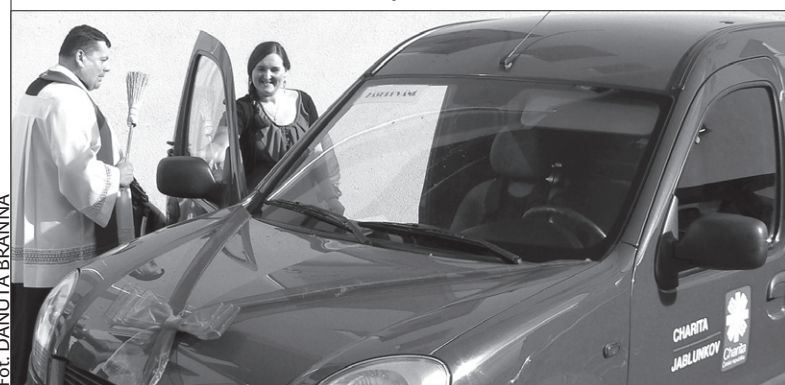
Prezent na czterech kółkach.