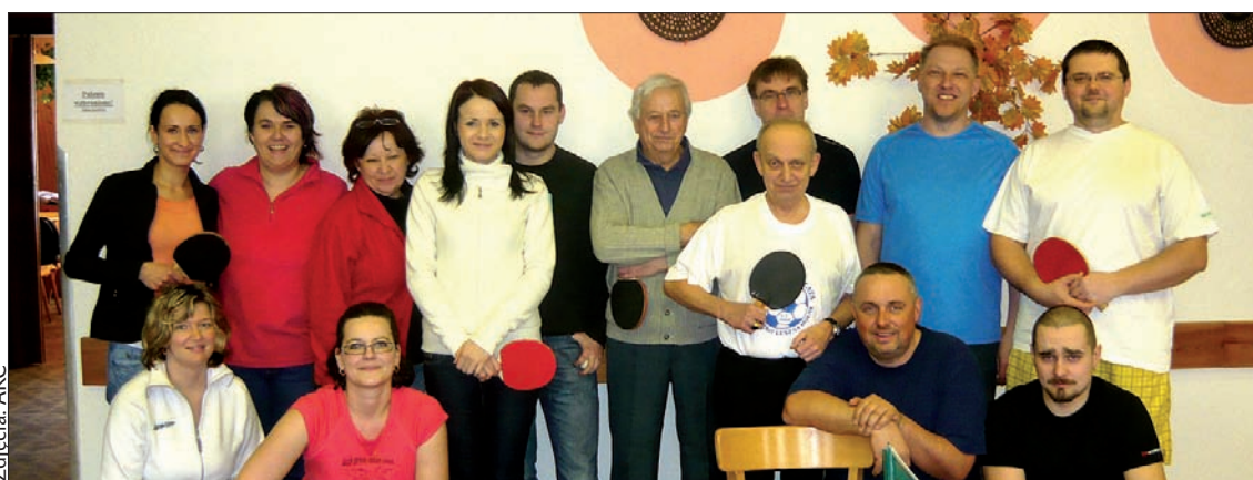
▼ Zawodnicy startujący w kategorii seniorów.