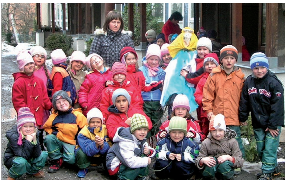
Przedszkolaki z Jabłonkowa i zrobiona przez nich Marzanna.

Marzannę topiono także w Jabłonkowie. W ubiegły piątek 60 dzieci z polskiego przedszkola poszło nad rzekę Łomniankę, żeby utopić kukłę, symbolizującą zimę. Marzannę dzieci robiły od rana, używając do tego gałązek, papieru i materiału. Podobno początkowo kukła Marzanny jakoś nie chciała popłynąć z nurtem rzeki, ale w końcu się udało.