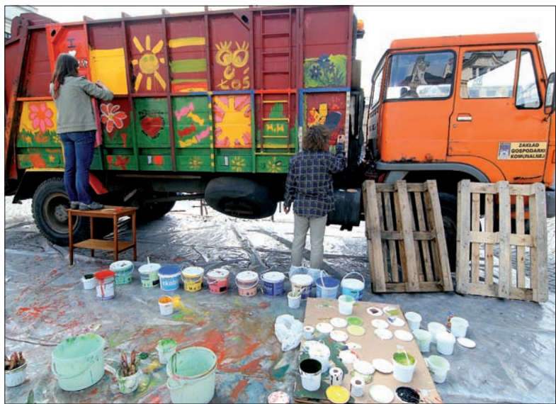
Śmieciarkę malowało 15 uczniów.