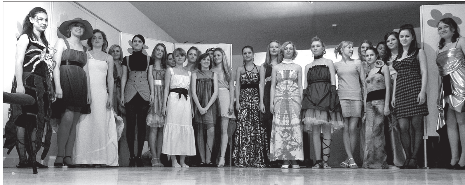
Na gimnazjalnym pokazie mody »Kwiat Morwy« było na co popatrzeć.

W tym samym dniu, przed południem, gimnazjaliści zaprosili swoich kolegów na kolejną imprezę zorganizowaną w ramach projektu Biały Kruk. Tym razem na stadionie zimowym w Czeskim Cieszynie kto miał łzy, mógł wziąć udział w spotkaniu pod nazwą Cieszyński Vancouver i zmierzyć się z rówieśnikami w nietypowych dyscyplinach sportowych. (kor)