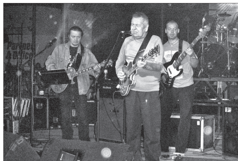
Legendarny Tadeusz Nalepa z zespołem Free Blues Band na Złocie w Wędryni w sierpniu 2006 roku.

Złot w Wędryni odbędzie się dopiero podczas wakacji. Już jednak za niespełna dwa miesiące, w piątek 13