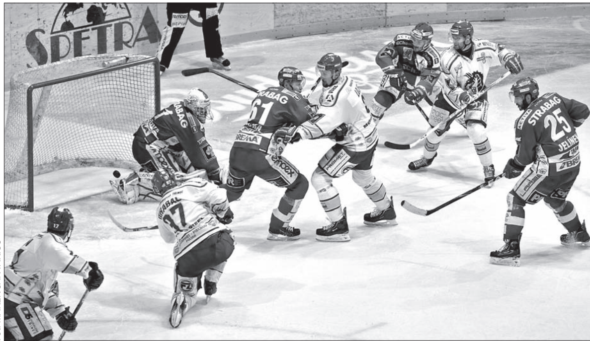
Bramka na 2:2 z kija Josefa Hrabala w zawałowej końcówce trzeciej tercji.

– To był jeden z naszych najlepszych meczów w tym sezonie. Pod względem taktycznym zagraliśmy bez zarzutów. W pełni zasłużyliśmy na to zwycięstwo – stwierdził szkoleniowiec Slavii, Vladimír Růžička.