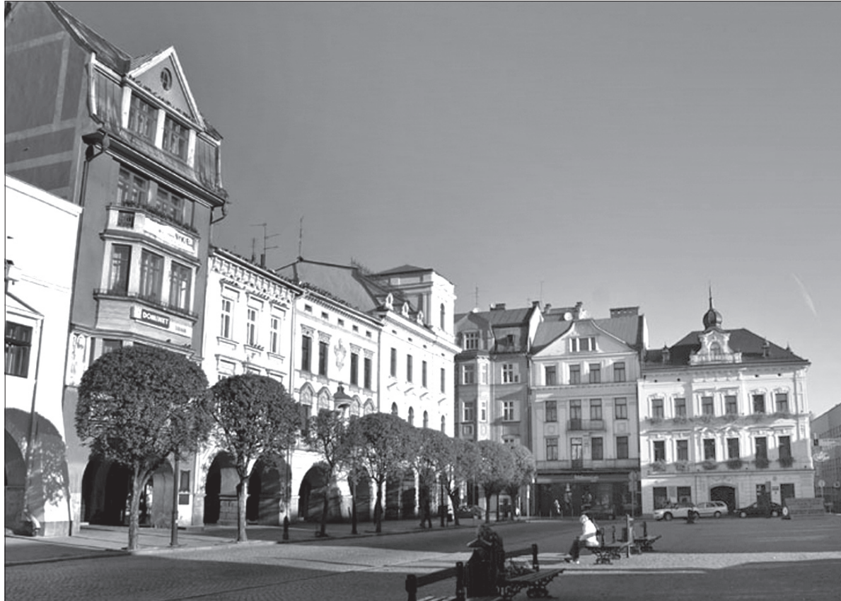
Rynek w Cieszynie. Tu odbędzie się niedzielna impreza.

Nieprzypadkowo impreza odbędzie się w momencie inauguracji rundy wiosennej rozgrywek ligi piłkarskiej, w której rywalizuje cieszyńska drużyna, a jednym z założonych