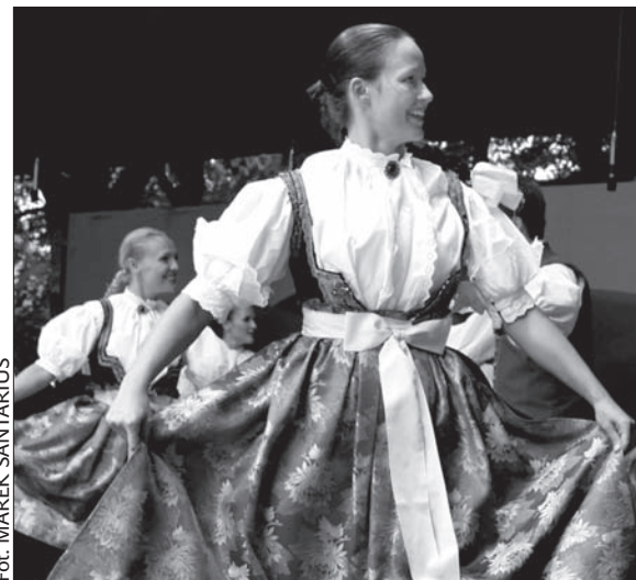
Strój cieszyński to bogactwo naszego regionu.

się znaleźć w planowanym muzeum miejskim. Informacje o tej ciekawej akcji można znaleźć na stronie www.maryska.cz . (dc)