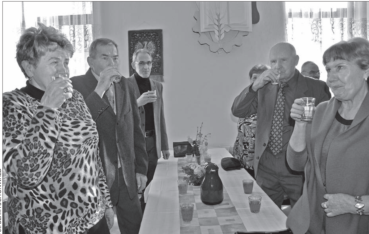
W Skrzeczoni powitano wiosnę wspólnym toastem.