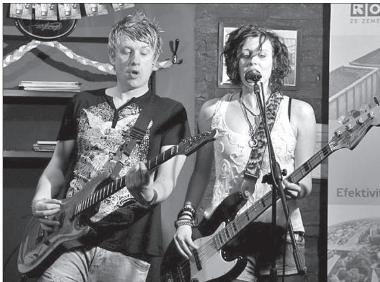
Irlandzkie kapele są głównym magnesem festiwalu.

w huczne obchody, które w większych miastach przybierają postać korowodów i innych imprez ulicznych. Każdy uczestnik obowiązkowo musi mieć na sobie jakąś ozdobę czy gadżet w zielonym kolorze, który uważany jest za barwę narodową. (dc)