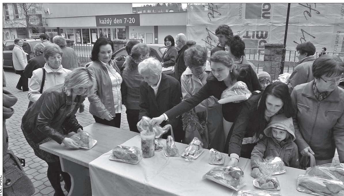
Baranki i kołacze poszły w ub. roku jak ciepłe bułeczki. Caritas zarobił przeszło 167 tys. koron.

Dochód z „Kołacza Wielkanocnego” z roku na rok rośnie. W 2011 roku wyniósł 54,5 tys. koron, w 2012 roku 85,5 tys., w 2013 100 tys., a w ub. roku padł kolejny rekord – uzbierano 167,6 tys. koron. (dc)