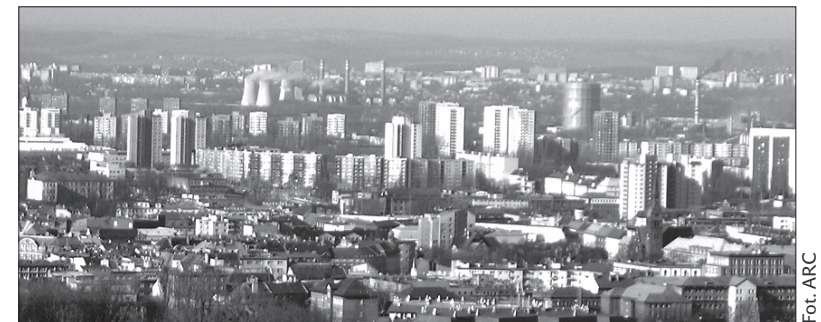
Ostrawa z lotu ptaka.

Według uzyskanych danych, ludzie z województwa morawsko-śląskiego najczęściej „uciekali” do pozostałych województw, a tylko niespełna co piąta osoba wyjechała za granicę. Inaczej przedstawia się bilans, jeśli chodzi o osoby, które wybrały za swój nowy dom województwo morawsko-śląskie. Aż 38 proc. z nich przyprowadziło się tutaj z zagranicy, a tylko 62 proc. pochodzi z pozostałych regionów RC. Ujemne saldo migracji wynoszące 3038 osób plasuje nasze województwo na niechlubnym pierwszym miejscu w „rankingu” wyludniających się województw. Tymczasem na przeciwnym biegunie znajdują się województwa, w których liczba mieszkańców rośnie. Są to województwa: środkowoczeskie, południowoczeskie, pilzneńskie, libereckie, pardubickie i południowomorawskie. (sch)