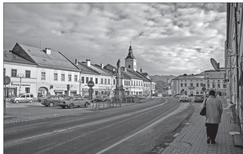
Teraz przejścia dla pieszych będą lepiej widoczne.

w okolicy kładki przez Olzę. – Inwestycje te ciągną się już dwa lata – dodaje Jakus. Sprawa się przedłuża, gdyż prace nie były skoordynowane z Zarządem Utrzymywania Dróg Województwa Południowo-Morawskiego. Zaszła konieczność podkopywania się pod drogę, by zainstalować lampy uliczne oraz światła LED na nawierzchni jezdni. (endy)