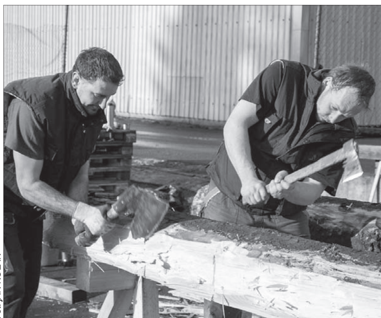
Rzemieślnicy przygotowują belki na budowę.

Trzy lata po pożarze zabytkowego schroniska Libuszina na Pustewnach zakończyła się zbiórka publiczna na jego odbudowę. Na rachunek bankowy wpłynęło w sumie przeszło 9 956 tys. koron, za pośrednictwem SMS-ów charytatywnych darczyńcy przekazali 931 tys. koron. W sumie zgromadzono więc 10,9 mln koron.