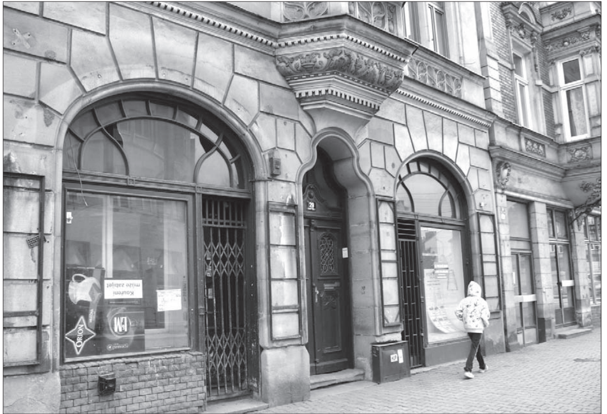
Kamienica przy ulicy Głównej 29 w Czeskim Cieszynie przejdzie drobny remont.

Dotacja miejska, obejmująca 50 procent wszystkich kosztów, pozwoli właścicielom kamienicy na remont okna wystawowego, drzwi wejściowych do sklepu oraz do mieszkania. Jak zaznacza wiceburmistrz Czeskiego Cieszyna Gabriela Hřebacková,