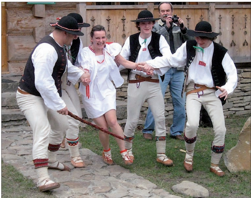
Zespół „Górole” przedstawił oprócz góralskich tańców także typowy obrazek „śmiergustowy”. Woda lała się strumieniami.