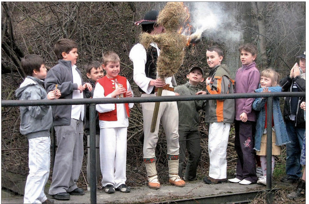
Marzannę zapalono, a potem wrzuciono do potoku Oszetnica.