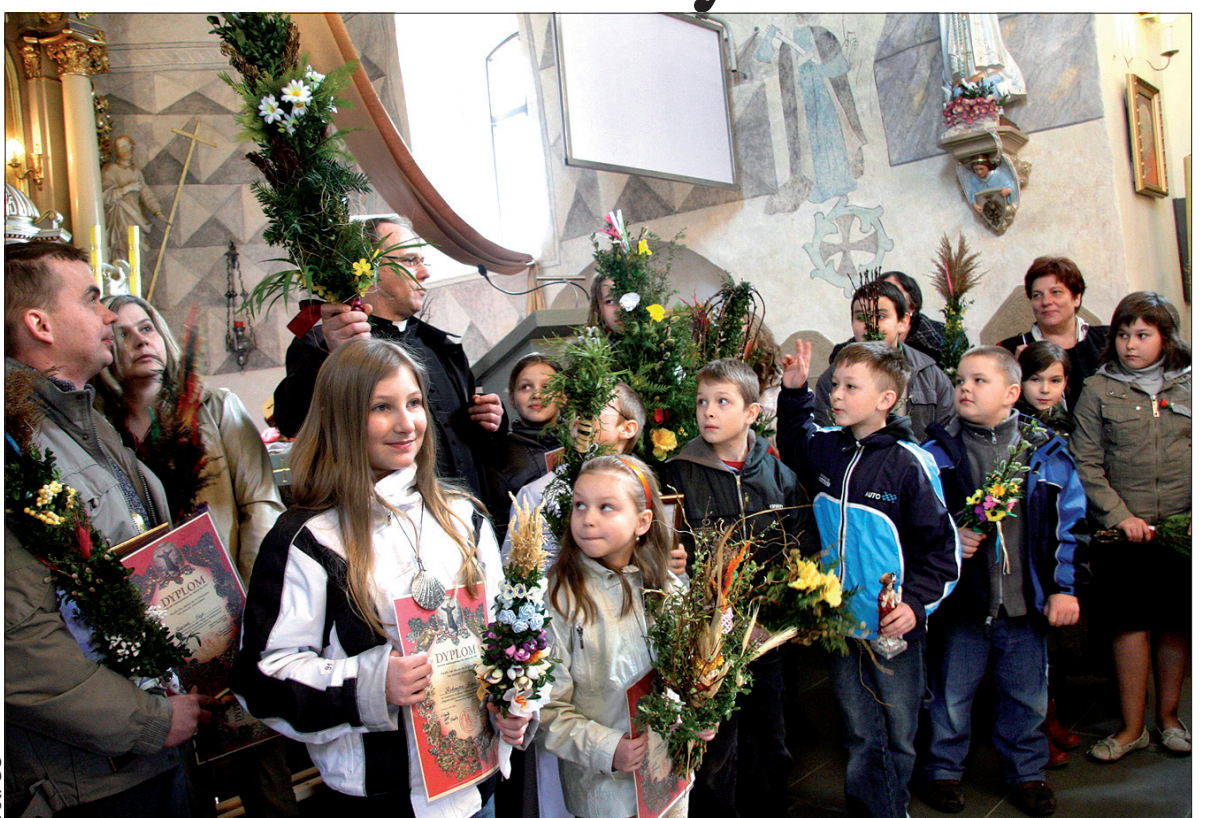
Do konkursu przystąpiło ponad 50 wiernych. Ich dzieła imponowały różnorodnością i kolorystyką.