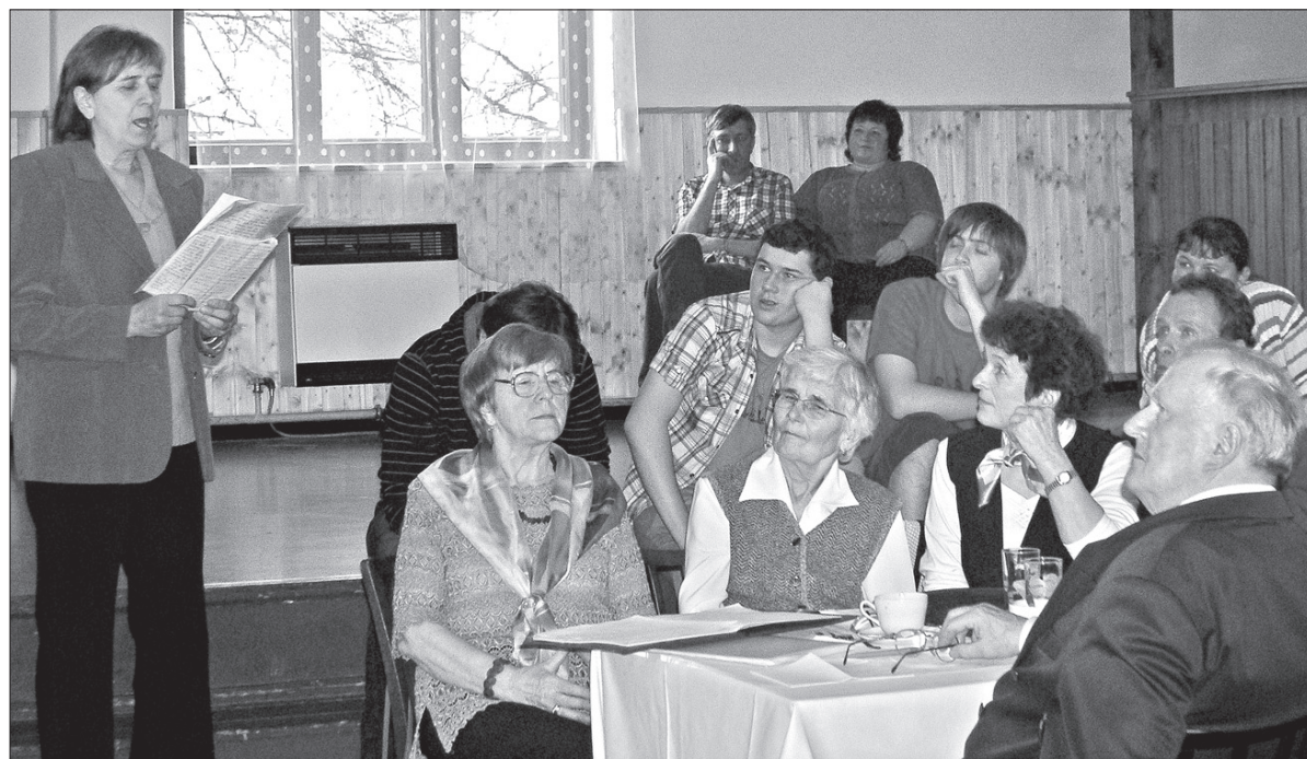
Prezentacji wszyscy słuchali uważnie.