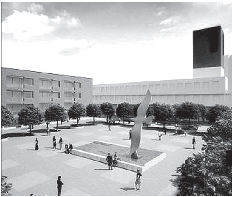
Wizualizacja nowego rynku w Orłowej.

Zbliżający się remont, który dotyczy przede wszystkim centrum Orłowej, obejmie cztery etapy. Najpierw zostanie przesunięty przystanek autobusowy od „Priora” w kierunku centrum handlowego „Centrum”. Następnie pracownicy firmy energetycznej będą mieli za zadanie przemieszczenie trafostacji oraz odpowiednie przygotowanie