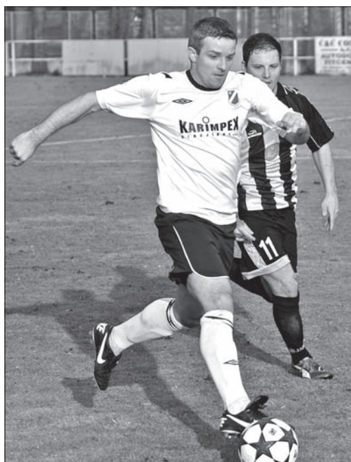
W żoźlińskich derbach ze zwycięstwa 3:0 radowali się piłkarze Czeskiego Cieszyna.