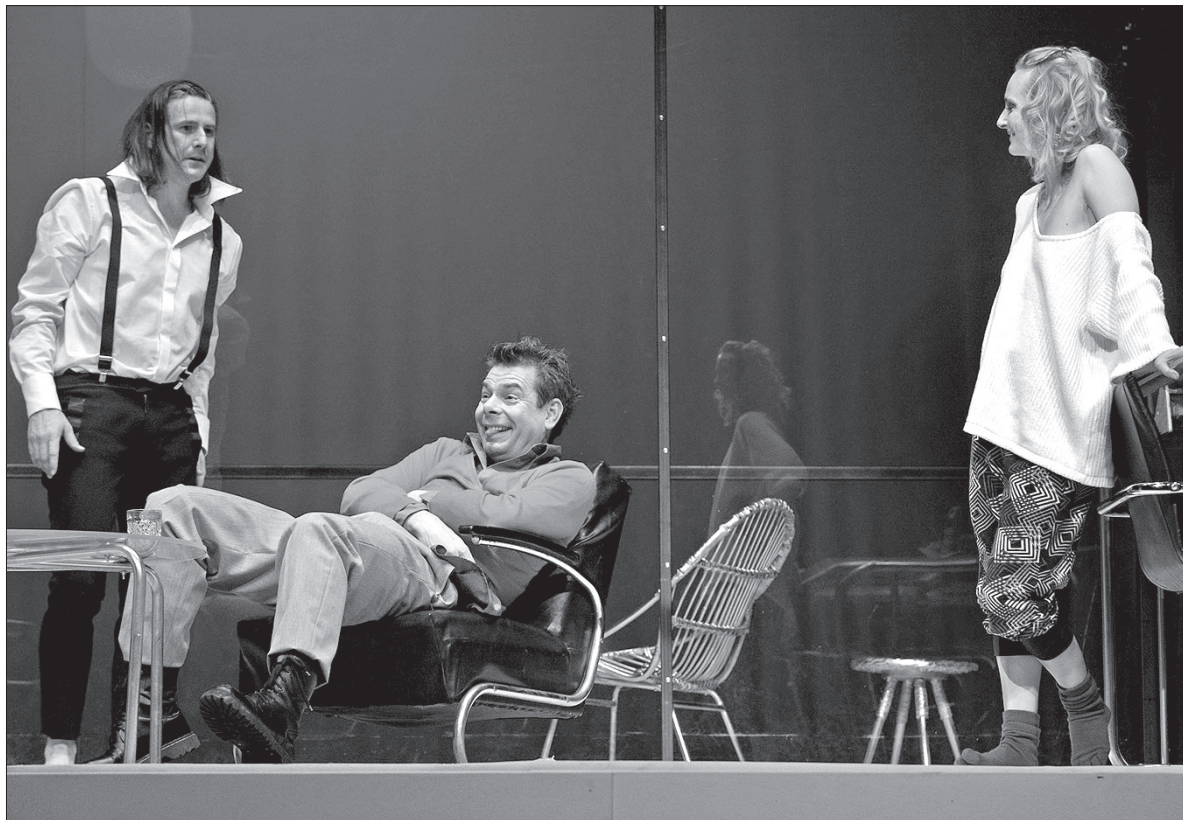
Spektakl „Pomysł na morderstwo” w wykonaniu aktorów Sceny Polskiej TC.

Kilka dni temu urzędnicy Urzędu Marszałkowskiego Województwa Dolnośląskiego postanowili bez konsultacji z zespołami aktorskimi, związkami twórczymi i Ministerstwem Kultury i Dziedzictwa Narodowego zmienić statuty dolnośląskich teatrów i zwolnić obecnych dyrektorów tych scen, zastępując