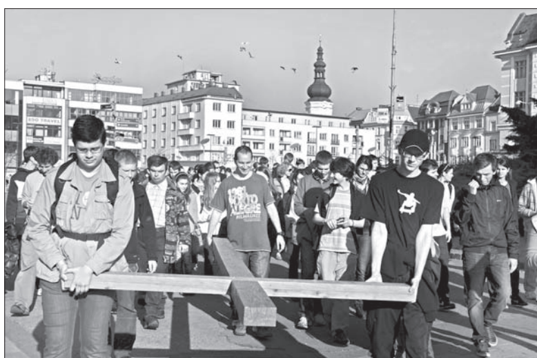
Uczestnicy spotkania z biskupem diecezji ostrawsko-opawskiej niosą krzyż ulicami Ostrawy.

Program dla młodzieży rozpoczął się w piątek wieczorem w Gimnazjum Biskupskim w Ostrawie-Porubie, skąd młodzież udała się do dwóch kościołów, aby przy akompaniamencie muzyki wspólnie się modlić. Właściwe spotkanie z biskupem odbyło się w sobotę w katedrze Boskiego Zbawiciela w centrum Ostrawy. – Młodzież miała okazję wysłuchać katechezy młodego księdza oraz osobistego świadectwa siostry zakonnej. Następnie mogła wybierać z trzech propozycji wykładów