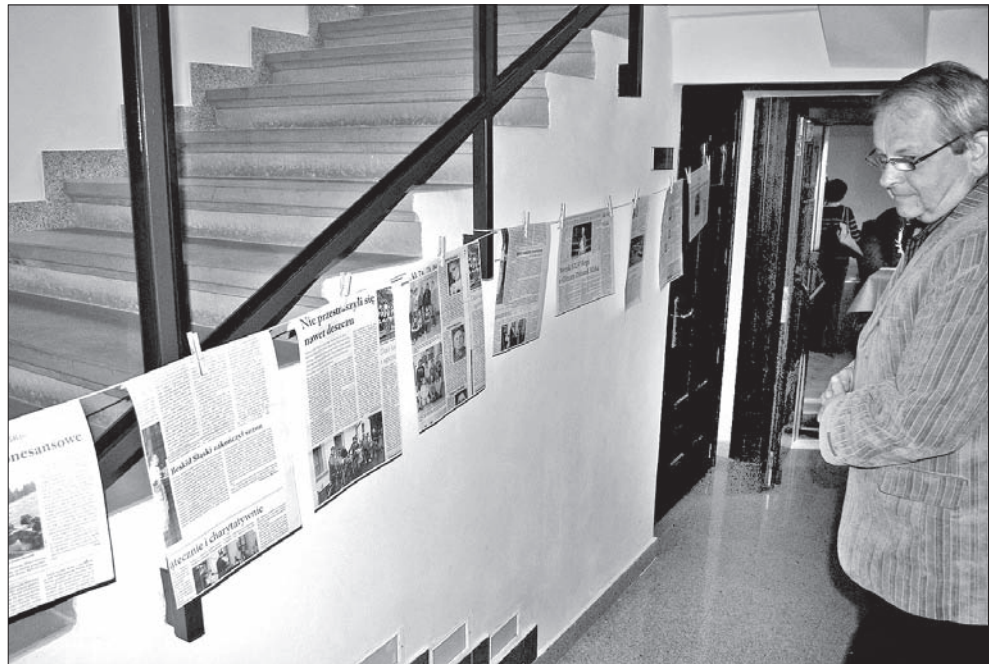
„Głos Ludu” sporo pisał o „Beskidzie Śląskim”. Gości wchodzących na jubileuszową wystawę witały kserokopie niektórych artykułów.