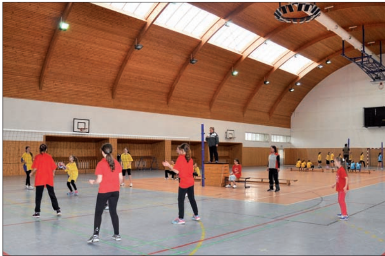
Szkoła w Bystrzycy oferuje świetne warunki do zajęć ruchowych. Są tu hala sportowa, basen i nowoczesne wielofunkcyjne boisko.

Gdzie tkwi przyczyna tego zjawiska? – Wszyscy widzimy, że wylansowany został zupełnie inny styl życia. Młodzież przesiaduje przed komputerami, telewizją, nie czuje potrzeby