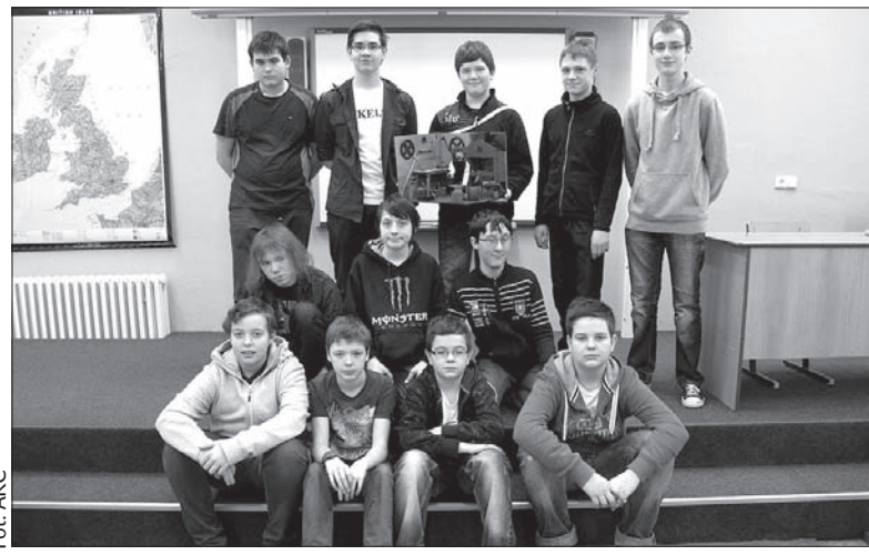
Grupa uczniów PSP z Karwiny brała udział w projekcie „Technika nas interesuje”.

lowej odbył się również konkurs z dziedziny fizyki, w którym oprócz teoretycznych pytań należało też wykonać doświadczenia czy wykazać się wiedzą o słynnych fizykach. Dwuosobowa grupa chłopców z frysztańskiej szkoły zajęła w konkursie pierwsze miejsce. (ep)