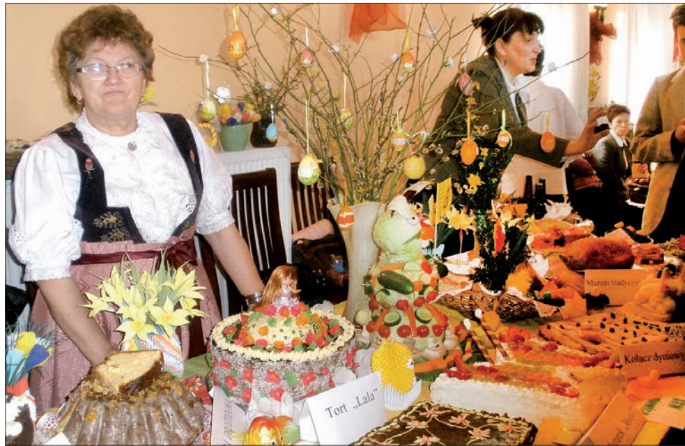
Jedną z poprzednich edycji konkursu wypieków na Wielkanoc. Tegoroczna odbędzie się w przyszłą sobotę.

Historia historią – dziś dowolnie można prze-