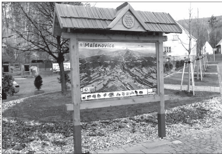
Swoje ręcznie malowane mapy mają już np. Malenovice pod Łysą Górą.