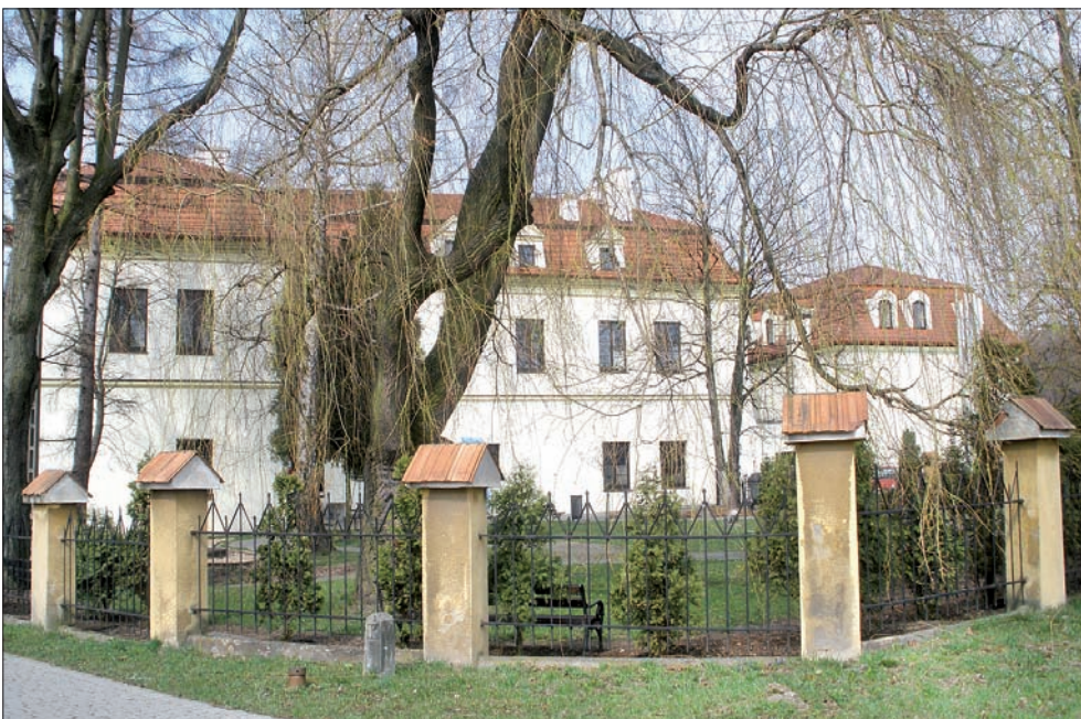
Zamek w Zebrzydowicach prezentuje się okazale.

z piotrowickim stowarzyszeniem „Ave”, drugi z Miejskowym Kołem PZKO w Karwinie-Fryszcacie. Jak wskazuje nazwa „Kuchnia regionalna – tradycyjne dania z obu brzegów Olzy”, chodzi o projekt kulinarno-kulturalny. W jego ramach odbywa się w tym roku dwanaście imprez, w tym dziewięć w Karwinie, trzy w Zebrzydowicach. Głównym celem projektu