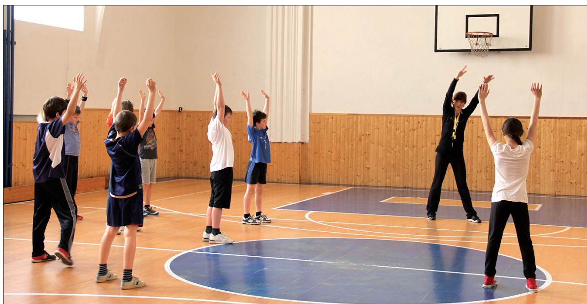
Zajęcia wychowania fizycznego w PSP w Czeskim Cieszynie.