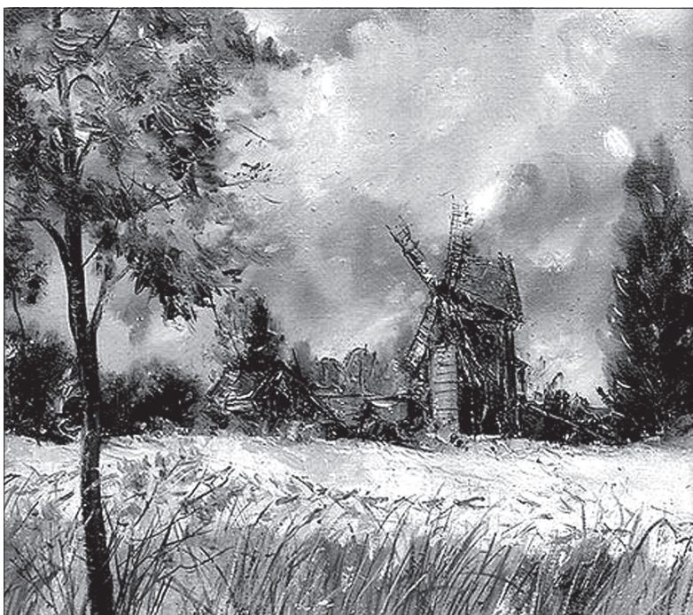
Krajobraz z wiatrakami, olej, rok 1995.