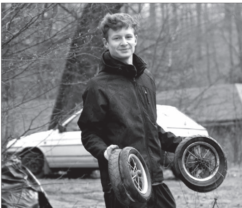
W czasie sprzątania można znaleźć różne rzeczy...

Wolontariusze w granicznym mieście nad Olzą wyruszą w teren już w najbliższą sobotę i sprzątać będą od godziny 9.00 do 13.00 w dwóch częściach miasta. Włączyć się w ini-