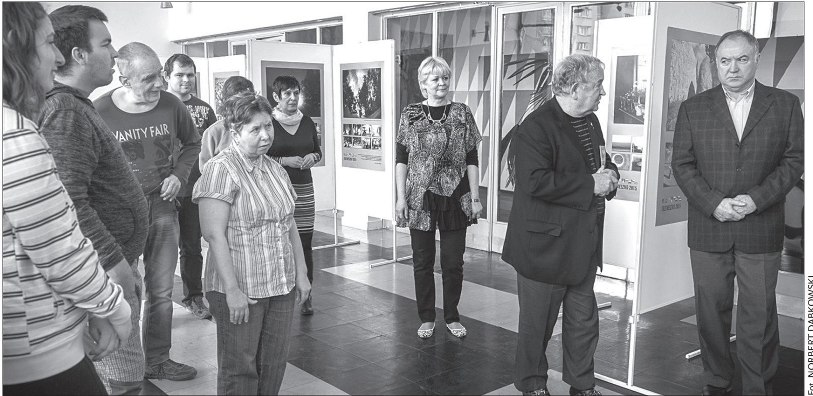
W wernisażu wystawy wzięli udział również niepełnosprawni autorzy zdjęć.

W ubiegłorocznych Międzynarodowych Warsztatach Fotograficznych dla osób niepełnosprawnych w Trze-