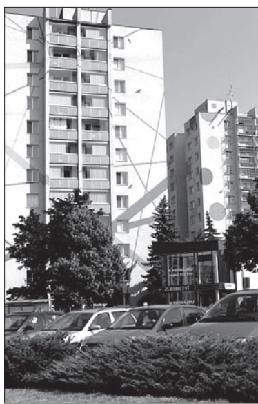
Parkingi na osiedlu Piąty Etap w Orłowej są stale pełne.

Po kontroli przeprowadzonej przez strażaków Straż Miejska zaczęła rozdawać kierowcom mandaty za nieprawidłowe parkowanie. Mieszkańcy osiedla grożą skargami w ratuszu i spisaniem petycji. Argumentują, że nie mają gdzie postawić swoich samochodów. – Kiedy strażnicy zauważą, że kierowcy parkują w miejscach, gdzie utrudniają przejazd strażakom, karetkom pogotowia czy śmieciarzom, nie mogą uda-