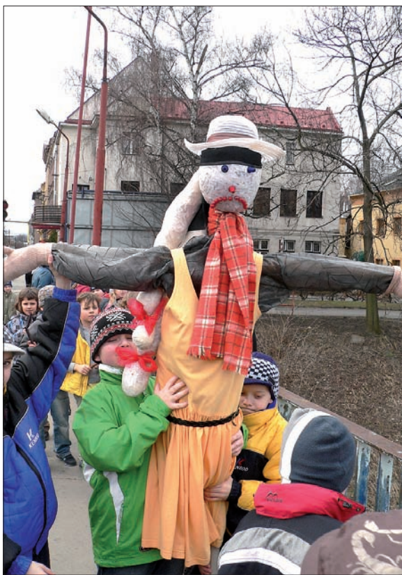
Ostatnie chwile Marzanny na lądzie...

W naszej świetlicy szkolnej topienie Marzanny to już tradycja. Zazwyczaj starsi przygotowują kukłę Marzanny,