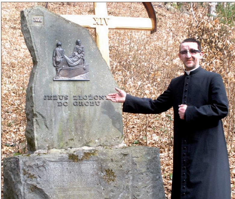
Duchowny przy jednej ze stacji Drogi Krzyżowej.

dzień: 12 do 16 °C dzień: 8 do 12 °C noc: 4 do 0 °C noc: 4 do 0 °C wiatr: 2-6 m/s wiatr: 3-7 m/s