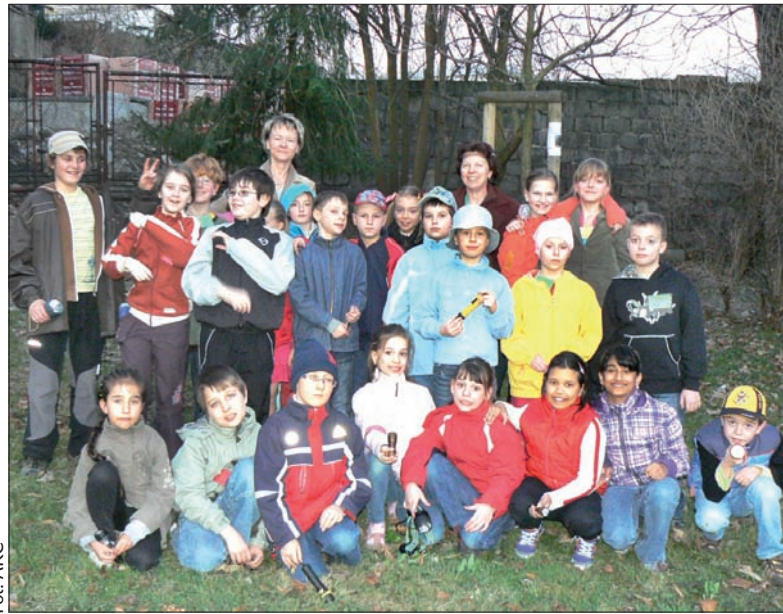
Czytelnicy karwińskiej biblioteki, którzy uczestniczyli w „Wieczorze z Andersenem”.

Żółto-czerwono-zielonopiegowaci Andersenowcy z Karwiny