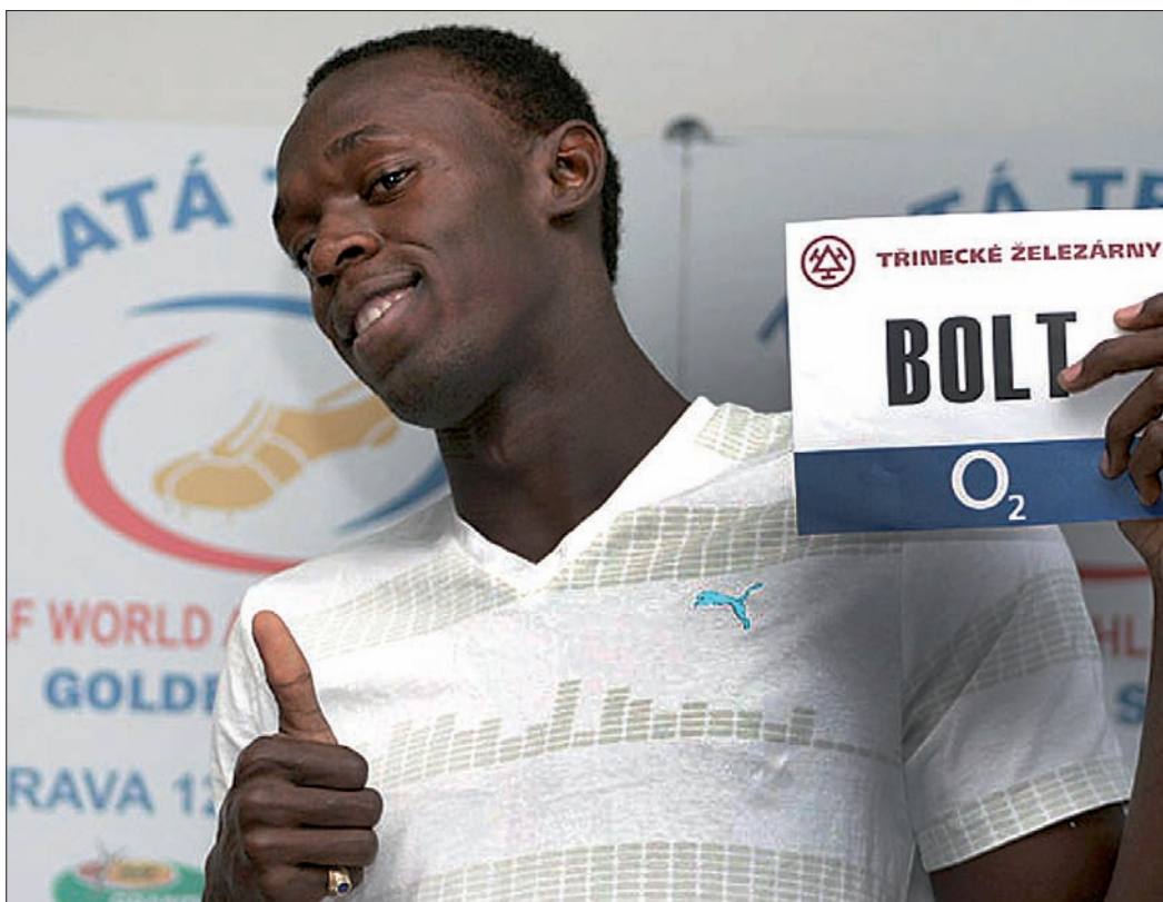
Usain Bolt w Ostrawie czuje się bardzo dobrze.

Organizatorzy wrócili do sprawdzonej formuły z ubiegłego roku i w mityngu dzień wcześniej