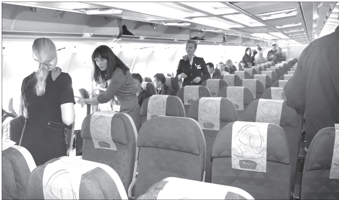
Airbus 330 lata z Pragi do Seulu. We wtorek wyjątkowo wylądował w Ostrawie.

ČSA połączyły wtorkową prezentację letniego rozkładu lotów z promocją samolotu Airbus 330-300, największej maszyny, jaką obecnie dysponują. Airbus dla 276 osób, przeznaczony do rejsów dalekiego zasięgu,