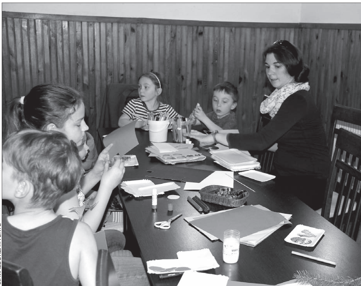
Organizatorzy wydarzenia zadbałi również o atrakcje dla najmłodszych.