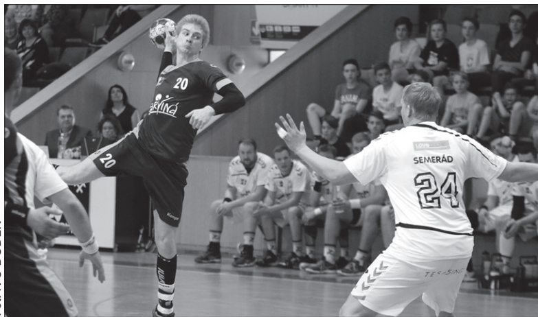
Banik we własnej hali wyrównał stan ćwierćfinałowej rywalizacji na 2:2.