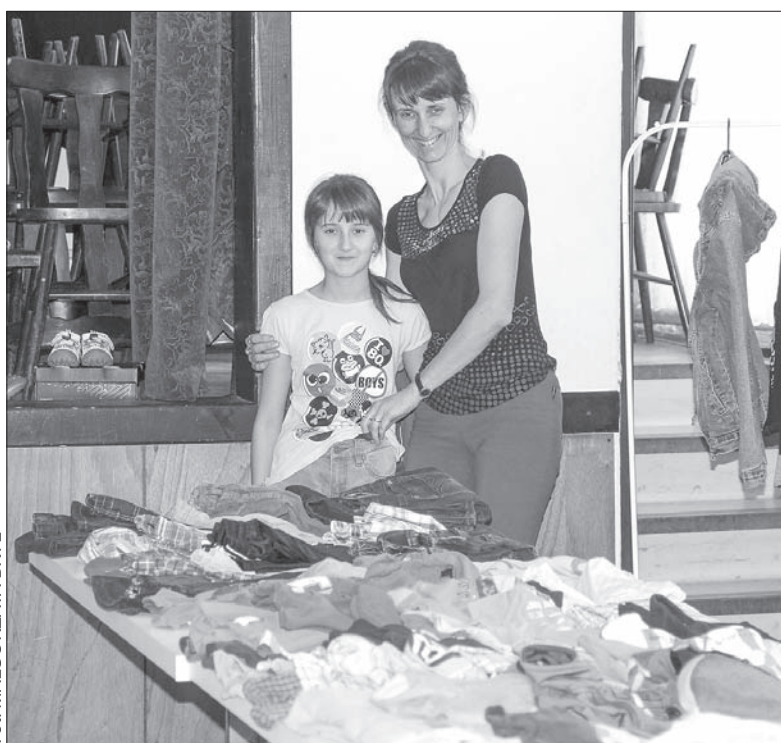
Bazar odbył się już po raz szósty.