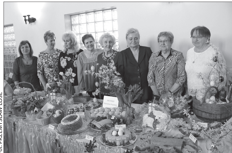
Reprezentantki PZKO Karwinia-Frysztat zdobyły jedną z konkursowych nagród.

– Stanowisko sąsiadek zza Olzy było naprawdę rewelacyjne. Wszystko nam smakowało, a hitem okazała