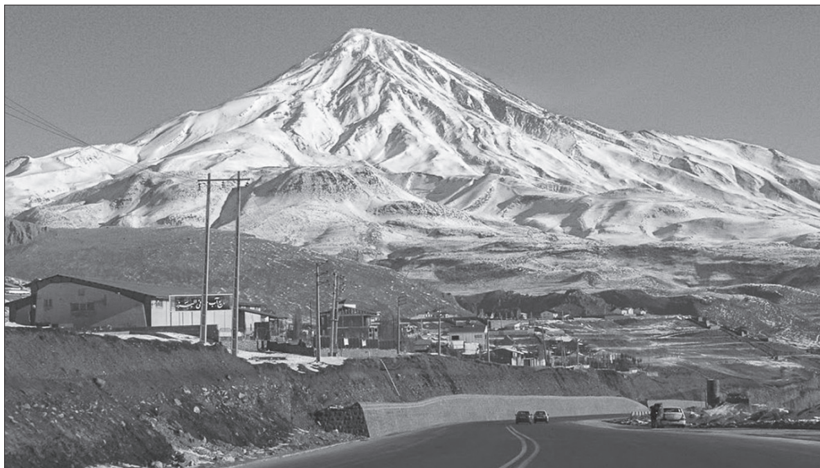
Demawend, najwyższa góra Iranu.