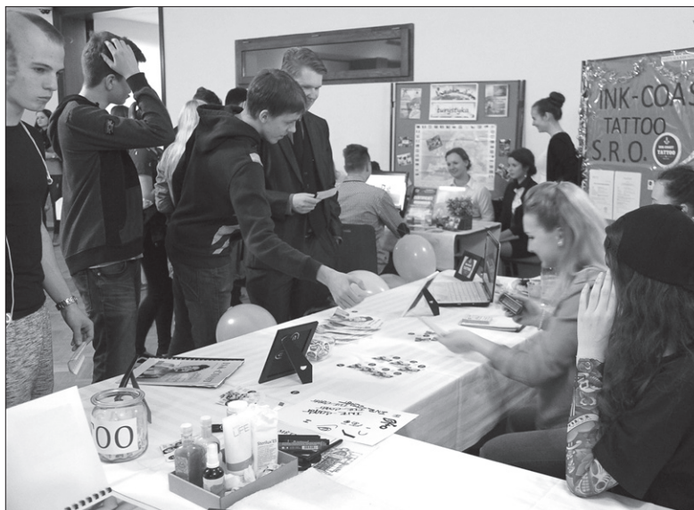
Targi uczą młodzież kreatywności.

Podczas targów uczniowie nie tylko prezentują swoje produkty rówieśnikom, ale są także oceniani przez profesjonalnych jurorów. – Ci oceniają prezentacje na stoiskach przedstawicieli firm symulacyjnych, katalog firmowy, a także prezentację stoiska. Ocenie podlega także aktywność przedstawicieli oraz sposób kontaktu z klientem. W jury zasiadają przedsiębiorcy z realnych firm, a także osoby, z którymi współpra-