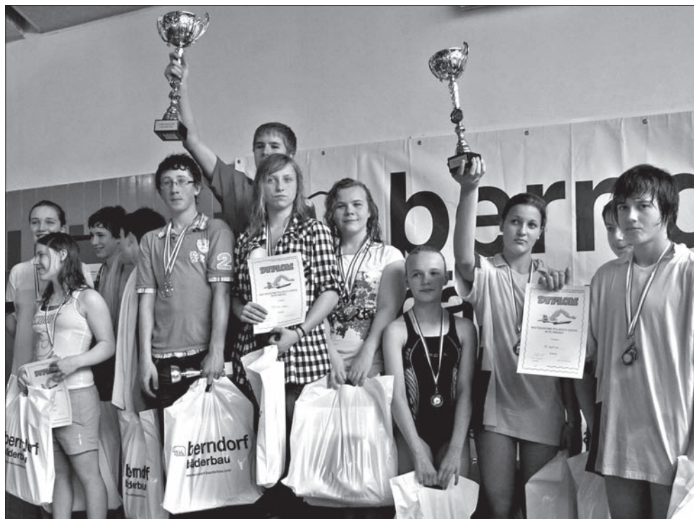
Na podium sztafety z Czeskiego Cieszyna, Bystrzycy oraz reprezentanci czeskiej bystrzyckiej szkoły.