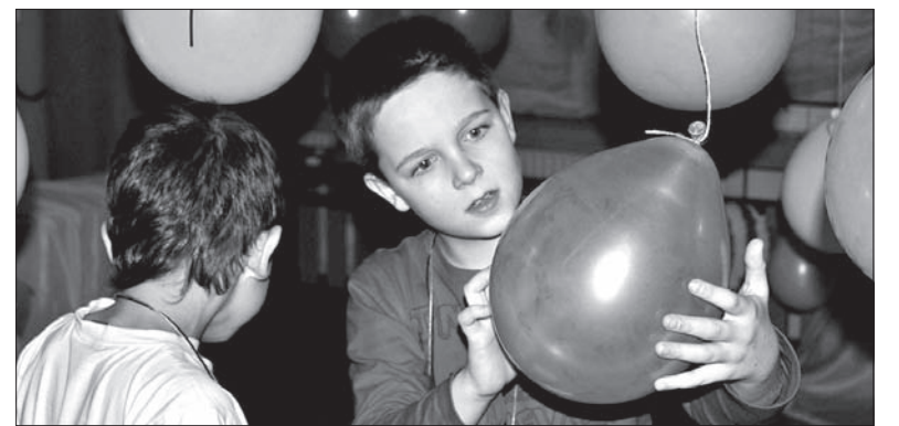
„Noc w szkole” w Sibicy.

teratury Polskiej Biblioteki Regionalnej w Karwinie odbyła się ósma edycja „Wieczoru z Andersenem”. Imprezę rozpoczęliśmy tradycyjnie w parku pod „baśniowcem” Andersena, gdzie następnie szukaliśmy skarbu i na rozgrzewkę przeprowadziliśmy wyścigi z balonikami i piłeczkami. Biblioteka była w ten wieczór dla nas Stumilowym Lasem, w którym buchaliśmy się wesoło z Kubusiem Puchatkiem i jego przyjaciółmi. Spacerując po Stumilowym Lesie rozwiązywaliśmy różne zadania,