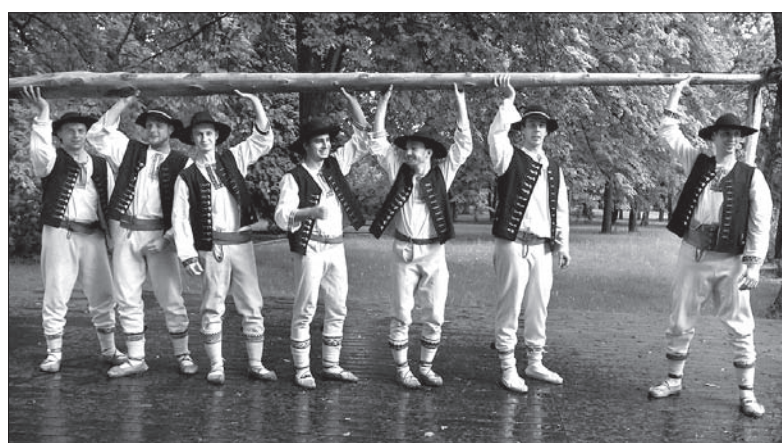
W 2010 roku „moja” postawił zespół „Oldrzychowice”.