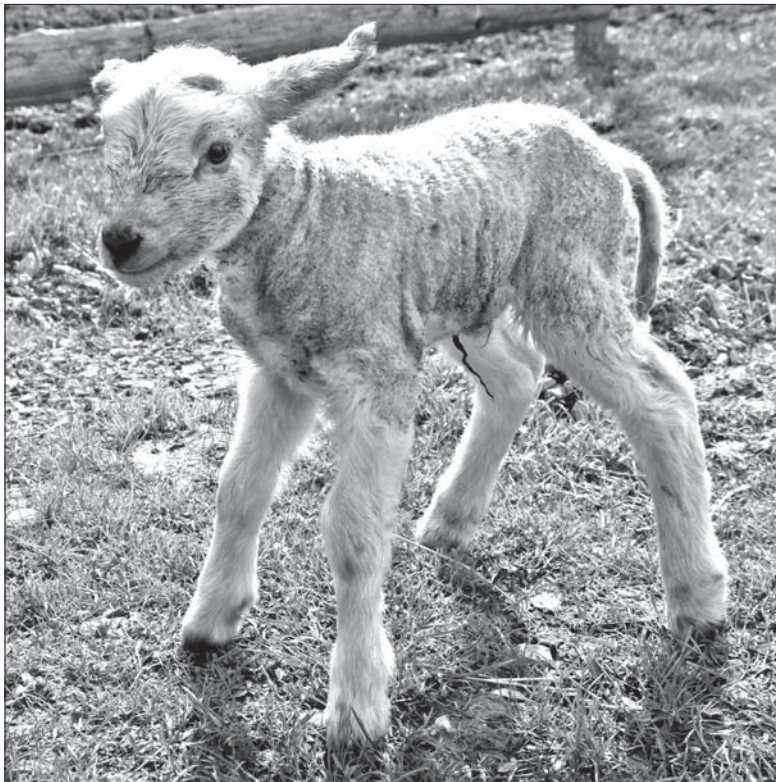
Już jednodniowe jagnię porusza się o własnych siłach.

Najlepsze jest, oczywiście, mleko owcy. Ale tego nie jesteśmy w stanie załatwić, bo wszystkie mamy owce mają swoje jagniątko i nie chcemy im odbierać mleka. Przygotowujemy więc specjalną mieszaninę z mleka krowiego, do której dodajemy witaminę D, trochę glukozy i trochę żółtka z jajka,