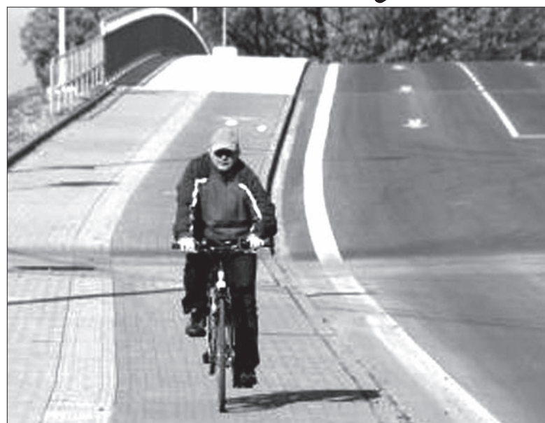
Okolice Bogumina to raj dla rowerzystów.

Nowa ścieżka rowerowa, której długość będzie wynosiła prawie kilometr, będzie połączona z istniejącą już ścieżką dla pieszych i turystów. W skład nowej ścieżki rowerowej