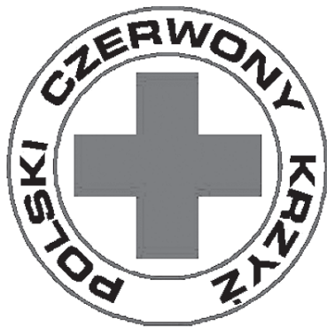
Ten znaczek wywołuje same pozytywne skojarzenia.

PCK to organizacja o bogatej tradycji. Została założona w styczniu 1919 roku na spotkaniu zwołanym przez Stowarzyszenie Samarytanin