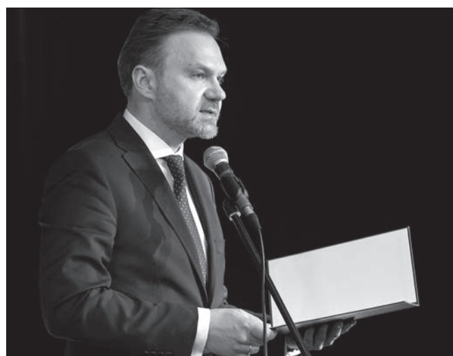
Artur Warzocha, senator RP, który odczytał list od marszałka Senatu.