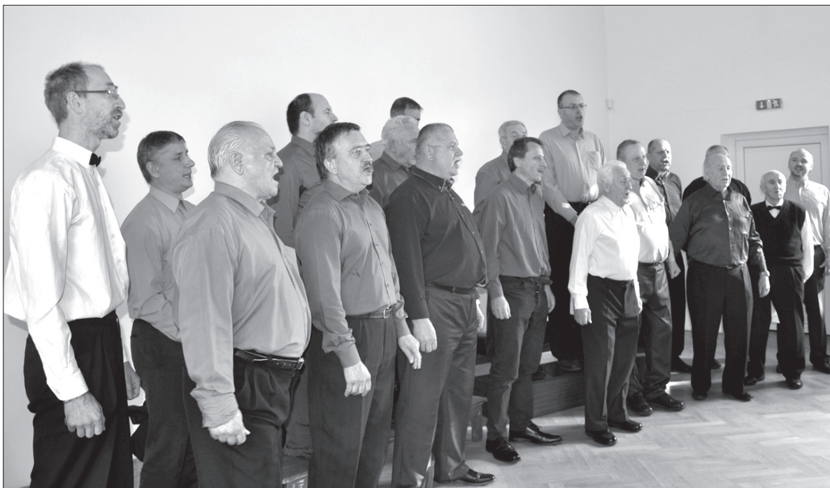
Panowie z „Hejnał-Echo” zaśpiewali w kolorowych koszulach.