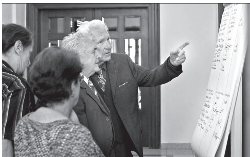
Lista kandydatów do Rady Kongresu budziła duże emocje.