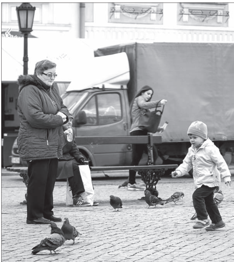
Na emeryturze m.in. spędzamy czas z wnukami.

Innym rozwiązaniem jest brakujące lata składkowe po prostu przepracować, a dopiero potem wystąpić o przyznanie emerytury. W wielu przypadkach jest to jednak całkowicie nierealne. Szczególnie osoby od wielu lat bezrobotne, bezskutecznie szukające pracy, na pewno nie znajdą jej „na starość”, skoro wcześniej nigdy im się to nie udawało.