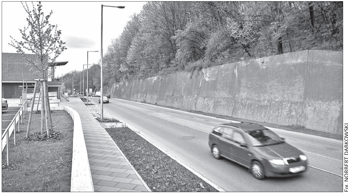
Szpecący mur doczeka się remontu.