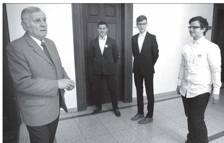
Pomocą podczas Zgromadzenia Ogólnego służyli delegatom uczniowie Polskiego Gimnazjum im. Juliusza Słowackiego w Czeskim Cieszynie.