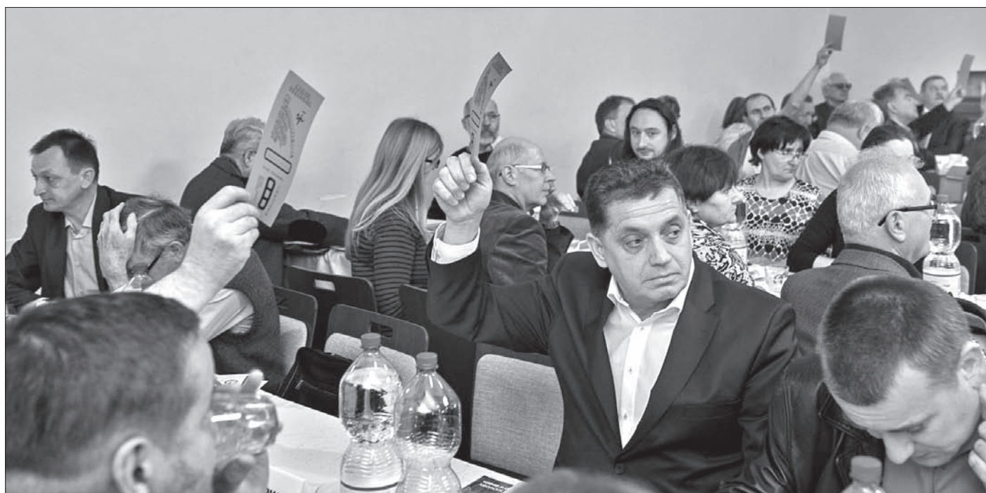
W sobotę w czeskocieszyńskiej „Strzelnicy” odbyło się wiele głosowań.