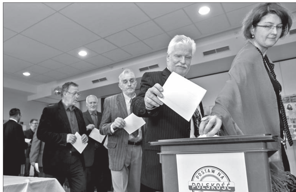
Jeden z ważniejszych punktów obrad – wybór Rady Kongresu.